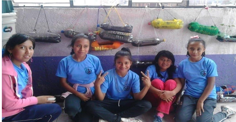
Fotografía 4. Alumnas de sexto con su proyecto.