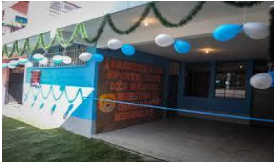
Fotografía 2. Escuela Belarmino Manuel Molina

Una de las características de la escuela es que es muy unida por el entes, practicantes y alumnas.