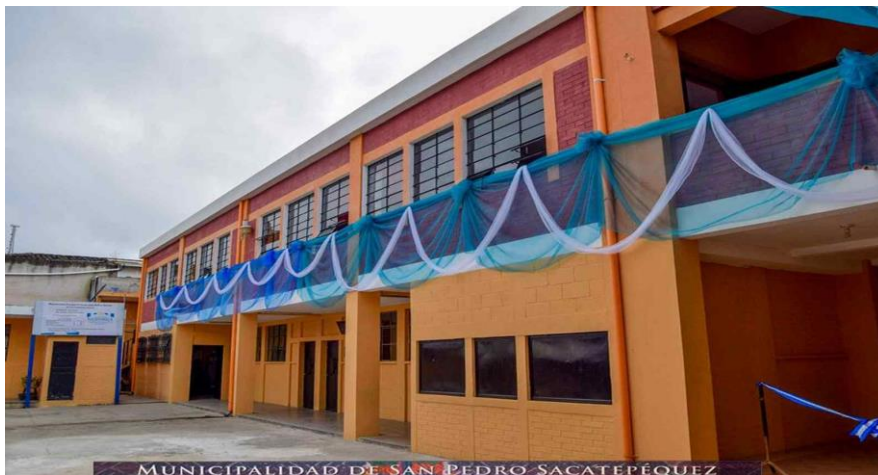
Fotografía 1. Escuela Oficial Urbana Mixta Justo Rufino Barrios.

La escuela mantiene la disciplina y control dentro y fuera del establecimiento, involucrando a los padres de familia en actividades extraescolares para mejorar las relaciones familiares y así mejorar el proceso educativo de los y las estudiantes, de esta manera contribuimos en evitar el bullying con aplicación de normas de convivencia estudiantil.