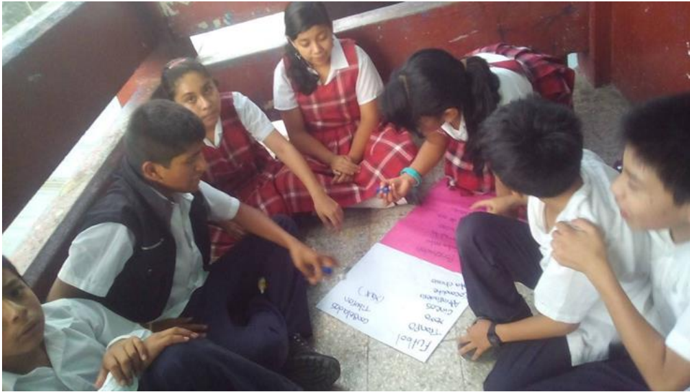
Fotografía No. 5

Descripción: Alumnos trabajando fuera del salón, trabajando en equipo.