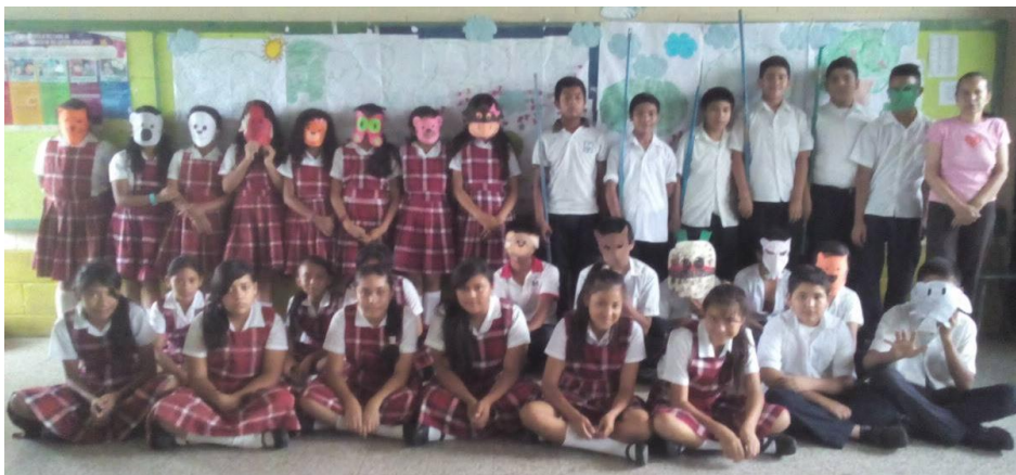
Fotografía No. 10

Descripción: Alumnos de 6to. Primaria junto a la maestra Titular.