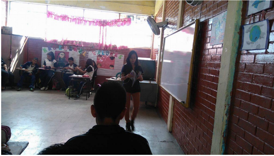
Fotografía No. 11

Descripción: Aparezco en esta fotografía, impartiendo clases en el Instituto Juan Diéguez Olaverri.