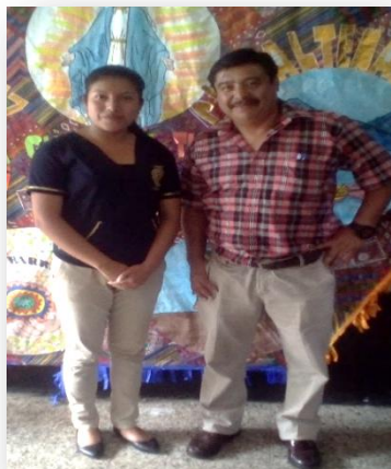
Fotografía No. 18