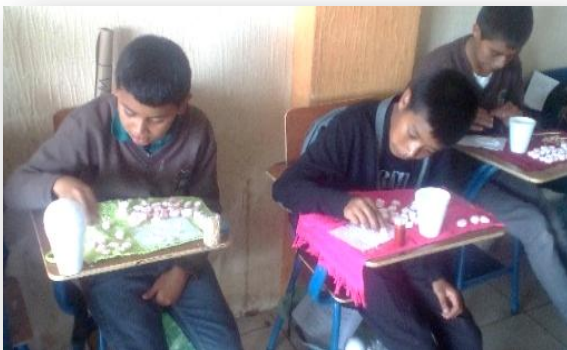
Fotografía No. 6