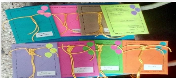
Fotografía No. 9

Como se puede visualizar en las imágenes, se muestran los nudos realizados.