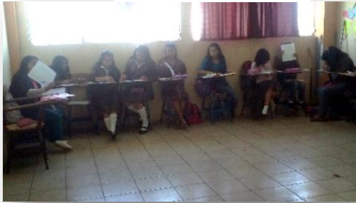
Fotografía No. 10