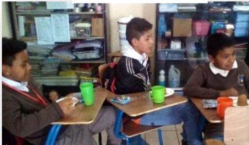
Fotografía No. 12