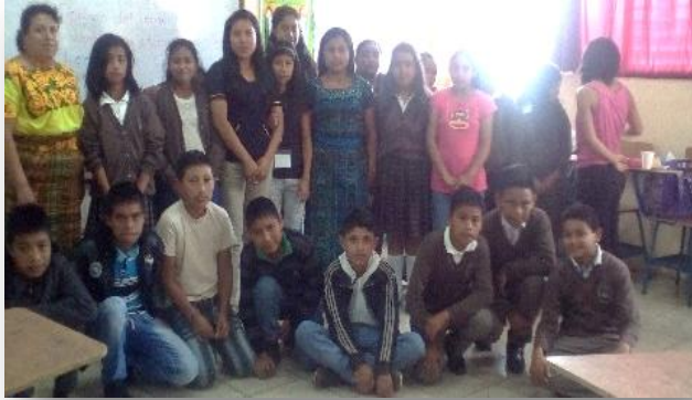
Fotografía No. 14