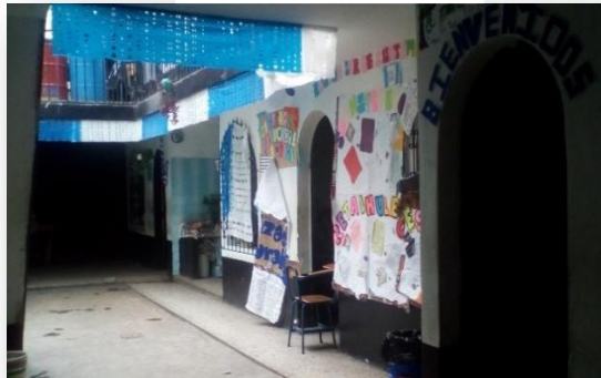
Fotografía No. 16