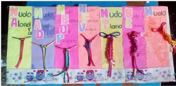
Fotografía No. 8

Como se puede visualizar en las imágenes, se muestran los nudos realizados.