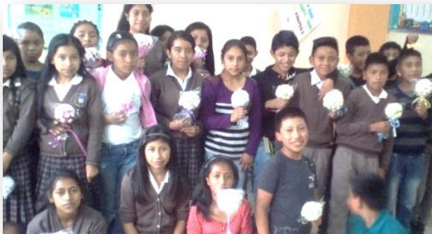
Fotografía No. 7

Cuando se llegó al último paso que consistía en introducir el topiario en una bolsa de cristal para tener una protección del polvo, les dije que lo amarran con el listón; al palo que tenía como base, otros lo amararon y le realizaron una moña con colochos colgando, cada uno le dio un toque personal conforme a su creatividad.