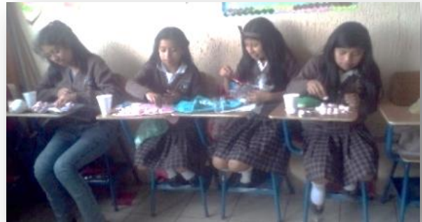
Fotografía No. 5

Algunas alumnas que eran un poco perfeccionistas se atrasaban ya que ellas querían que les quedara bien elaborado entonces yo las tenía que presionar un poco para que todos trabajaran al mismo ritmo y ninguno se atrasara.