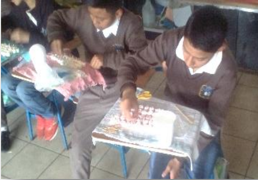
Fotografía No. 4

para lavarnos las manos ya que realizaríamos un proyecto que era comestible, salieron en orden y regresaron en orden a la clase.