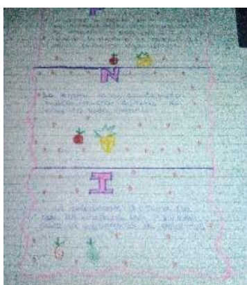
Fotografía No. 12 Actividad del PNI sobre la unidad

Cuando estábamos conversando de ese aspecto una de las señoritas de esa sección me decía que ella no se explicaba como yo podía estudiar para maestra, y de la actitud que había tomado ante esa situación con ellos, ya que opte por el diálogo con todos los jóvenes de esa sección para mejorar la armonía en el salón de clases.