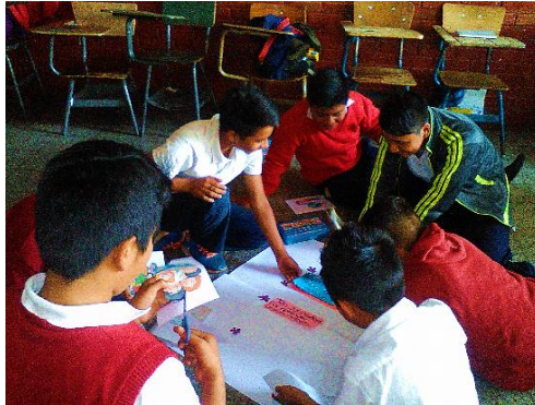
Fotografía No. 6 Elaboración de un cartel para el día de la madre

los docentes son muy entusiastas se transmite esa energía que hace que la clase se vuelva más amena.