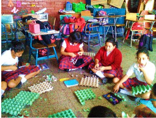
Fotografía No. 7 Estudiantes cortando cartón de huevo para realizar sus flores