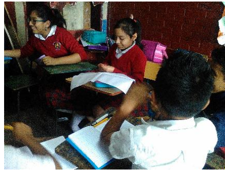
Fotografía No. 10 Trabajo en equipo, alternativas de solución a conflictos

caso en el aprendizaje colaborativo ya que es así como se nos facilita obtener información que sea positiva para el grupo de estudiantes. El aprendizaje colaborativo resulta ser una estrategia muy provechosa y favorable para los docentes, ya que los alumnos aprenden de una manera creativa y sobre todo de una forma significativa.