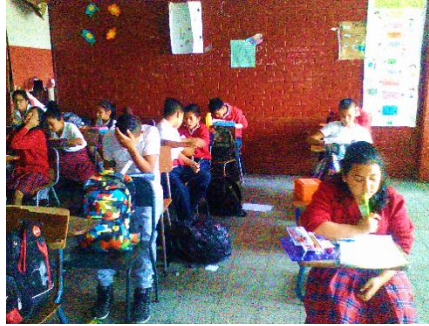
Fotografía No. 3 Estudiantes leyendo diversos libros previo a una evaluación de comprensión de lectura