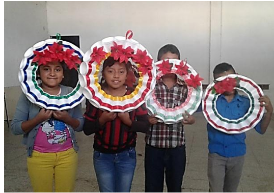
Fotografía No. 20 Coronas navideñas elaboradas de vasos