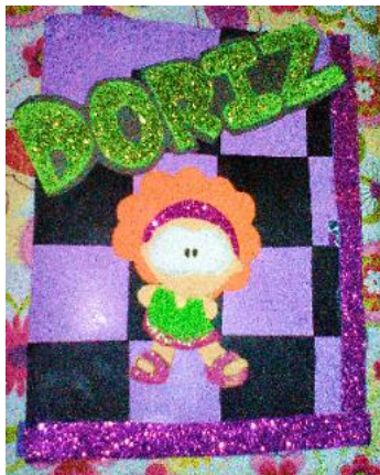
Fotografía No. 4 Elaboración de libros utilizando la técnica de origami

Es importante interactuar con los alumnos, para garantizar que él alumno controle y transforme creativamente su propio aprendizaje es necesario que el aprendizaje sea de calidad lo cual depende de muchos factores como la motivación, el desarrollo de habilidades y capacidades, el conocimiento previo que se tiene para aprender algo nuevo y las vivencias efectivas, los docentes tenemos que conducir al alumnos por el camino del conocimiento haciendo de ellos individuos competentes.