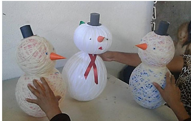
Fotografía No. 21 Muñeco de nieves elaborado con globos y lana