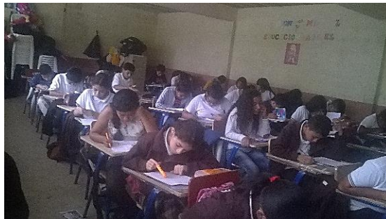
Fotografía No. 11 Elaboración de sopa de letras sobre el tema inserción laboral

Luego de esas indicaciones les di teoría sobre el tema, utilicé como material didáctico unos carteles coloridos e imágenes para hacer más amena la clase, al terminar de exponer el tema, realizaron una sopa de letras, me encantó el entusiasmo y la dedicación que presentaron durante la actividad, todos estaban concentrados realizando el trabajo, incluso la seño estaba concentrada buscando las palabras requeridas en la sopa de letras.