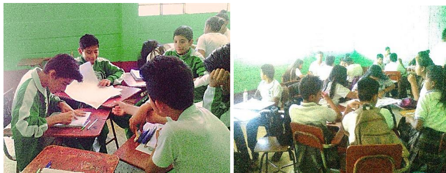
Fotografía No. 22 Trabajos en equipos