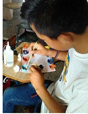
Fotografía No. 8 Decoración de flores ultimando detalles para colocar imagen.