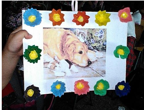
Fotografía No. 9 Cuadro artístico terminado