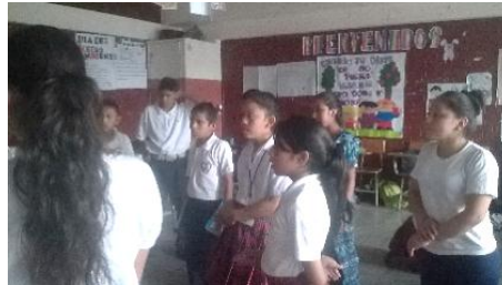
Fotografía No. 5 Exposición de experiencias

El aprendizaje significativo es producto del aprendizaje por descubrimiento, ya que al conocer algo nuevo podemos reflexionar inmediatamente sobre ese algo, opinar, indagar y sobre toda dar nuestro punto de vista sobre el mismo logrando con esto que los estudiantes obtengan un aprendizaje de calidad.