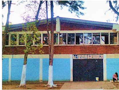
Fotografía No. 1 Escuela Ricardo Castañeda Paganini