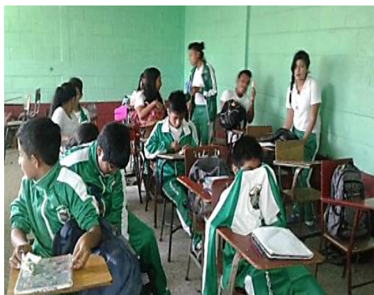
Fotografía No. 13 Exposición del PNI