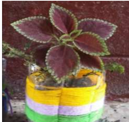
Figura 10. Ejemplo de proyecto de reciclaje

Todos empezaron a trabajar su proyecto, cortando la botella y luego poder pintarla o colocarle la lana alrededor de la botella. Se llevaron más o menos 45 minutos para realizar el proyecto.