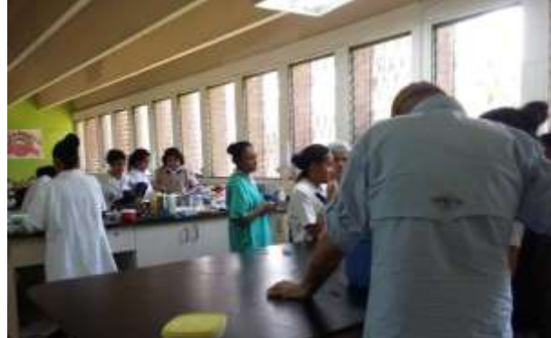
Figura 19. Preparando el queso con Mora y Loroco

Aprendí que para generar empresas eficientes y eficaces se debe formar al estudiante con un espíritu emprendedor desde muy temprana edad para que en un futuro logren ser unos profesionales exitosos y productivos.