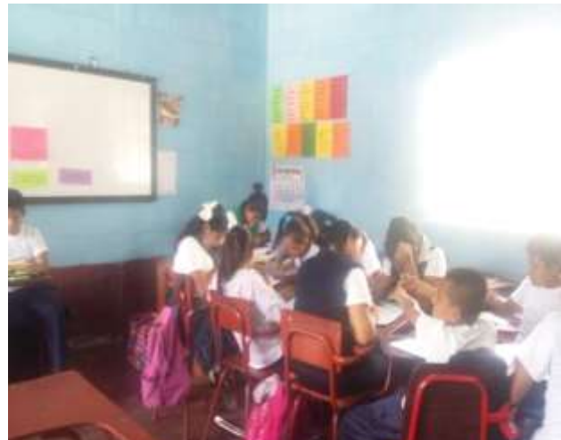
Figura 15. Actividad en Grupos

Los alumnos de sexto primaria le tomaron importancia a la clase de productividad y desarrollo ya que fue muy dinámicas las actividades, logrando que cada uno de los estudiantes tomaran conciencia de los problemas sociales que afectaban a su comunidad, con el fin de poder solucionar cada problema de su entorno.