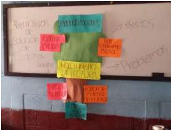
Figura 39. Material Didáctico de los Problemas Sociales