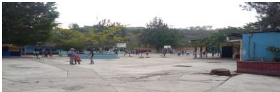
Escuela de Educación Mixta de Villa Hermosa