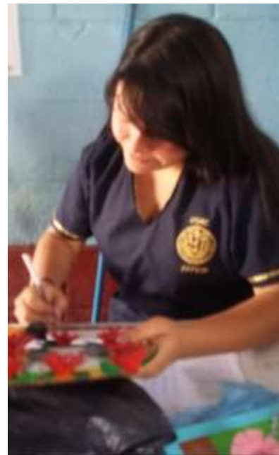
Figura 36. Calificando Proyectos, realizados por los estudiantes de Sexto Primaria