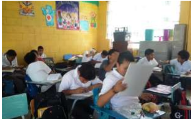
Figura 9. Trabajando ejercicios del MCM.

Cuando vi ese problema que tenía el grupo de alumnos en la clase, fui a observar si todos estaban realizando bien sus ejercicios, pero solo como el 20% de los estudiantes sí sabía lo que estaban haciendo. Les pregunté si estaban entendiendo el tema para que yo les volviera explicar cómo se realizaba los ejercicios, todos me contestaron que si querían que volviera a abordar el tema, porque el docente solo explicaba una vez y no volvía a explicarles.