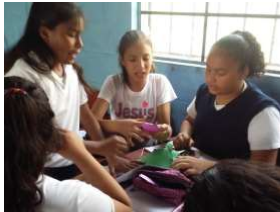
Figura 40. Trabajando en equipo