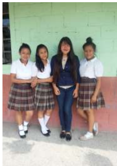
Figura 44. Estudiantes de INEB Tezulutlán