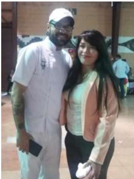
Figura 22. Chef Milo en la exposición de Cocina Internacional

Los alumnos realizaron grupos para poder realizar su venta de comida, los platillos internacionales que realizaron fue de China, Italia, Francia y de Israel. Dar a conocer todo lo que habían realizado en el transcurso del laboratorio de cocina ayudó a que los estudiantes tuvieran una nueva experiencia en la práctica de productividad y desarrollo.