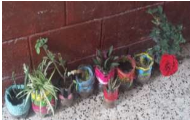
Figura 12. Finalización de proyecto de reciclaje

Fomentar la educación ambiental en los niños por medio de la práctica generara en ellos una conciencia en valores socio ambientales, técnicas y comportamientos ecológicos y éticos en consonancia con el desarrollo sostenible y que favorecerán la participación de la comunidad educativa más efectiva en decisiones.