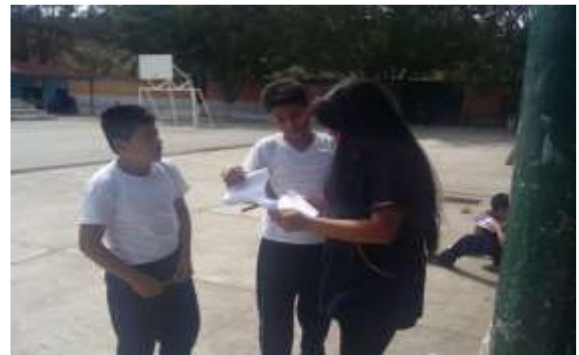
Figura 30. Actividad de las técnicas de investigación