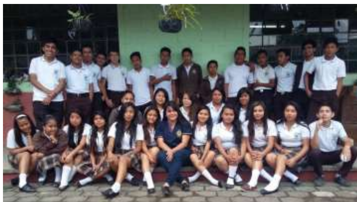
Figura 45. Estudiantes de Tercero Básico de la Práctica de Aplicación Didáctica.