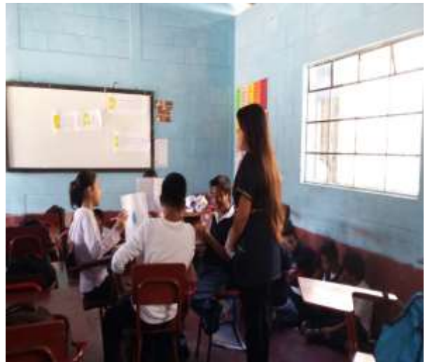
Figura 13. Primer día de Práctica de aplicación didáctica en el nivel primario.

Empecé a interactuar con ellos de qué problemas han visto en su establecimiento; los lleve a las canchas utilizando una de las técnicas de investigación social “Observación” les entregue una hoja en blanco donde tenían que colocar cuales problemas habían visto y que al entrar al salón me iban a comentar un problema. Estuvieron observando y cuando entramos al salón la mayoría de los estudiantes contestaron que la discriminación era uno de los problemas más destacados en el centro educativo.