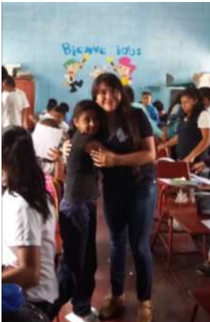
Figura 35. Despedida de la Práctica docente en el Nivel Primario.