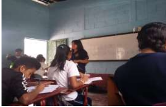
Figura 37. Impartiendo clase de Productividad y Desarrollo