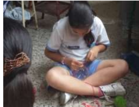
Figura 11. Elaboración de proyecto de reciclaje

La educación ambiental es un proceso que ayuda a que los estudiantes tomen conciencia sobre los valores y aclara conceptos centrados en fomentar las actitudes, destrezas, habilidades y aptitudes necesarias para poder comprender y apreciar las interrelaciones entre el ser humano, su cultura y la interrelación con la naturaleza.