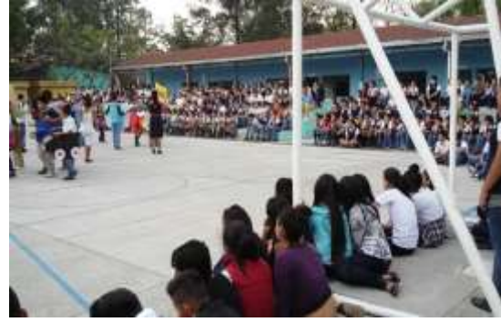
Figura 38. Acto Cívico del día de la Tierra