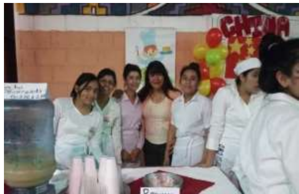
Figura 20. Alumnos de 3ro. Básico

Llegué a las 10:00 de la mañana a la exposición y venta de comida que se realizó en el salón de usos múltiples, empezaron todos a organizar la actividad. Ordenaron