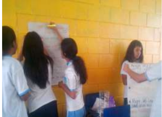
Figura 6. Colocación de Normas de convivencia

Finalizaron la norma de convivencia asignada y las colocaron en el salón de clases, todos los carteles estaban muy creativos. Después continuamos con las actividades asignadas por el docente.