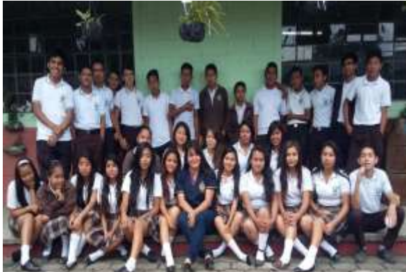
Figura 24. Alumnos de Tercero Básico Sección "C"

es el reflejo de nosotros mismos ya que mejora las relación entre maestro y alumno, la comunicación será más asertiva, el aprendizaje en ellos será mas significativa y el clima de clase mejorará.