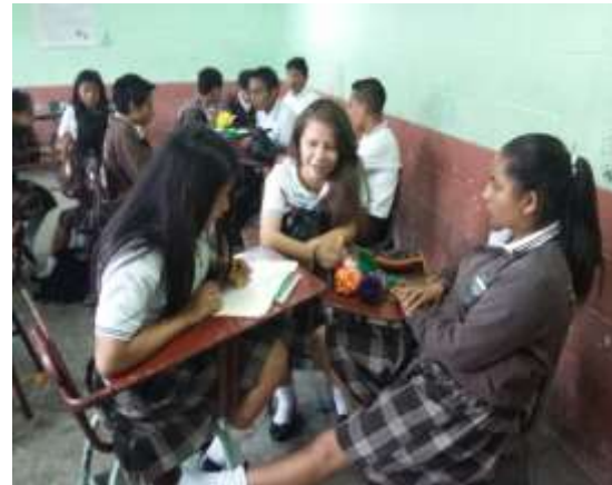
Figura 42. Elaboración de proyecto de Macramé.