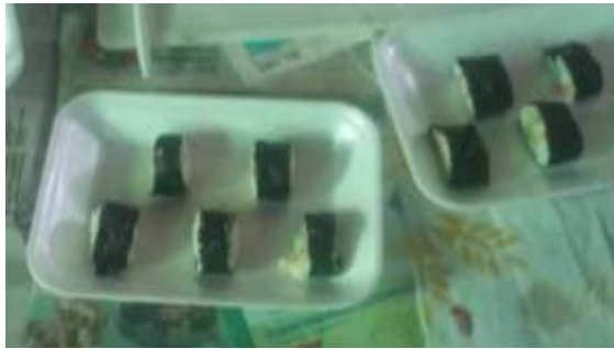
Figura 21. Platillo de Sushi

preparativos para vender y se cambiaron de ropa para una mejor presentación en su microempresa.