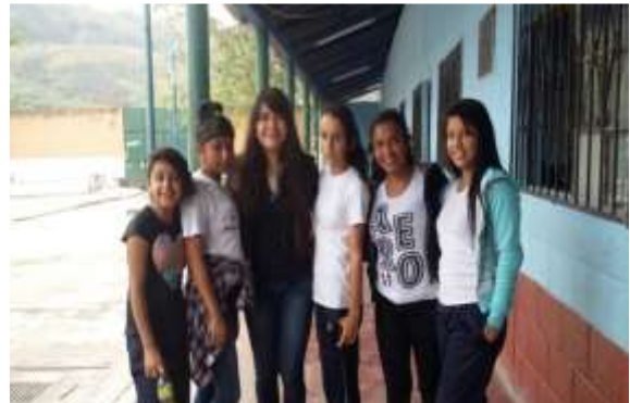
Figura 28. Alumnas de la Escuela de Educación Primaria Villa Hermosa 2