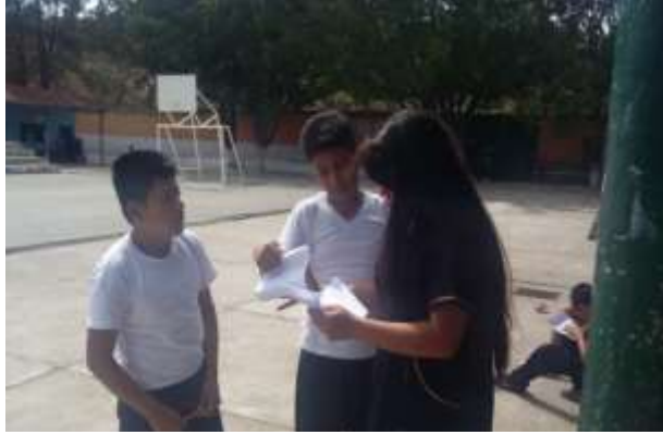
Figura 14. Actividad activa sobre las Técnicas de investigación social

En la forma que trabajé con los estudiantes, fue de manera activa participativa y esto ayudó a lograr las competencias e indicadores de logro que el Curriculum Nacional Base CNB establece para que el estudiante logre un aprendizaje eficiente. Por medio de este método activo