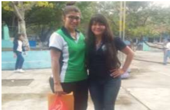
Figura 29. Docente Titular de las Práctica de Aplicación Didáctica