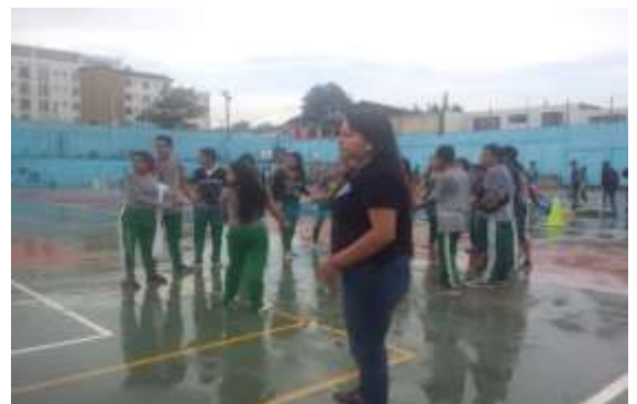
Figura 32. Actividad deportiva con los estudiantes.