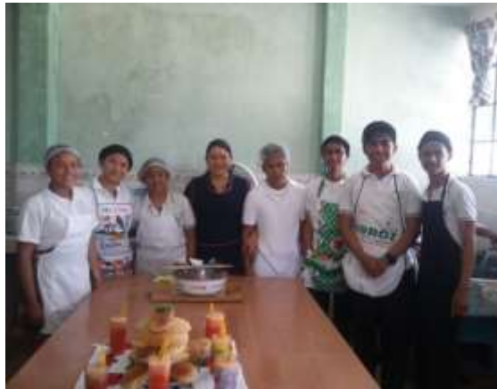
Figura 41. Laboratorio de Cocina