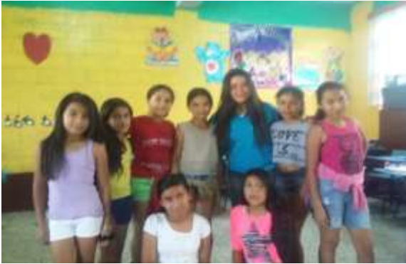
Figura 27. Actividad de teatro con los alumnos de sexto primaria en la Práctica de Auxiliatura en el Nivel Primario