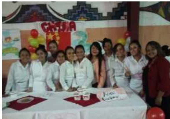
Figura 23. Exposición y venta de comida china.

La iniciativa que tomó el MINEDUC de implementar un programa sobre comida internacional y saludable logró una totalidad de competencias en la calidad y eficacia de la educación de los estudiantes ya que se logró que desarrollaran más su confianza, habilidades y destrezas en el Alimentos. Se promovió la incrementación de la creatividad e innovación incluyendo el espíritu empresarial en todos los alumnos, ya que el Chef Milo generó un aprendizaje participativo fomentando en ellos sueños de ser personas productivas.