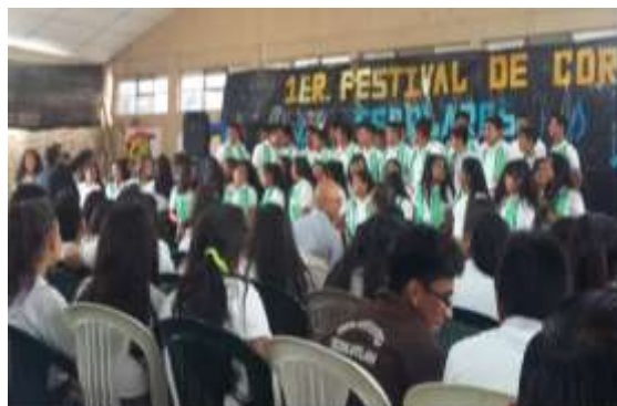
Figura 31. Alumno de INEB Tezulutlán.