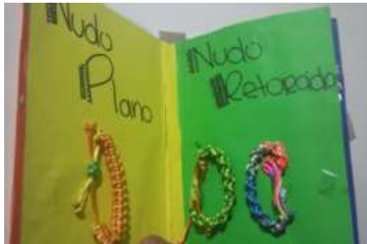
Figura 26. Muestrario de Macramé.

En total eran 4 técnicas que iban a aprender, esta actividad me llevó 2