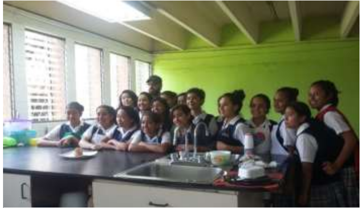
Figura 18. Alumnos de Segundo Básico

Al finalizar la clase de cocina el Chef concluyo con una breve información sobre lo que habían hecho; como: las diferentes maneras de hacer queso, en donde lo podían vender, como podían formar su propia empresa por medio de ello, fue una