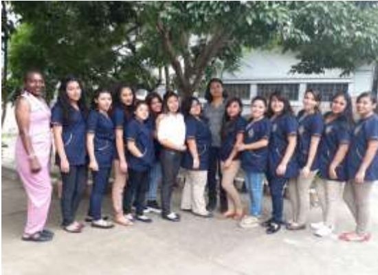
Figura 33. Practicantes del Instituto Nacional de Educación Básica Tezulutlán.