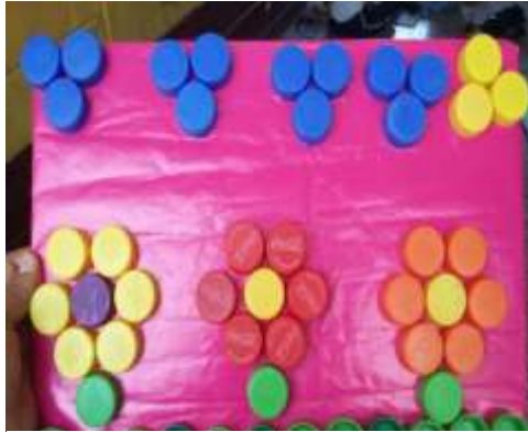
Figura 7. Elaboración de proyecto de tapitas