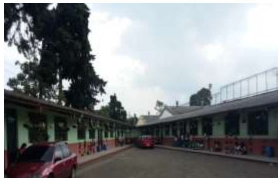
Figura 4. Instituto Nacional de Educación Básica “Tezulutlán”

La escuela tiene amplias instalaciones, que se adecúan por si hay algún desastre natural. Tienen área recreativa para que los estudiantes puedan practicar deporte, entre ellas natación, basquetbol, futbol, etc. El mobiliario y equipo de esta institución se encuentra muy estables, el control de limpieza y disciplina están manejados por diferentes maestros lo cual ayuda a que los estudiantes de la institución tomen conciencia sobre ello.