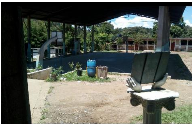
Fotografía NO. 6

Cancha deportiva del INEB "Maria de Mattias" aldea la Labor Vieja