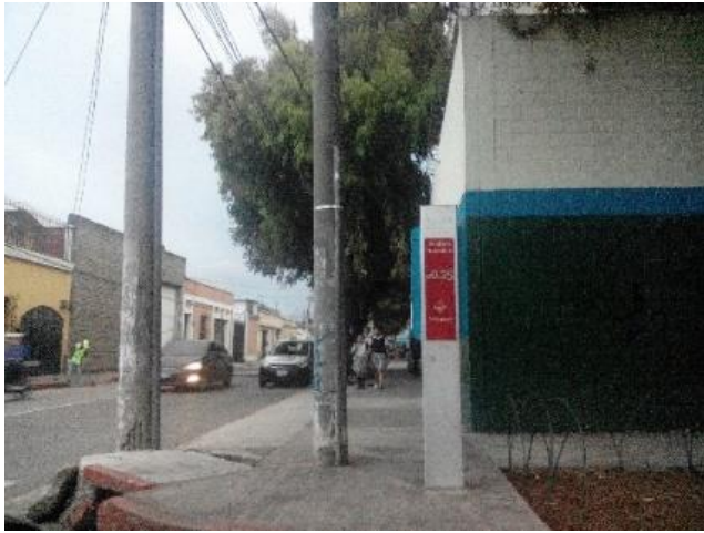
fotografía No. 1