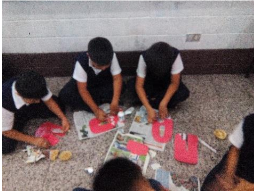
Fotografía No. 9

Alumnos de 3ro primaria trabajando en la decoración de letras para la rotulación del proyecto