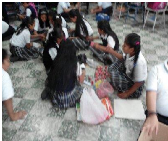
fotografía No. 13

Equipo de alumnas limpiando y pintando tapaderas para la elaboración de las tablas de multiplicar.