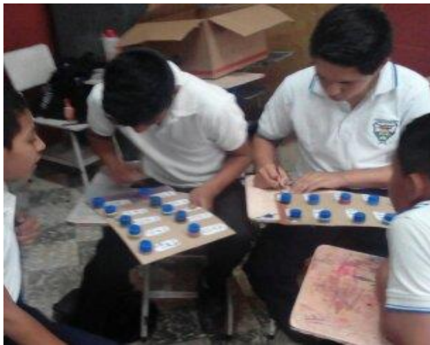
Fotografía No. 12

Alumnos de 4to primaria trabajando en equipo, el material para sus tablas de multiplicar.