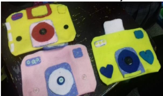
Figura No. 2 Ejemplares de la bolsa de fieltro elaborada por los estudiantes de la EOUM Susana Illescas de Palomo.

Se debe de aplicar la práctica en el aprendizaje de los niños, no solamente están desarrollando sus habilidades motrices si no a la vez nos da la oportunidad de evaluar si lo que se les ha enseñado es significativo para ellos. En el libro “Libertad y creatividad en la educación”, Rogers (2006)