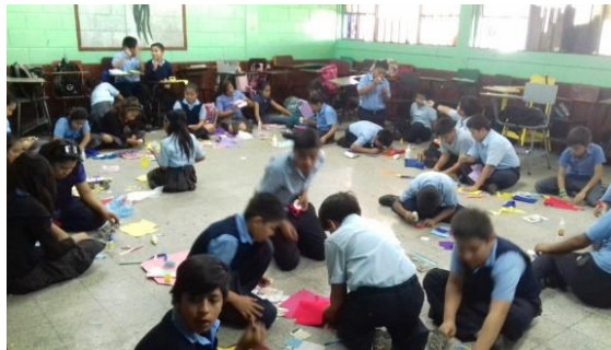
Figura No. 1. Estudiantes trabajando en la bolsa de fieltro de la EOUM Susan Illescas de Palomo.

Observé que esto llamó mucho la atención de los niños y automáticamente cuando yo empecé a hablar capté la atención de todos y guardaron silencio cuando yo di instrucciones. A cada uno le entregue un patrón que utilizarían para la realización de la bolsa, íbamos paso a paso, sin que nadie se adelantara o se quedara atrás.