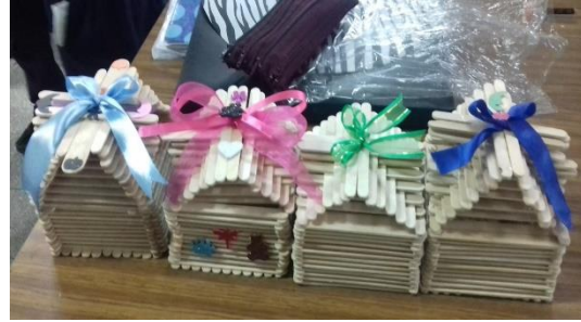
Figura No. 8 Ejemplares de los trabajos manuales.