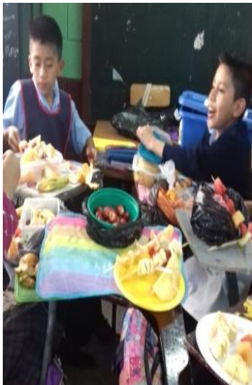
Figura No.5 Organización de ingredientes para coctel de frutas. Alumnos de la EOUM Susana Illescas de Palomo