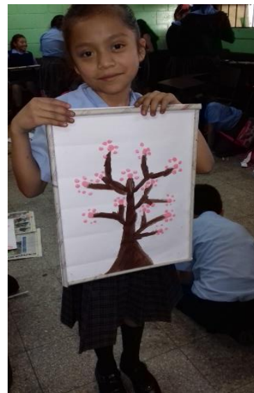
Figura No. 6 Pintura creativa elaborada elaborada por los estudiantes de cuarto grado de la EOUM Susana Illescas de Palomo