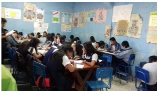
Figura No. 9 Alumnos de primer grado del INEB Miller Rock