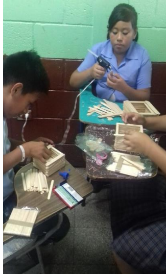
Figura No. 7 Elaboración de trabajo manual con paletas de madera. Alumnos de EOUM Susana Illescas de Palomo.