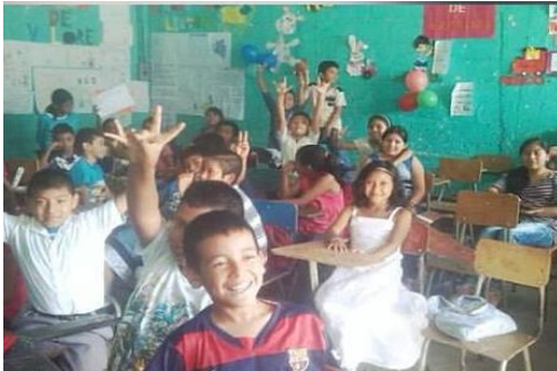
Figura No 3 Estudiantes de cuarto grado de la EOUM Prados de Villa Hermosa. Práctica de auxiliatura.