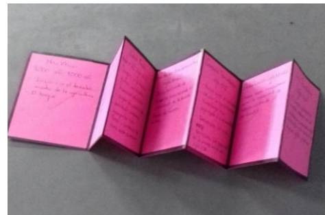
Figura No. 12 Ejemplar de doblez realizado en clase por alumnos del INEB Miller Rock