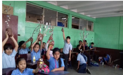
Figura No. 4 Presentación de proyecto manual. Alumnos de la EOUM Susana Illescas de Palomo