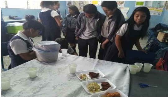
Figura No. 10 presentación de proyecto de evaluación. Alumnos del INEB Miller Rock