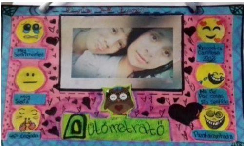
Figura No.11 autorretrato elaborado por los estudiantes del INEB Miller Rock