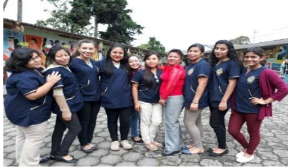
Fotografía No. 4 Practicantes y maestra titular en Instituto En educación Media “Tezulutlán”