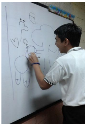
Fotografías 7 y 8