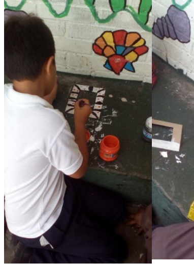
Fotografías 5 y 6

Estudiante de tercero primaria realizando un marco con técnicas de pintura para el proyecto realizado con materiales reusables.