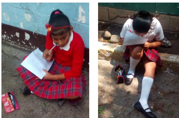
Fotografías 2 y 3

Estudiantes de cuarto grado realizando su prueba objetiva de la unidad temática.