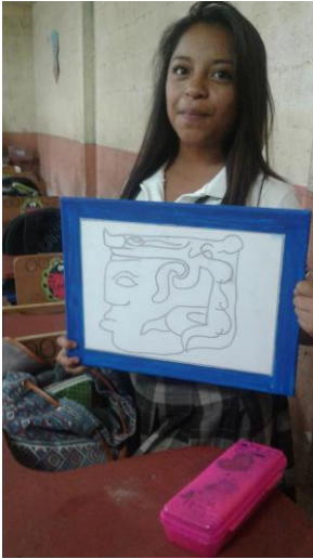
Fotografías 1, 2 y 3