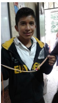
Fotografías 9 y 10