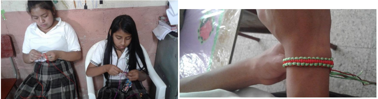
Estudiantes de primero básico sección "E" elaborando pulseras con diferentes técnicas de macramé.