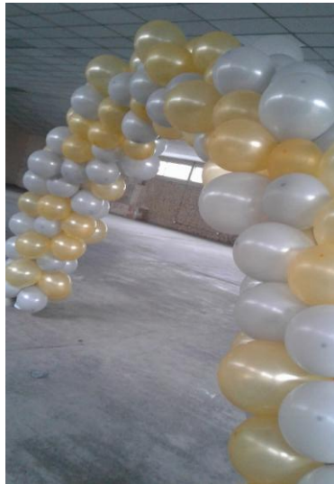
Fotografías 24 y 25