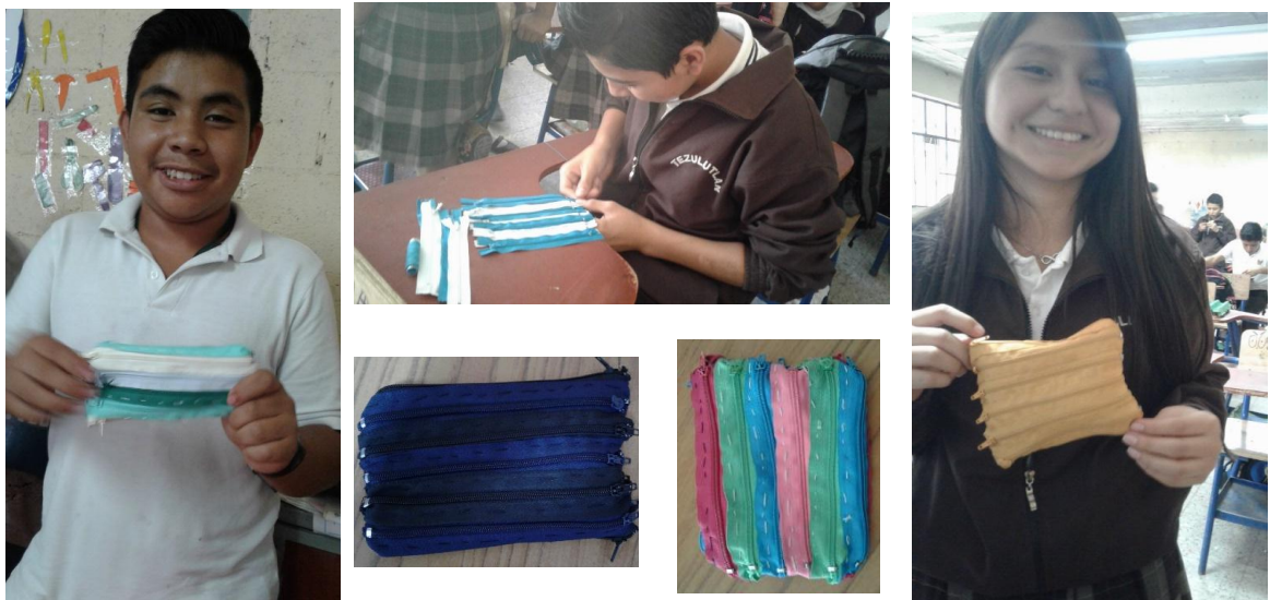
Estudiantes de primero básico sección "E" realizando estuches con zippers y algunos de los proyectos culminados.