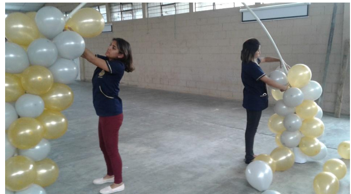
Decoración del salón y elaboración de arco con globos para la actividad de fiesta de aniversario INEB Tezulutlán.