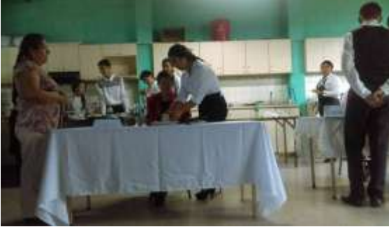
Fotografía No. 10

Alumnos destacados del instituto presentando su proyecto de recetas Guatemaltecas en el centro educativo.