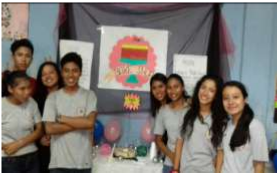
Fotografía No. 18

Alumnos de segundo básico presentando su proyecto empresarial.