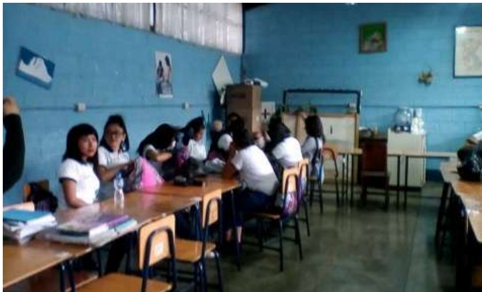
Fotografía No. 11

Cada contenido abordado en clase es aplicado de la mejor manera posible por medio de diversas actividades para los estudiantes, en el área de cocina por ejemplo se asegura que el alumnado reciba la información nutricional de cada platillo, les enseña a optimizar de la mejor manera los recursos de su hogar y les abre un horizonte de posibilidades para que ellos busquen constantemente ese desarrollo sostenible y sustentable primeramente de forma personal para que luego sean capaces de replicar en el ámbito familiar, escolar y comunitario dichos conocimientos.