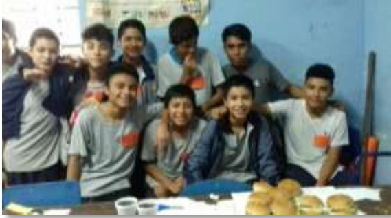
Fotografía No. 16

vive el alumnado, sirviéndoles de estímulo e impulso para la libre adopción de caminos o proyectos personales, en comunión fraterna y solidaria con el planeta. (p. 5).