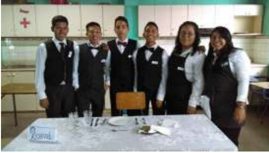
Fotografía No. 9

Alumnos destacados del instituto presentando su proyecto de recetas Guatemaltecas en el centro educativo.