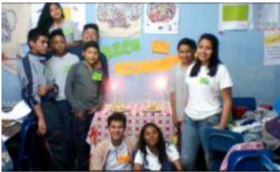
Fotografía No. 17

Alumnos de segundo básico presentando su proyecto empresarial.