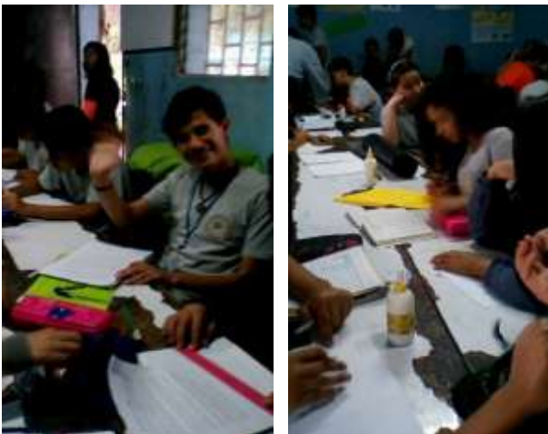
Fotografía No. 19 y 20

Alumnos de segundo básico en diversas actividades propuestas en el aula.