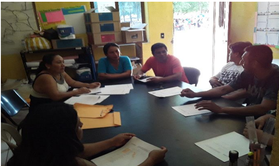
Ilustración 4 Socialización de los planes de acción