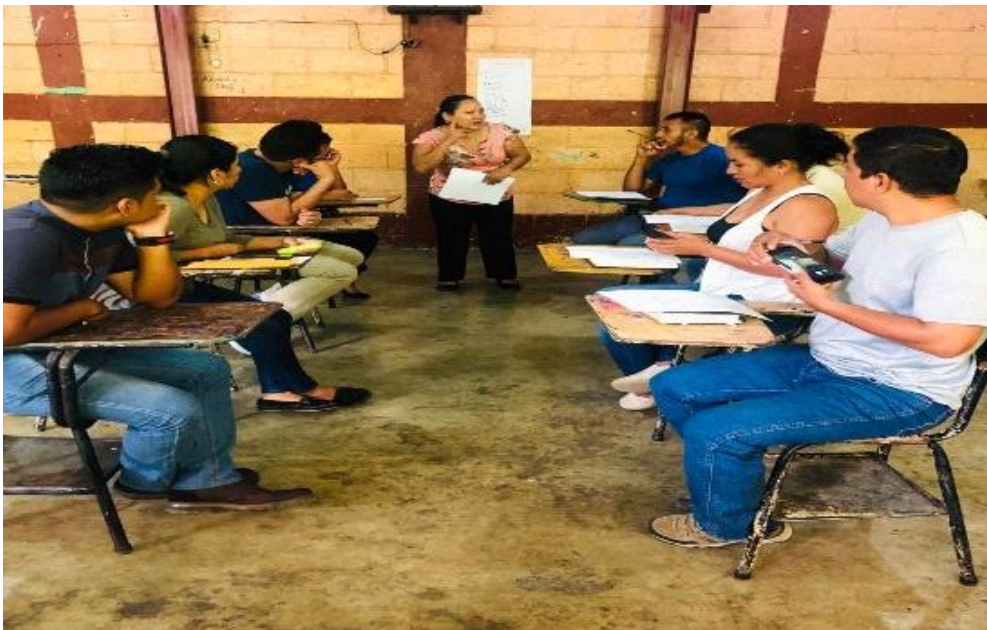
Ilustración 6 Post Test y comentarios finales