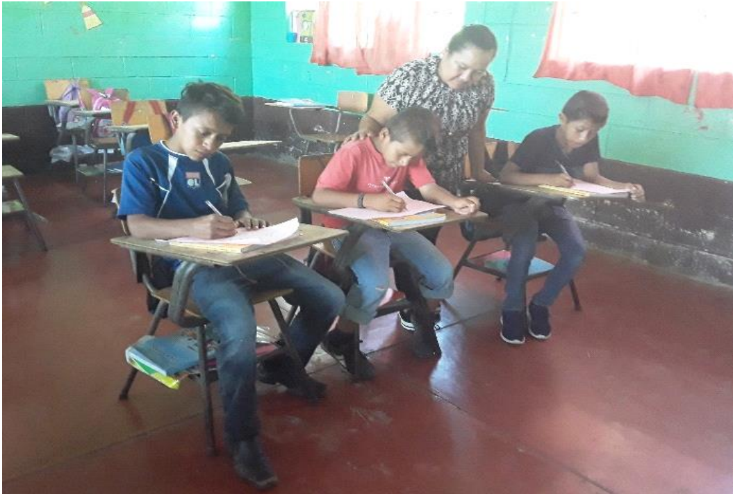
Ilustración 1 Aplicación de andamiaje en la EORM aldea Nueva Esperanza.