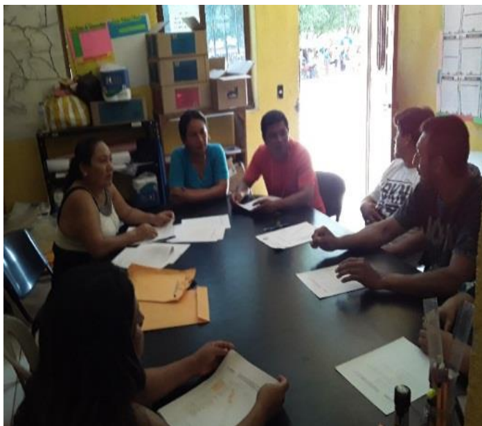
Ilustración Socialización de los planes de acción.

Para desarrollar mi práctica profesional y de acuerdo al diagnóstico, consideré el eje de modelos de lectoescritura en contextos bilingües e interculturales, tomando en cuenta que una de las debilidades de las evaluaciones a graduandos es deficiente, en el área de comunicación y lenguaje y los docentes no le han dado el interés necesario a la lectura, además manifiestan la falta de capacitación y orientación sobre herramientas de cómo mejorar la comprensión lectora.