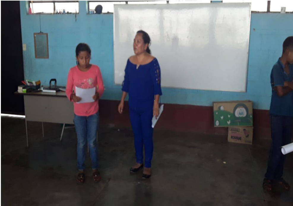
Ilustración 5 Concurso de lectura en la EORM aldea La Esperancita