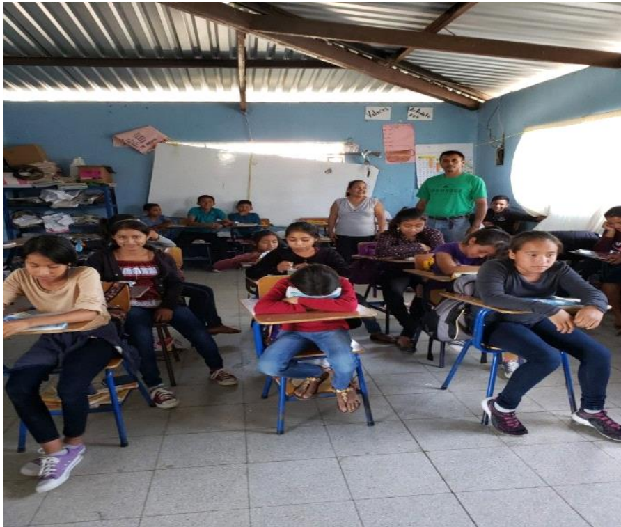
Ilustración 3 Herramienta Plus Delta en la EORM aldea Chacaj