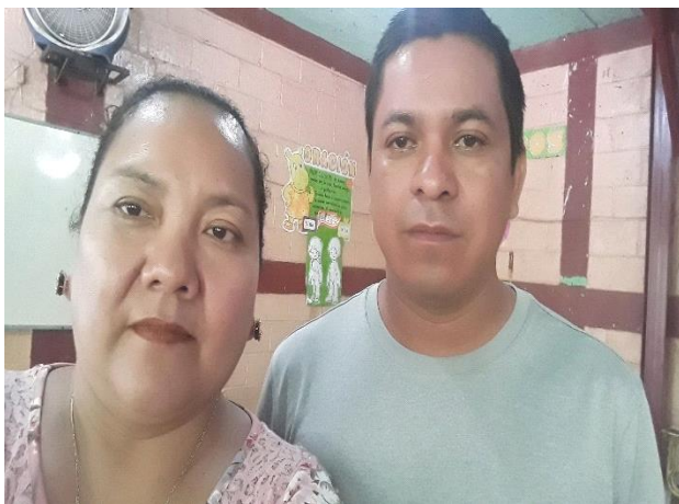
Figure 3 Visita a EORM aldea Nueva Concepción