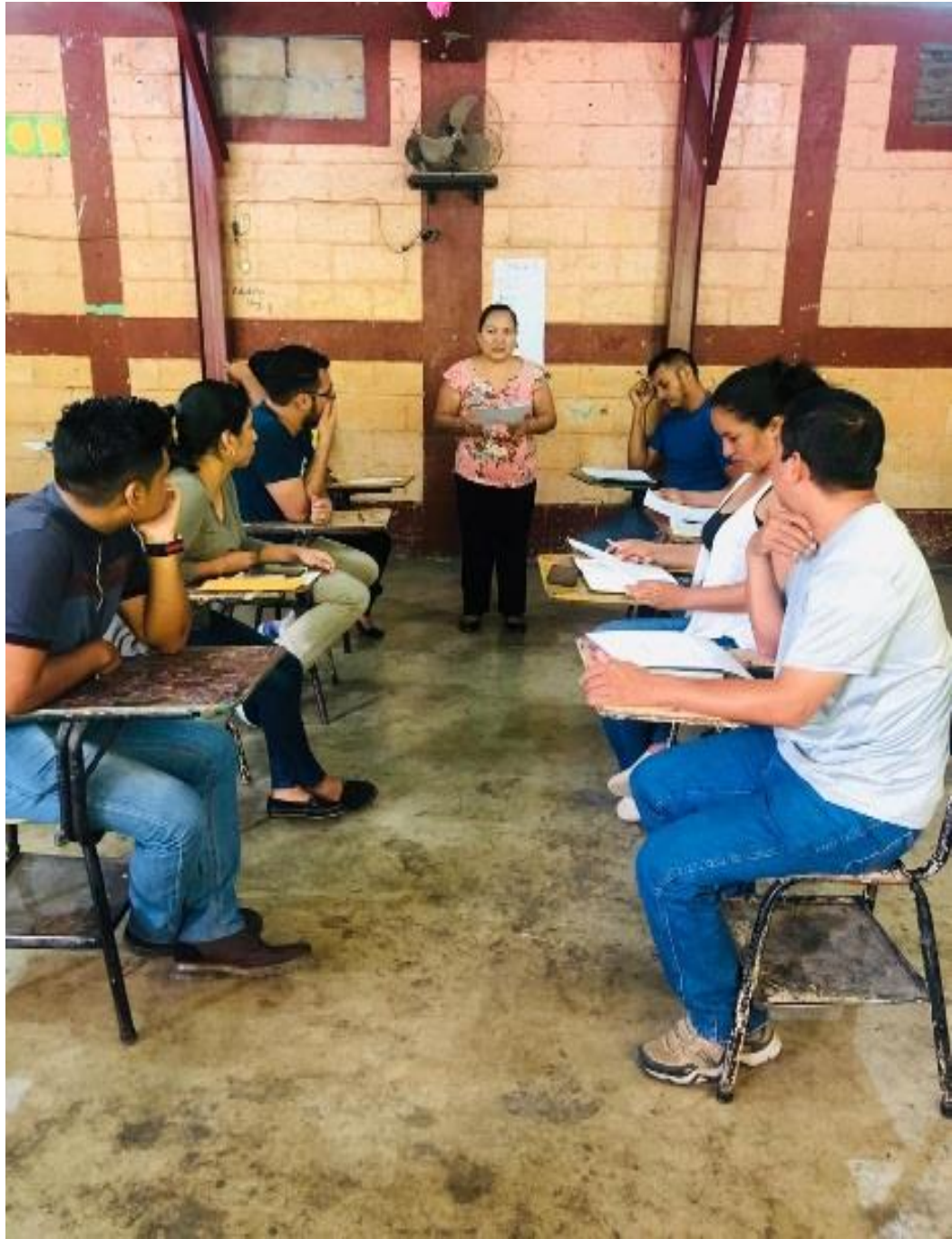
Ilustración 1 Modelaje del Concurso de lectura.