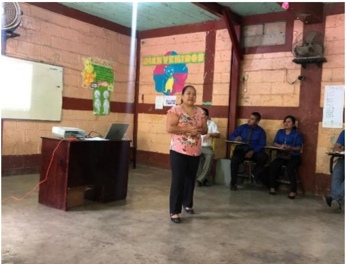
Ilustración 1 Círculo de lectura, sobre estrategias lectoras

Además del conocimiento llevado a la práctica como la aplicación de herramientas y estrategias para mejorar los niveles de comprensión lectora a los docentes. Algo sumamente importante es el éxito está en el Liderazgo para encaminar y ser guía de los docentes.