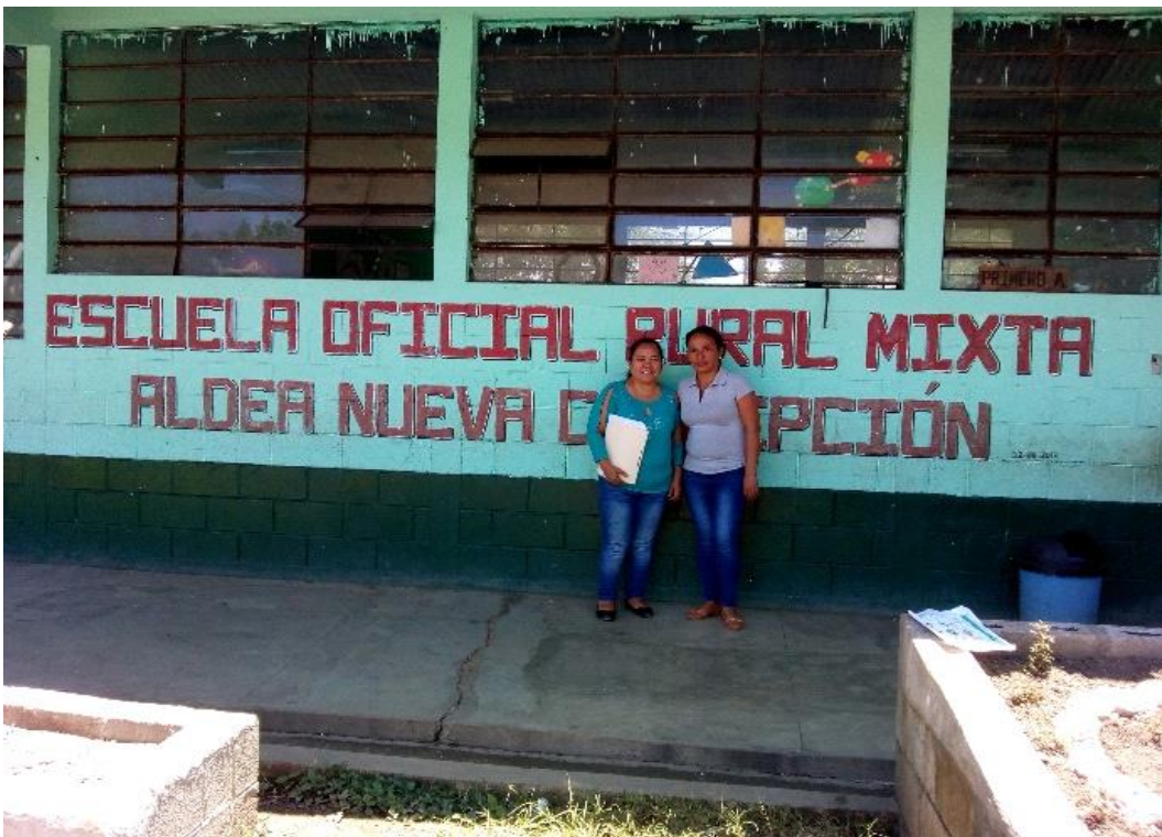
Ilustración 2 Aplicación del COC en la EORM aldea Nueva Concepción.