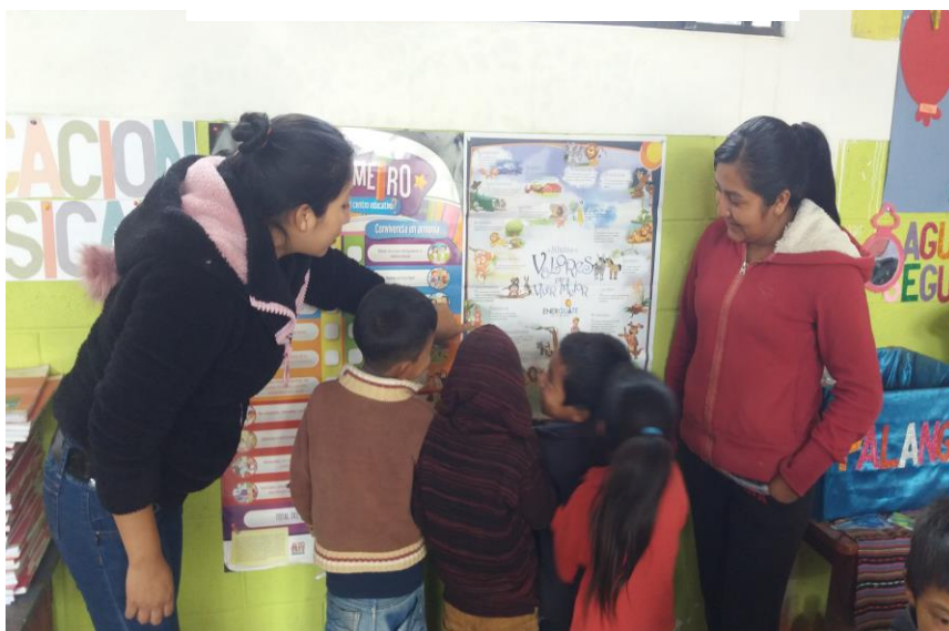
Ilustración 13: acompañamiento en el aula

Brindando acompañamiento educativo en el aula de primer grado de la Escuela Oficial Rural Mixta Cantón Cruz Ché III, Santa Cruz del Quiché, Quiché