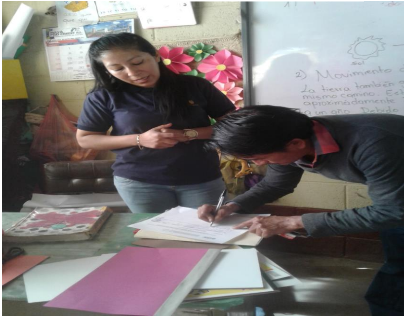
Presentación del plan de acción a director de la Escuela Oficial Rural Mixta Cantón Pacajá II, Santa Cruz del Quiché, Quiché