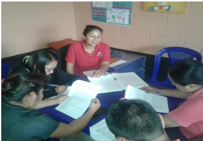
Realización de la investigación acción. EORM. Cantón Cruz Ché III.