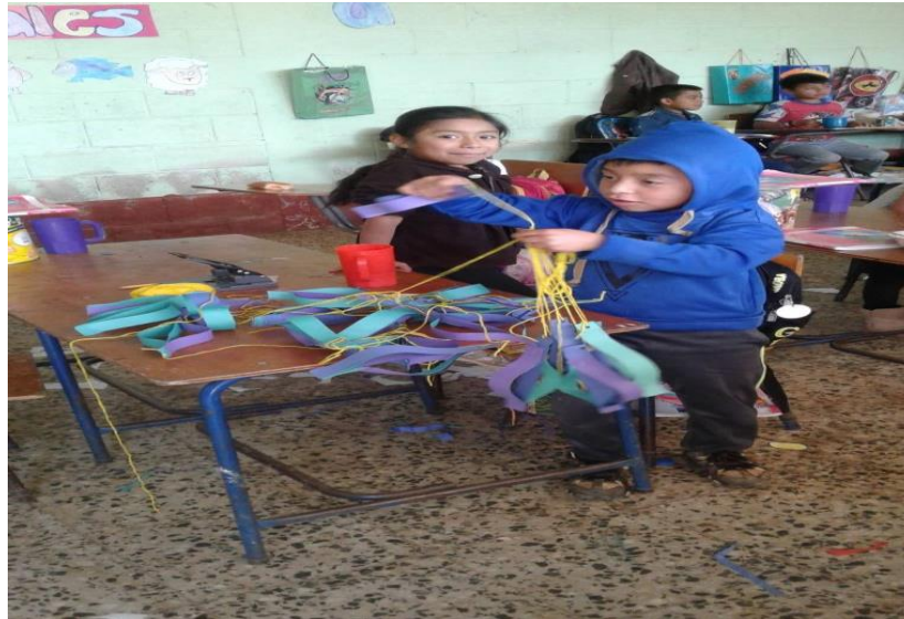
Proceso de acompañamiento a docentes: EORM. Caserío Patzalam