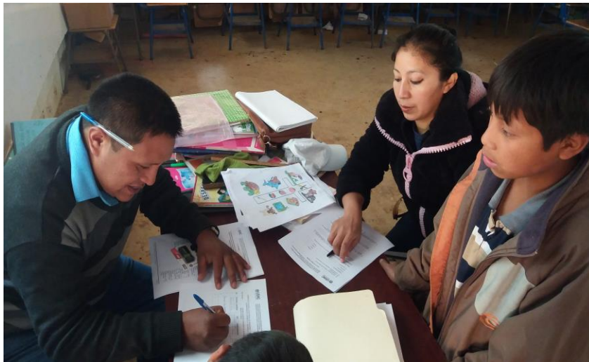
Presentación del plan de acción a director de la Escuela Oficial Rural Mixta Caserío Patzalam, Santa Cruz del Quiché, Quiché.