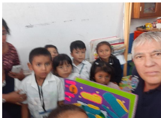
Ilustración 11 Fase de intervención

Los cuatro directores indicaron, que es fundamental el acompañamiento pedagógico en el aula y la asistencia técnica del Sistema Nacional de Acompañamiento Educativo SINAIE, ya que su intervención es esencial para que los maestros mejoren sus prácticas educativas y esa orientación sobre metodología, técnicas, procedimientos y estrategias a utilizar en el proceso educativo que se reciba coadyuvará a mejorar la calidad educativa de sus escuelas.