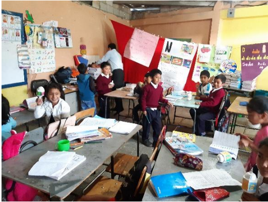
Ilustración 26 Fase de intervención