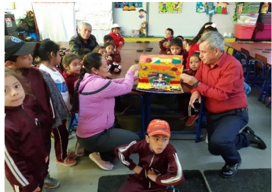
Ilustración 5 Fase intervención EOUM Trigales Quetzaltenango.