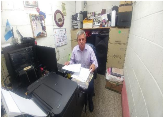
Ilustración 4 Fase diagnóstica EOUM Trigales Quetzaltenango.