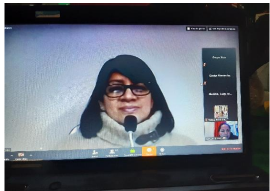
Ilustración 16 Fase de intervención en la práctica profesional.