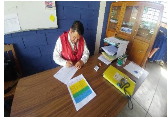
Ilustración 7 Socialización de resultados EOUM Chitux, Quetzaltenango Fuente Molina M. Julio 2019