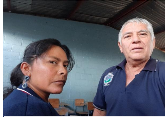
Ilustración 1 Socialización de resultados. EOUM La Estancia Quetzaltenango. Fuente: Molina M. julio 2019