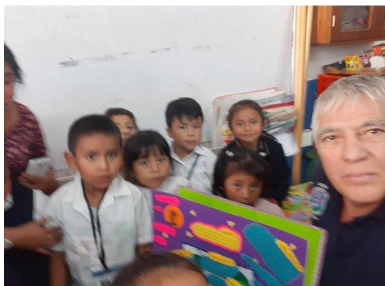
Ilustración 19 Abordaje Práctica profesional

Considero que esta experiencia exitosa puede ser sostenible si se lleva a cabo el plan que diseñé para tal fin y que consiste en dar seguimiento a las estrategias de abordaje, El COC, Plus Delta y Mejora continua, estrategias que fueron aceptadas y del agrado de los directores participantes en el proceso de la práctica profesional de las escuelas asignadas, asimismo, mediante el respaldo del Acuerdo Ministerial 1334-2017 que implementa el SINAE definiéndolo como una “Orientación técnica, multidisciplinaria y permanente que será dada a los directores.