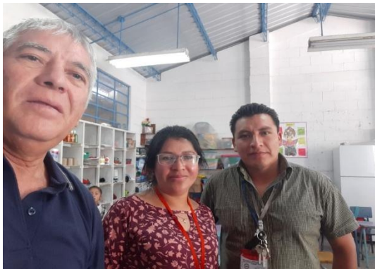
Ilustración 3 Fase de intervención EORM La Colina.