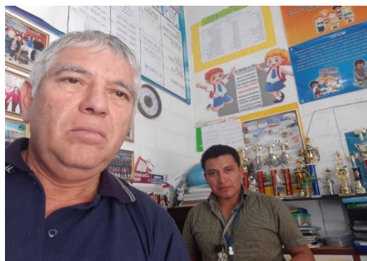
Ilustración 8 Práctica profesional EOUM La Colina Quetzaltenango Fuente: Molina M. julio 2019

La práctica profesional de alguna manera promueve para que los directores de los centros educativos interactúen con los docentes a su cargo a través del acompañamiento pedagógico en el aula.