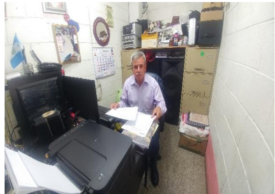
Ilustración 25 Fase de intervención.