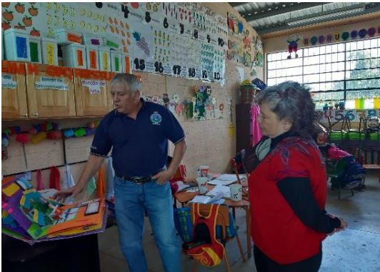
Ilustración 24 Socialización de resultados.