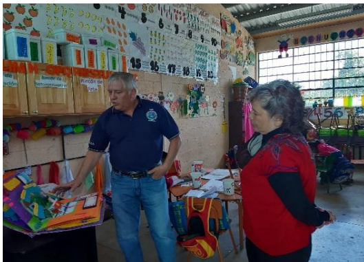
Ilustración 6 EOUM Chitux Quetzaltenango Fase de intervención.