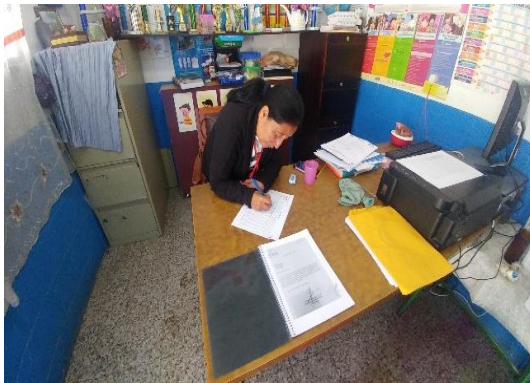
Ilustración 1 Fase diagnóstica EOUM La Colina Quetzaltenango. Fuente Molina M. junio 2019