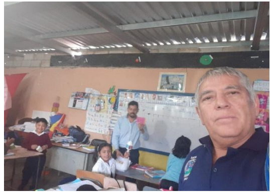
Ilustración 27 fase de intervención Fuente Molina M. julio 2019