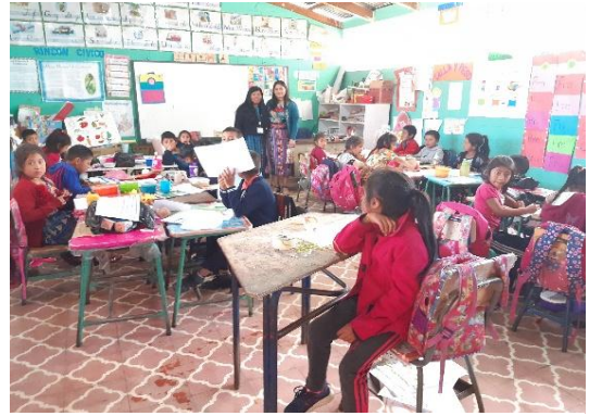
Ilustración 2 Fase de intervención EORM La Estancia.