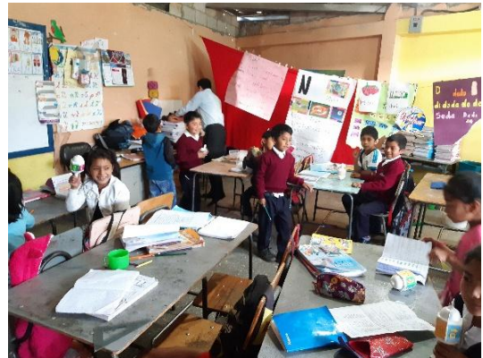
Ilustración 10 Acompañamiento pedagógico en el aula EOUM Chitux, Quetzaltenango, julio 2019

Marroquín (2017) Acompañar al docente nuevo en sus primeros pasos en el desarrollo de su carrera requiere de un proceso organizado y continuo de tutoría durante el tiempo que le toma al docente aprender y dominar su nuevo rol. La presente estrategia de acompañamiento está propuesta para desarrollarse durante los dos primeros años de servicio, desde que el profesor nuevo ingresa al sistema