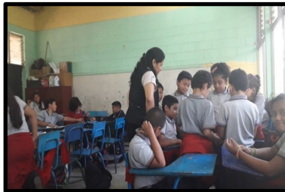
Fotografía No. 5

Observación a docente de cuarto grado, de la Escuela Andrés Gilberto Toc, mediante un instrumento estructurado (pre-test), en el que se tomaron en cuenta 3 variables: actitud docente, estrategias de aprendizaje e interacción docente-alumno y varios indicadores orientados a fortalecer la actitud docente, la equidad de género y la educación en igualdad.