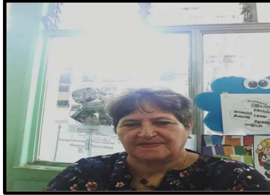
Fotografía No. 11

Fuente: elaboración con datos propios, julio 2019