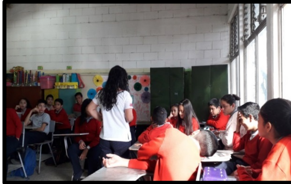
Fotografía No. 4