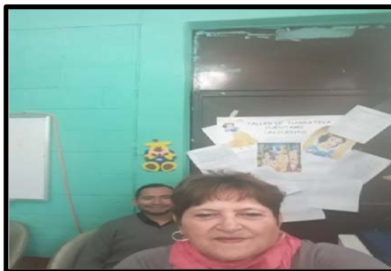
Fotografía No. 9

Como se observa en la parte de atrás de la foto es una exposición de los cuentos creados por los niños y niñas después del desarrollo del Taller de narrativa no sexista, mediante la estrategia Cuéntame un cuento: En el acompañamiento se le sugirió al docente que integrara grupos de trabajo con niñas y niños, cuando el profesor utilizó la canción tomaditos de la mano para que integraran grupos de los dos sexos, los niños estaban renuentes a tomar de la mano a una niña. Para lograr la integración, el profesor les habló sobre la importancia de compartir ideas entre niños y niñas, poco a poco y con la motivación de la canción se fueron integrando, considerándolo como un logro importante.