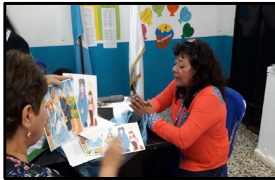
Fotografía No. 2

Observación mediante guía estructurada (pre-test), realizada en la Escuela Nuestra Realidad, en el mes de mayo, en el aula de cuarto grado, observación dirigida a la docente mediante una guía, la que contenía 3 variables y varios indicadores relacionados con la actitud docente, estrategias de aprendizaje y la interacción docente-alumno, orientadas a equidad de género y la educación en igualdad.