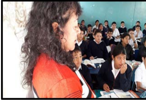
Fotografía No. 1