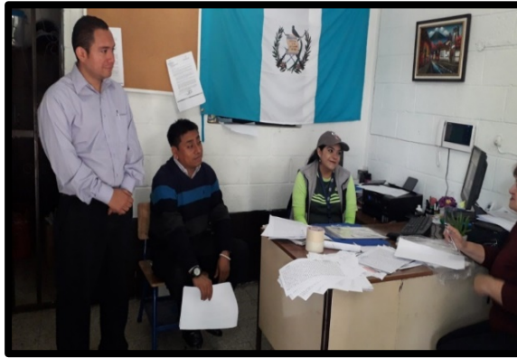
Fotografía No. 3