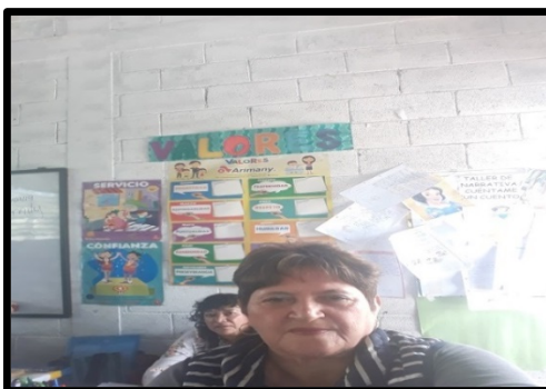
Fotografía No. 7

La experiencia consistió en desarrollar un taller de narrativa no sexista, mediante la estrategia Cuéntame un cuento, en la escuela Nuestra Realidad el día 8 de julio de 2019. Se le brindó acompañamiento a la docente de cuarto grado de la sección A, durante todo el proceso del taller de narrativa. Al principio de la actividad los niños y las niñas estaban separados en grupos, no quería integrarse de forma equitativa, para desarrollar el taller; se orientó a la docente para que aplicara una estrategia de agrupación, sugiriéndole El abrazo musical, la que consiste en poner música de fondo e irle indicando a los niños y niñas, por ejemplo abrazo de dos: se abrazan dos niños (as), luego abrazo musical de tres, hasta llegar al número de niños y niñas que se quieren integrar.