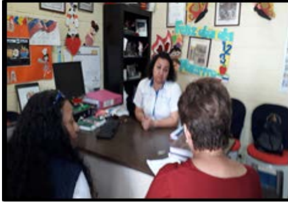
Fotografía No. 6