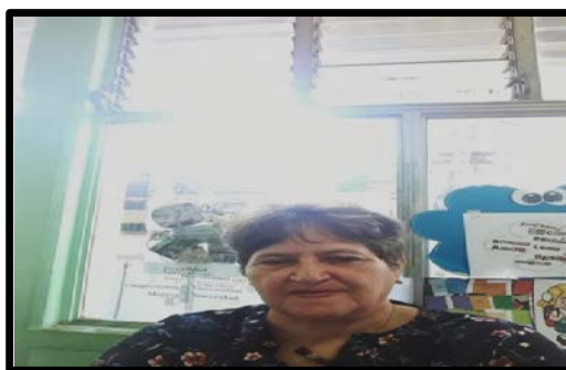
Fotografía No. 10