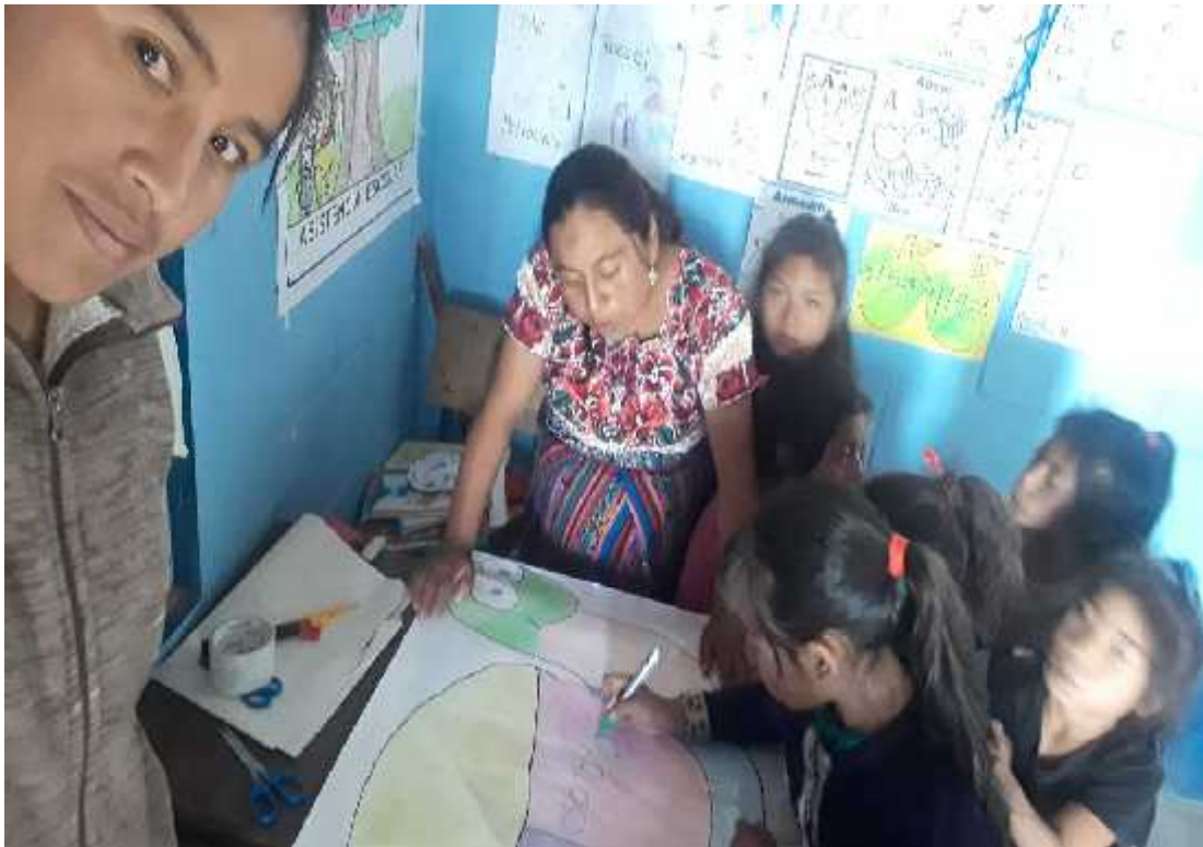
Fotografía No.8 Modelaje experiencia exit. 2 Fecha: julio de 2,019

El mejor apoyo con los que necesitan es la socialización de experiencias y el compartir trabajos con los niños es la mejor alegría que se puede causar en un niño, el niño no va decir que no puede en ese momento, el niño dice le ayudo seño, yo puedo hacer las cosas mejor que usted y eso está comprobado por las personas que trabajan mucho con la niñez.