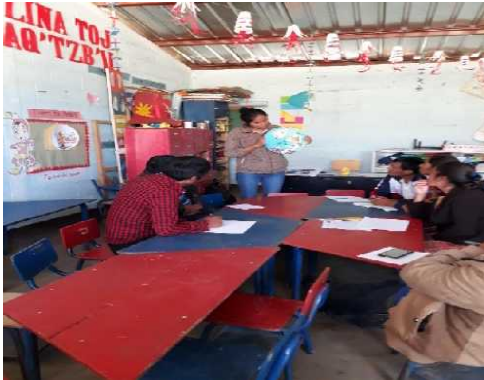
Fotografía No. 6 Resultados IN-1- IN-2 Fecha: 01-08-2,019