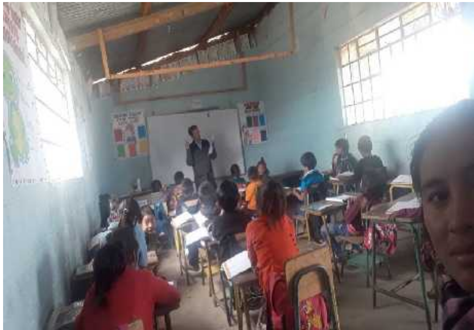
Fotografía No.2 Clase demostrativa IN-2 Fecha: 17-07-2,019