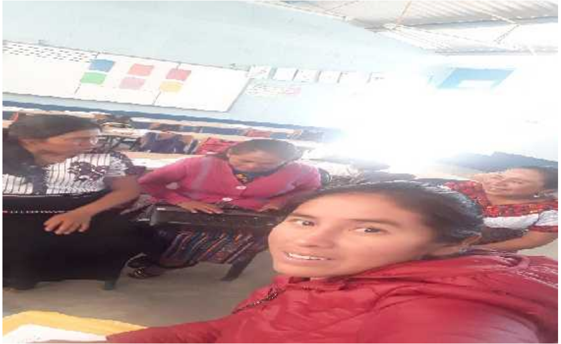
Fotografía No.9 Modelaje experiencia Exit. 3