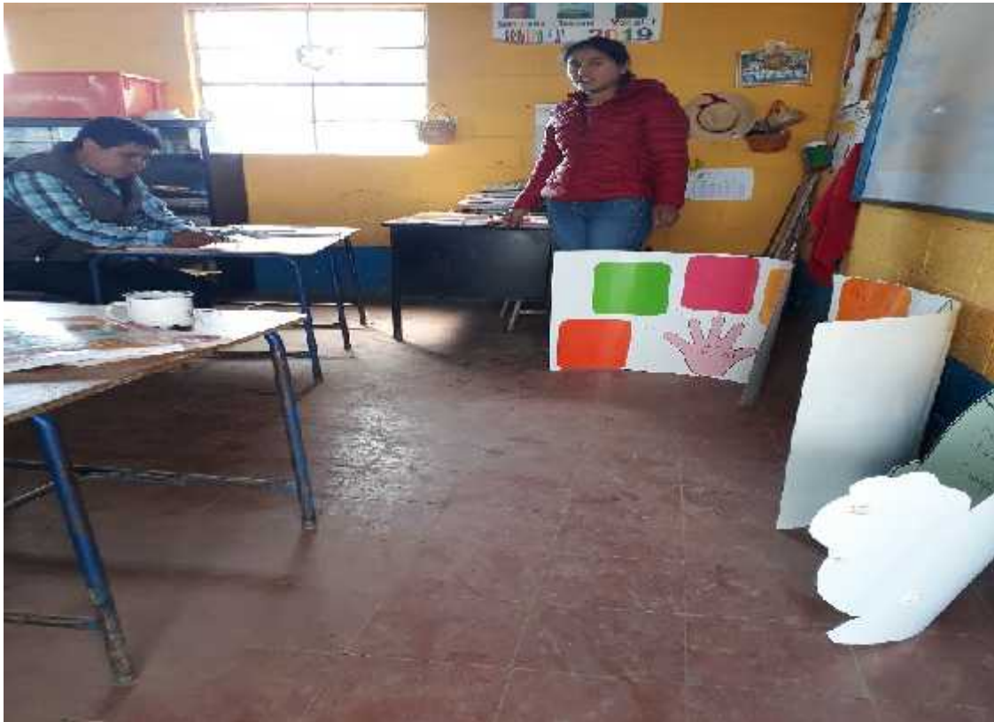
Fotografía No.7 Modelaje experiencia Exitosa 1 Fecha: julio de 2,019

Es importante incluir a los niños que tienen problemas de lectoescritura con los demás haciendo uso de los organizadores gráficos de diferentes formas para no alejarlos y que se sientan cómodos dentro del equipo, tenerle aprecio y cariño es suficiente para él o ella, sólo con eso basta aprender una palabra al día o una letra a la semana, con estas herramientas el docente no llega a improvisar su lectura al contrario él o ella llega muy bien preparado incluso los niños ya saben cómo empieza una lectura en el aula con sus compañeritos y docente. Esta es la experiencia más fuerte que me tocó resolverla y los docentes quedaron muy satisfechos con los materiales que están utilizando.