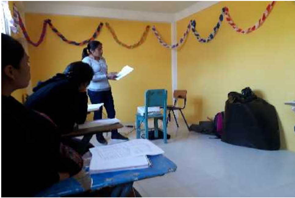
Fotografía No.1 AP Socialización de IN-1 e IN-2 Fecha: 04-07-2,019