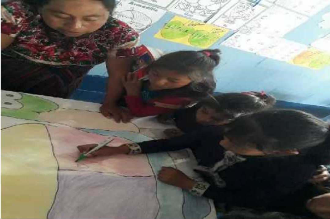
Fotografía No.3 Modelaje IN-2 Fecha: 17-07-2,019