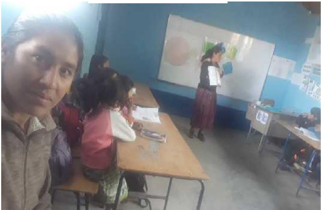
Fotografía No.4 COC IN-1 Fecha: 23-07-2,019