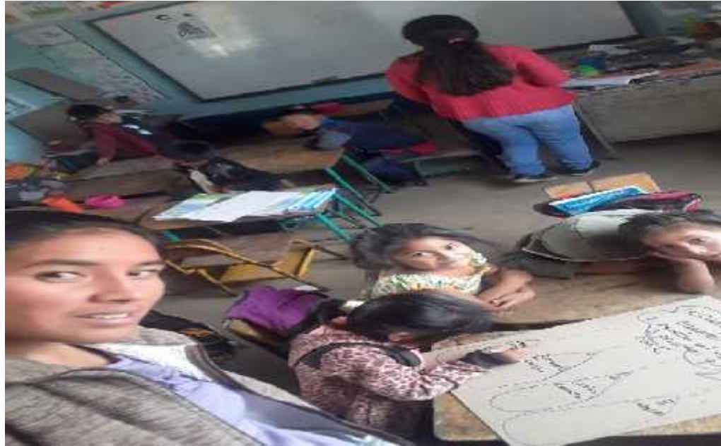
Fotografía No.5 COC Modelaje IN-2 Fecha: 25-07-2,019