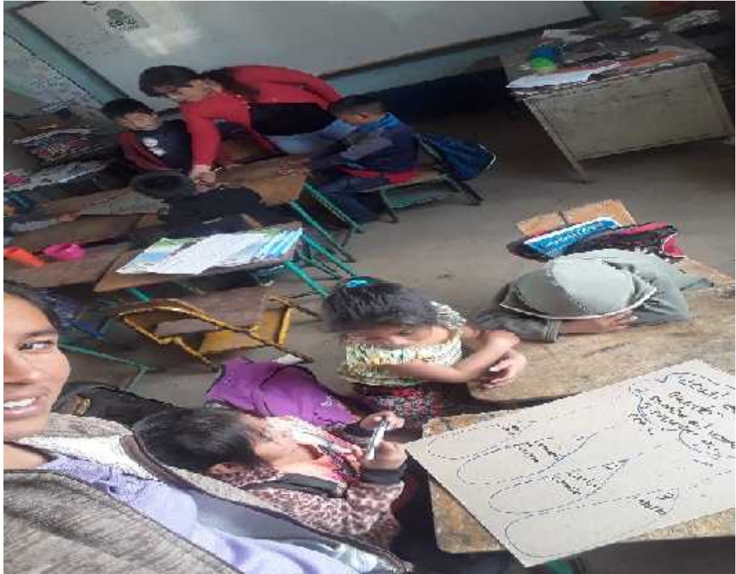
Fotografía No.10 Modelaje experiencia exitosa. 4 Fecha: julio de 2,019

lectora en el aula que contribuye siempre en el proceso del diario vivir de cada docente y estudiantes. Las mismas son evaluadas a través de diferentes instrumentos de observación como escala de rango, para el mejoramiento en el transcurso de la labor docente.