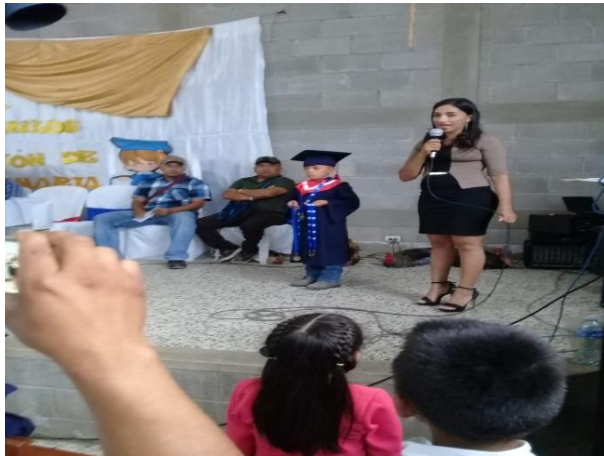
Presentación del Proyecto de Mejoramiento Educativo