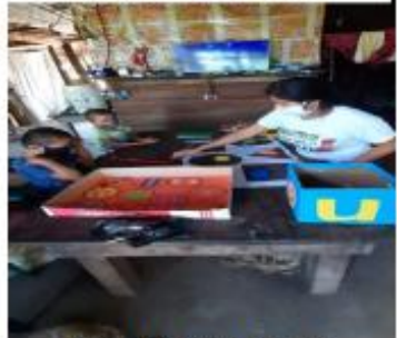
Fotografía 6 Monitoreo de trabajos

En esta fase se verificaron los indicadores de resultados y los indicadores de impacto realizando una evaluación por medio de una lista de cotejo describiendo todas las actividades y el proceso del proyecto, para verificar si se cumplieron los objetivos dando resultados positivos y que a través de la implementación de las estrategias y metodologías utilizadas los niños lograron un aprendizaje significativo pudiéndose observar verificar y evaluar en la aplicación que ellos realizaron a través de los trazos correctos la pronunciación y la identificación asociando el número y numeral tomando en cuenta el