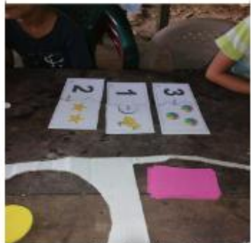
Fotografía 8 armando rompecabezas