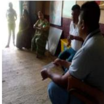
Fotografía 9 Dando a conocer el Cierre del Proyecto

De los involucrados guiándose del cronograma para realizar las actividades en el tiempo estipulado de una manera factible se agradeció por el apoyo que brindaron y su participación felicitándolos ya cada uno asumió su responsabilidad, con satisfacción y compromiso, no importando que tan