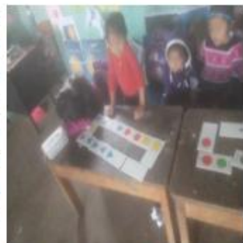
Fotografía 4 Clasificación de Forma y Color