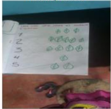
Fotografía 7 Identificando el Numero y Numeral