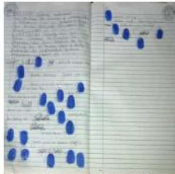
Fotografía 10 Firma de Acta por la culminación del proyecto