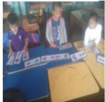
Fotografía 3 juego de Domino

En esta fase se realizaron las actividades a través de los objetivos generales y específicos que se describieron para la elaboración de este proyecto de las actividades que se realizaron fueron investigadas y fundamentadas entre ellas tenemos la seriación, clasificación para que los niños iniciaran a desarrollar su pensamiento lógico también se realizaron actividades de memoria, visual domino , la elaboración de plastilina fue una actividad muy emocionante para los niños ya que se divertieron y a la vez.