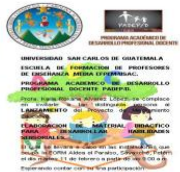
Foto 4 Tarjeta de Invitación

En este apartado fue necesario realizar un listado de materiales que serán utilizados para la elaboración de material didáctico que se elaboró con el fin primordial de mejorar los procesos educativos en el desarrollo de habilidades sensoriales en los alumnos del establecimiento, para la elaboración de material