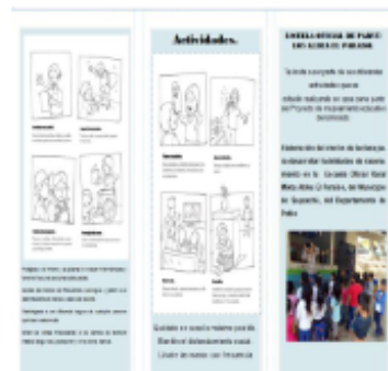
Foto 5 Trifoliar entregado padres de familia

participación activa de los padres de familia y estudiantes como se puede observar en las