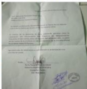
Foto 1 Nota de permiso al director

realizar la convocatoria a padres de familia para la reunión que se planifico con la finalidad de dar información de la realización del Proyecto de Mejoramiento educativo en el establecimiento, y el lanzamiento que se realizara para dar una demostración de los materiales y la planificación de todo el proyecto esto para que los involucrados puedan tener más información acerca de lo que se realizara en beneficio de los niños y niñas del establecimiento, para que cuando se solicite el apoyo puedan participar activamente en las actividades que se tomaran en cuenta para