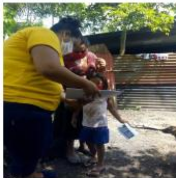
Foto 6 Entrega de folletos a padres de familia

sus padres los cuales se encargaran de hacer de forma narrativa las instrucciones de cada actividad, en la siguiente fotografía se puede observar la entrega del material con las medidas preventivas adecuadas para proteger la salud y bienestar de todos.