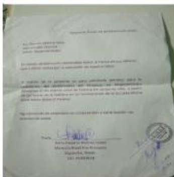
Foto 2 permiso dirigido al Coordinador