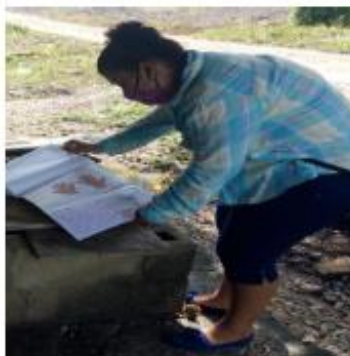
Foto 8 Visitas domiciliarias para realizar el monitoreo y uso correcto de los materiales.

Se realizaron visitas a los padres de familia para verificar el cumplimiento de las actividades en colaboración con padres de familia estudiantes y docentes se observó el material y cada actividad que realizaron en acompañamiento con padres de familia así mismo se realizó preguntas a los niños de lo aprendido lo cual pues trae consigo mucha satisfacción puesto que con estas nuevas estrategias se consiguió que los estudiantes obtuvieran conocimientos nuevos a los que traían en su estructura cognitiva y con ello se logró un aprendizaje significativo para los niños y niñas del establecimiento educativo.