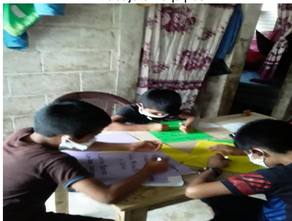
Estudiantes practican reglas ortográficas, en el seno del hogar