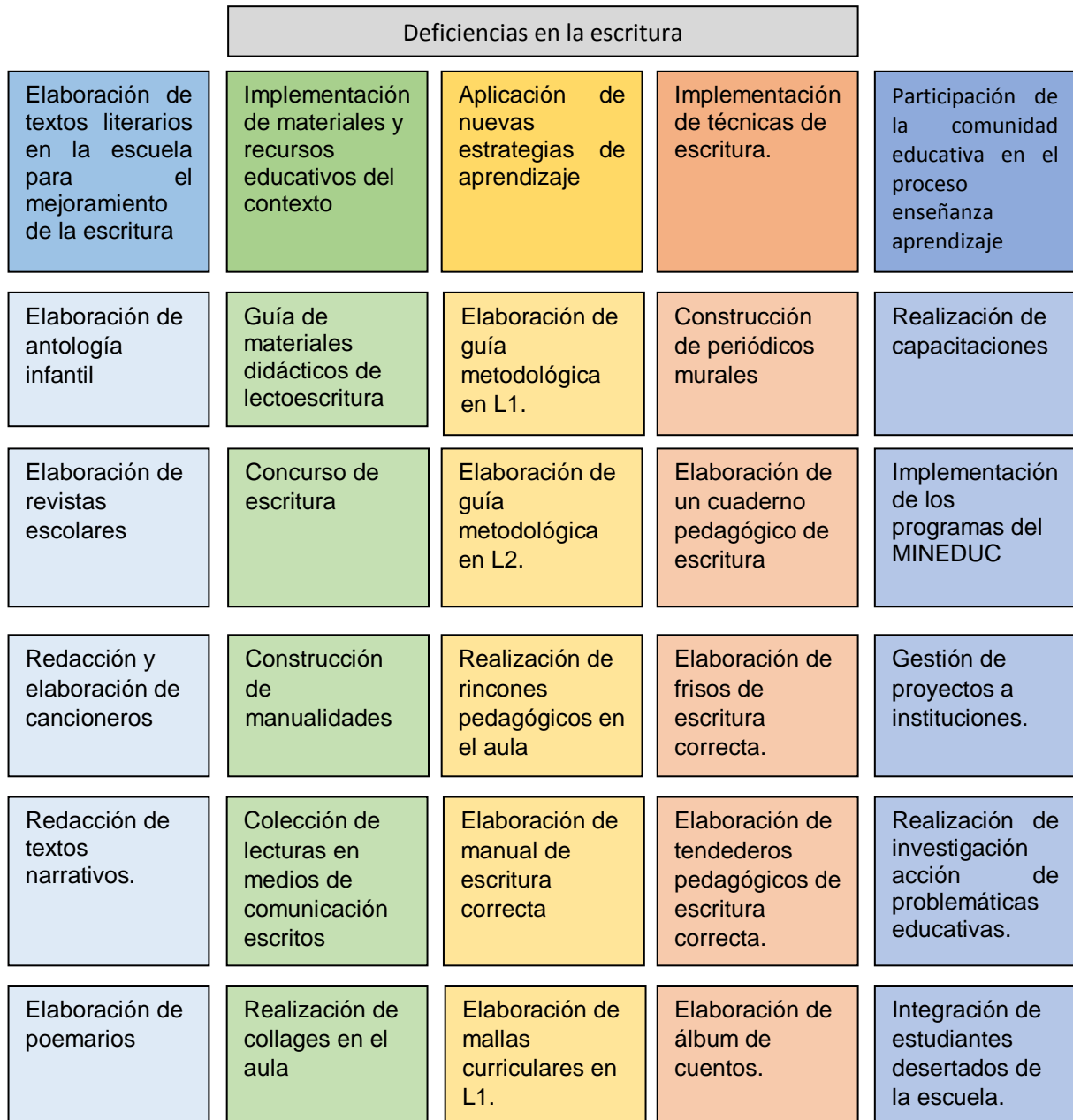
Mapa de solución