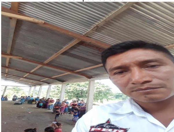
Reunión con padres de familia

Fuente: fotografía tomada por profesor José Cornelio Tzib Caz reunión con padres de familia en donde se socializa las actividades del Proyecto de Mejoramiento Educativo