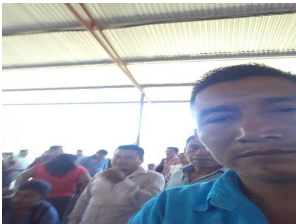
Promoción del plan de PME

Socialización del Plan del Proyecto educativo con el personal docente de la escuela.