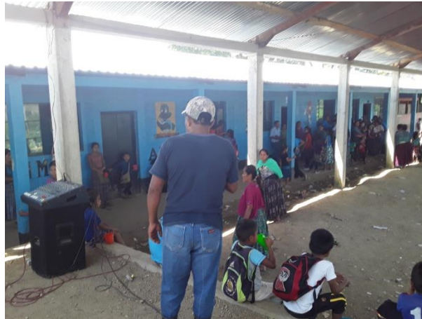
Convocatoria a reunión