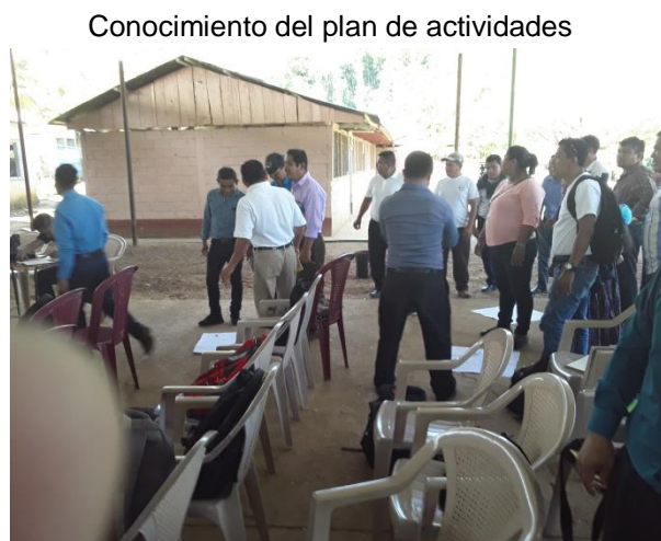
Imagen No. 3

Como resultado del trabajo realizado en la Presentación de plan del Proyecto de Mejoramiento Educativo, se dio al conocimiento de los integrantes de la Organización de Padres de Familia OPF y Padres de familia en general de la Comunidad San Pedro Limón, sobre el comienzo a través de dicho cronograma de actividades un Proyecto de Mejoramiento Educativo con estudiantes de cuarto Grado del Nivel Primario, con el fin de minimizar las deficiencias en la escritura de los estudiantes. Los presentes son actores principales para lograr la calidad en el aprendizaje de los estudiantes en mención.