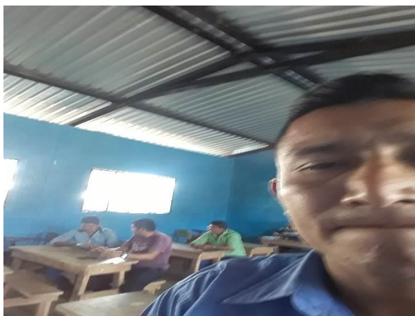
Entrega de cronograma de actividades