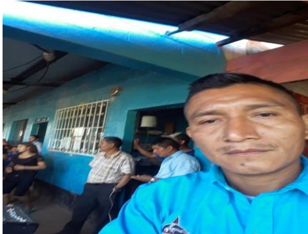
Asamblea de padres de familia