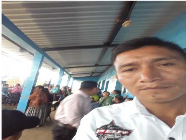
Taller con padres de familia