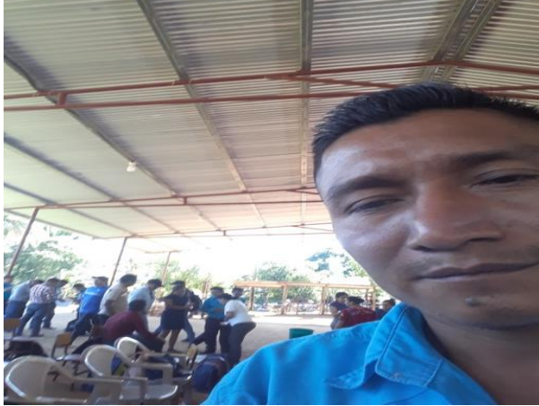
Organización de conformación de talleres