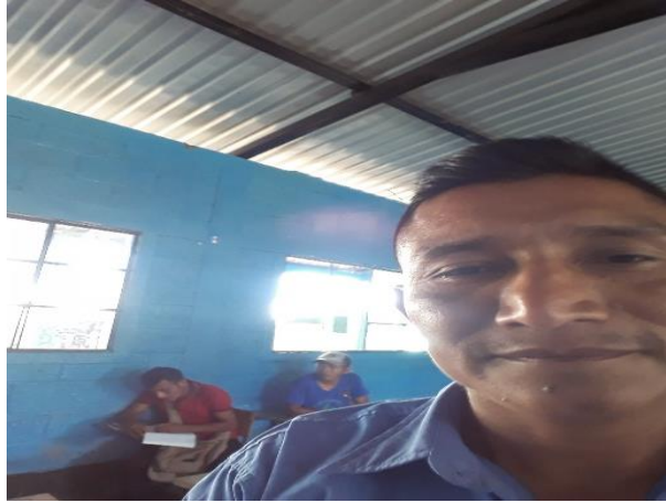
Reunión con la OPF y docentes