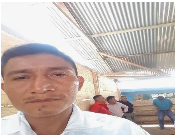
Director del EORM San Pedro Limón