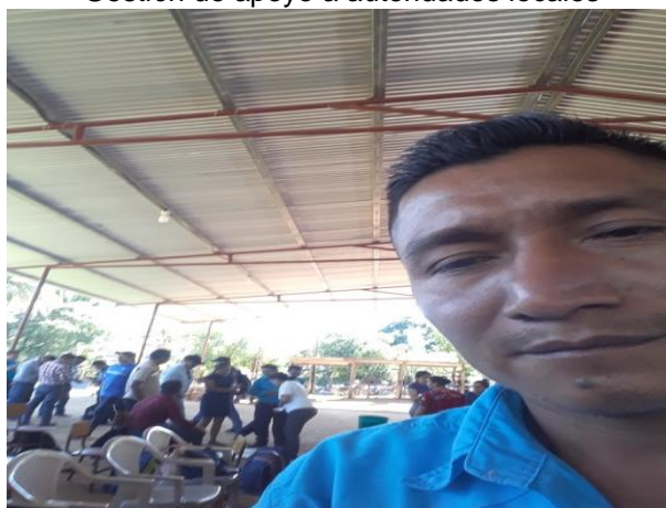
Gestión de apoyo a autoridades locales