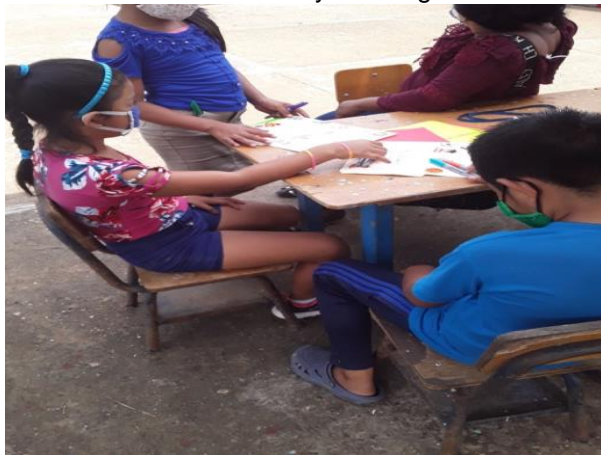
Conocimiento de técnicas y estrategias de escritura