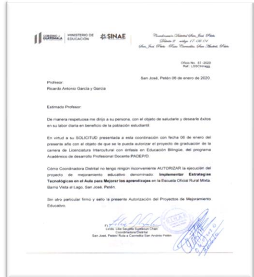
Fotografía No.1. Autorización de permiso

Se socializó el Proyecto de Mejoramiento Educativo Ejecutar estrategias en el aula realizando desarrollo en competencias lectoras, escuela Oficial Rural Mixta, Vista al Lago ,San José Petén es mediante una reunión en las aulas de la escuela, el día 3 de enero de 2020, se les comunicó los indicadores bajos que afectan el