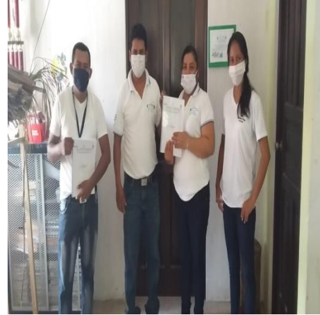
Ilustración 10. Entrega de la guía a la coordinadora distrital

Descripción: Entrega de la guía de ejecución de la divulgación del PME