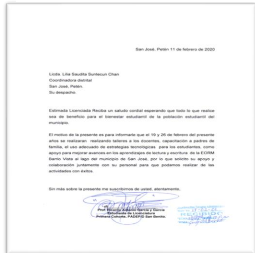
Fotografía No. 3. Solicitud de Invitación

Descripción: Invitación para las autoridades educativas para el acompañamiento en el desarrollo de los talleres