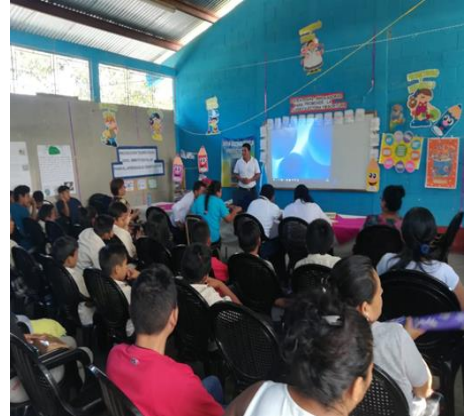
Fotografía No. 2 Socialización del proyecto

Descripción: Socialización del PME ante los padres de familias directora, docentes, autoridades educativas y la asesora del proyecto