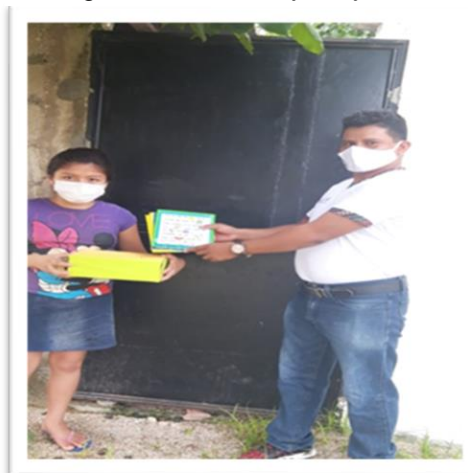
Fotografía No. 9. la caja viajera.

Descripción: entrega de actividades, y la caja viajera como herramienta de aprendizaje.