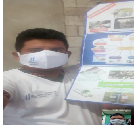
Fotografía No. 4. Compartiendo estrategias

Descripción: compartiendo estrategias de lectura de video llamada en la red social WhatsApp