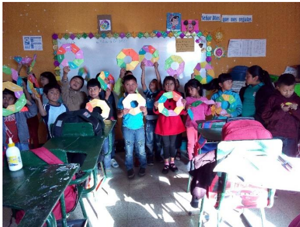
Imagen No. 5 Ejercicios de lectura

Se realizó ejercicios individuales de palabras con figuras relacionando con figuras y patrones.