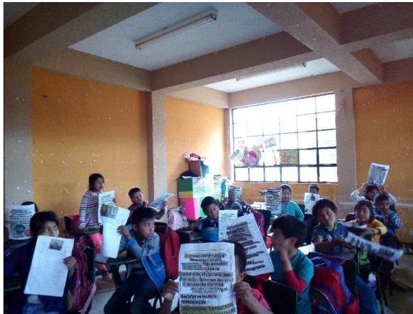
Imagen No. 1 Actividad en el aula