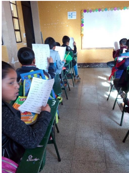
Imagen No. 3 Entrega de trabajos

Participación de los estudiantes en el salón de clases para la celebración del día del cariño, realizando juegos a través de la participación que es una parte componente de la práctica en el desarrollo de la expresión verbal a través de juegos recreativos.