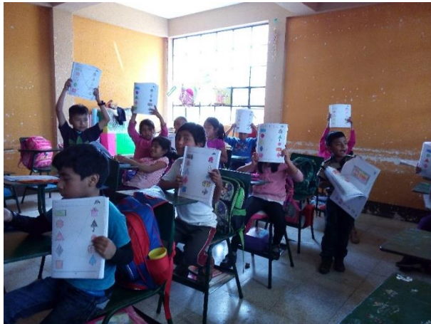
Imagen No. 4 Ejercicios realizados