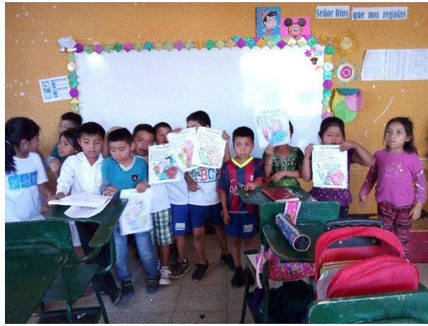
Imagen No. 8 Participación

Desarrollo de la expresión oral, a través de poemas.