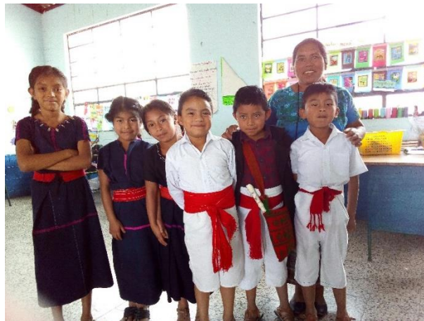
Imagen No. 7 Organización de actividades

Identificación de palabras compuestas a través de colores según lo que piden las instrucciones.