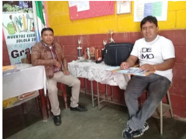
Imagen No. 5 Reunión con el Director

Para este proceso se sostuvieron reuniones con el director del establecimiento quien es el encargo y responsable del centro educativo de cualquier acontecimiento que suceda dentro y no es la excepción en este caso para poder presentarle el plan y la propuesta de trabajo para implementar el Proyecto de Mejoramiento Educativo