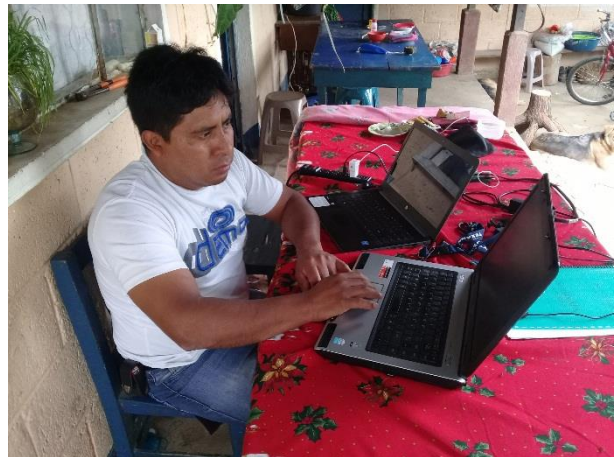
Imagen No. 2 Diseñando Objetivos para el PME

DISEÑO: En esta fase se define el concepto de proyecto además se establecen los objetivos del proyecto, por otro lado, se elabora la justificación que especifica las razones del porque se realizó este proyecto además se analizó la información que se debieron realizar como posibles actividades y enlistar las posibles tareas a realizar para contar con una planificación que ayudó en el proceso a alcanzar los objetivos y también determinar todos los recursos necesarios para cada fase a desarrollar.