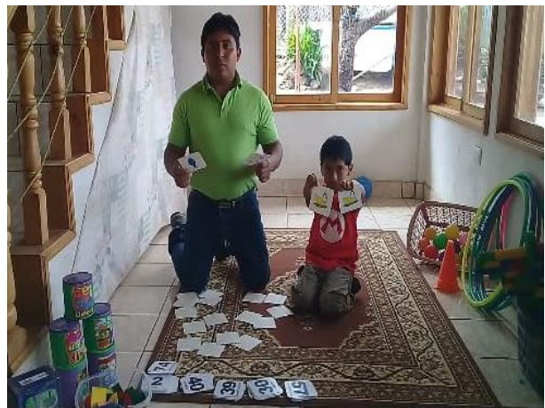
Imagen No. 10 Divulgando el PME

Uno de los resultados que también fue tan valioso es que ahora el centro educativo cuenta con materiales necesarios que puedan utilizar los estudiantes en horas de clases permitiéndoles el desarrollo individual y grupal de cada uno de ellos e implementar el juego como proceso de aprendizaje y permitir una convivencia armónica.