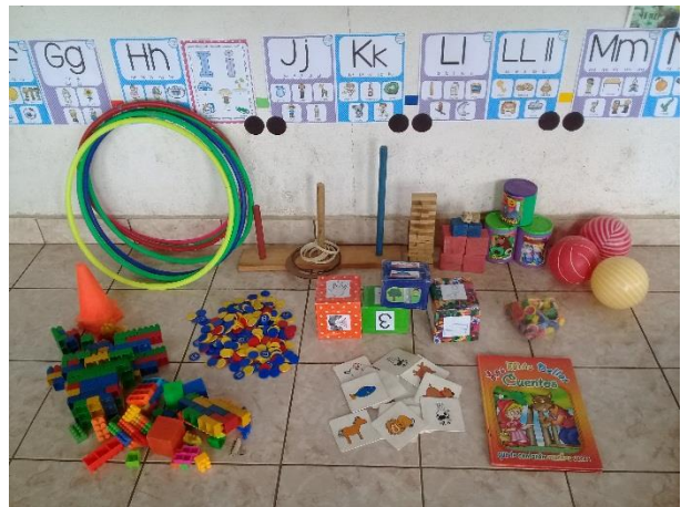
Imagen No. 13 Objetivos de los Recursos

Estimular el desarrollo del lenguaje entre los estudiantes y docente además brinda oportunidades en el desarrollo y aprendizaje en todos los campos de la conducta social, emocional, intelectual, físico y cultural.