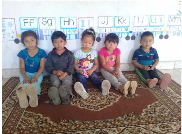
Imagen No. 7 Conversar con los Estudiantes

Entre otras actividades importantes desarrollar en esta fase es la de tener una buena comunicación con los estudiantes para compartir experiencias que se están evidenciando con la metodología de los rincones de aprendizaje y poder preguntarles que les ha parecido, que es lo que no les gusta o pedirles de algunos materiales que les gustaría tener para poder buscarlos siempre y cuando llene los objetivos establecidos en la guía, todo esto se hace con el fin de mejorar el proceso de aprendizaje de los estudiantes encaminados a una educación de calidad.