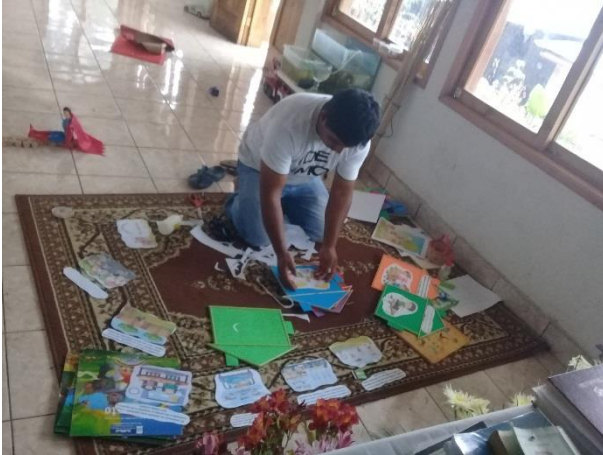
Imagen No. 11 Elaborando Materiales Didácticos