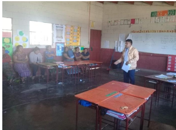
Imagen No. 6 Reunión con Madres de Familia

También se sostuvieron reuniones con madres de familia quienes son actores indirectos pero que son fundamental para poder desarrollar el proyecto porque durante el proceso colaboraron en aportar materiales que estaban en su alcance donar y sobre todo fueron consientes a que el juego es fundamental en el proceso de aprendizaje.