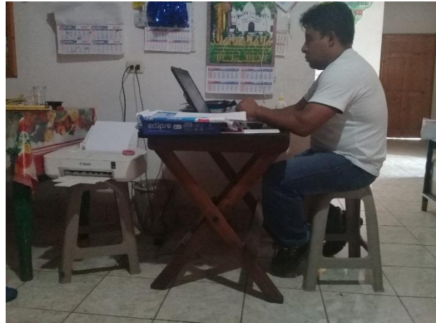
Imagen No. 1 Diseñando el Proceso del PME

Después de haber realizado el proceso de estudio para obtener otro nivel académico se inició con el diseño del Proyecto de Mejoramiento Educativo con el fin de mejorar el proceso de enseñanza aprendizaje de los estudiantes, entre estos aspectos se describieron algunos aspectos sumamente importantes: