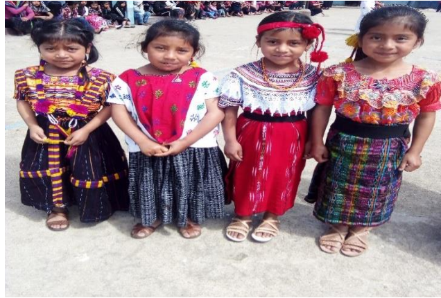
Imagen No. 16 Niñas después de la presentación del baile folclórico

respectivo de los bailes o de la música que les correspondió, dicha estrategia funcionó porque se les prestaba la atención adecuada, y el resto de los estudiantes disfrutaban ver a cada grupo que bailaban, cuando se hacían las presentaciones de cada grupo llegaban las madres a vestirlos y se quedaban presenciando la presentación. Aquí está la imagen de un grupo después de su presentación.