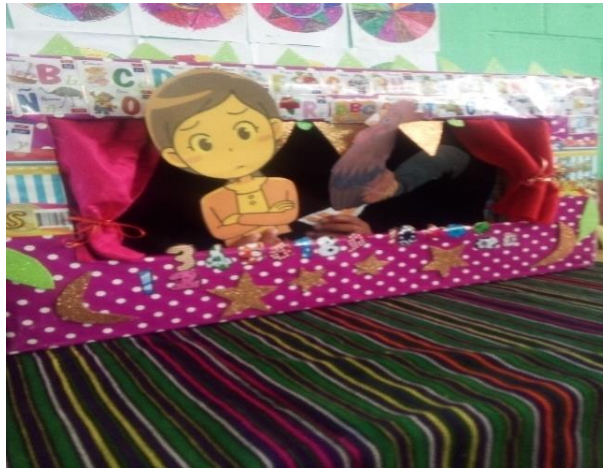
Imagen No. 9 presentación de cuentos a través de títeres

objetivo del proyecto, prueba de ello es que los niños perdieron la timidez y la vergüenza, al mismo tiempo les despertó el interés de concentrarse y prestar atención de lo que sus compañeros presentaban, es una satisfacción haber llegado al final de esta fase fueron resultados aceptables. De esta manera se presentan las evidencias de las actividades realizadas durante el desarrollo de la fase 4.