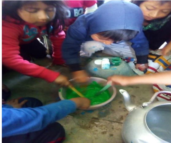
Imagen No. 13 Niños mezclando colores secundarios

pudo lograr el objetivo del proyecto de mejoramiento educativo. A continuación, están las evidencias.