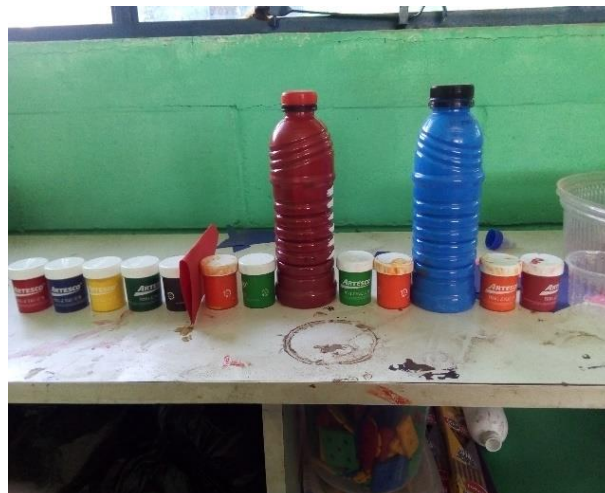
Imagen No.14 colores que se sacaron a través de la mezcla realizada