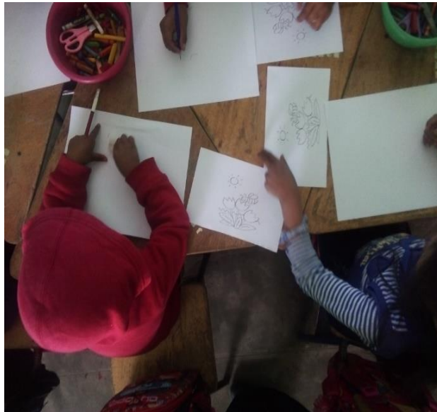
Imagen No. 5 niños dibujando

En efecto de los resultados se evaluó en forma oral, de observación y lluvias de ideas, dese ahí se vio el resultado de esta fase, y prueba de ello, se puede observar las evidencias de los trabajos realizados.