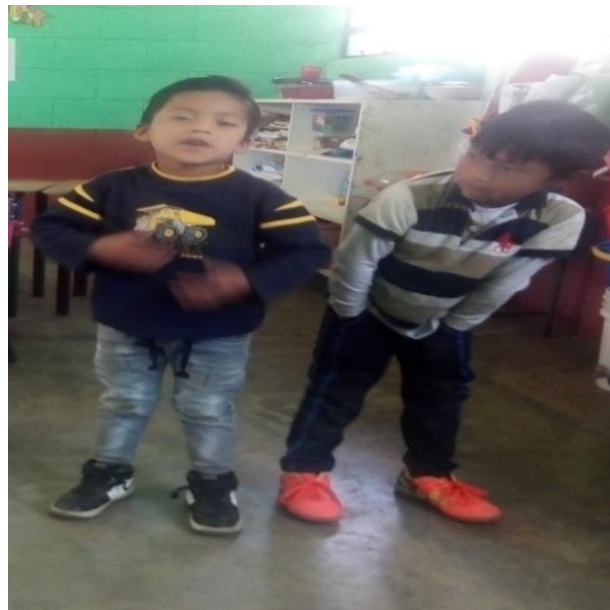
Imagen No. 4 niños declamando utilizando ademanes