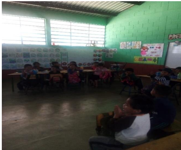
Imagen No. 10 niños presenciando la presentación de cuentos