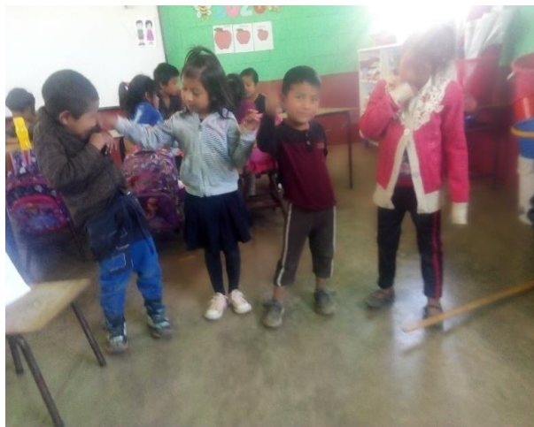
Imagen No. 15 Niños ensayando baile infantil

Al respecto de esta fase de baile infantil, tuvo una duración de trece horas por seis días cinco días de dos horas diario y un día de tres horas, para ensayar los bailes con los grupos, la estrategia que se utilizó son los grupos de trabajo y los ensayos, el primer grupo con la música infantil, el baile de la fruta, segundo grupo con la taza, y tercer grupo la vocales, durante los ensayos bailaron bien y fue una diversión para ellos y ensayaron con su traje de diario, se había planificado usar el traje adecuado al tipo de baile al final del desarrollo de las cuatro clases de bailes, les gustó bastante que, querían que se pasara bailando toda la jornada. Las evidencias, los niños están por grupos.