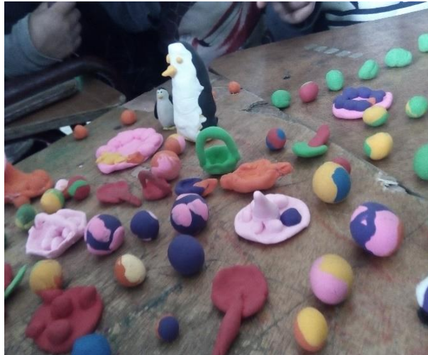
Imagen No. 12 figuras moldeados