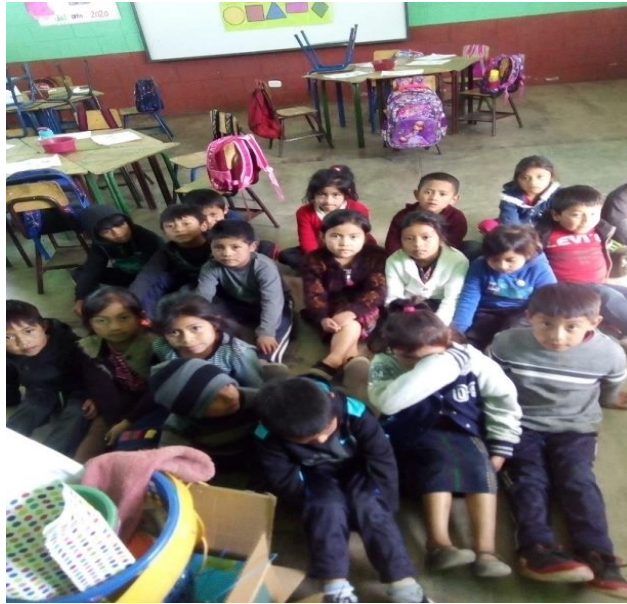
Imagen No. 3 inducción con niños de la fase de poemas