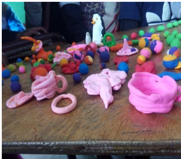
Imagen No. 11 figuras hechas con fomy moldeable

La evaluación fue oral, a través de lluvias de ideas, por lo que se manifestaron que les gustó y que querían seguir con esa actividad, así mismo querían otra caja de material, los resultados fueron satisfactorios, porque todos trabajaron a su creatividad en dar formas a diferentes figuras. Por consiguiente, vienen las evidencias de esta fase número cinco.