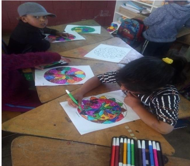
Imagen No. 8 niños pintando mándalas y círculo cromático