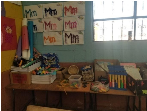
Imagen No. 11 hojas de trabajo de los estudiantes