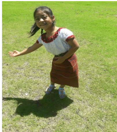
Imagen No. 7 declamado al aire libre