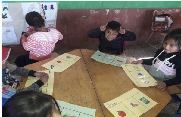
Imagen No. 10 identificando las vocales