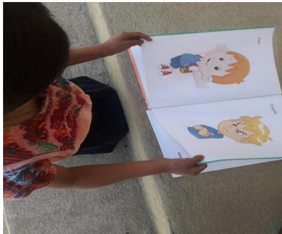
Imagen No.4 imitación de los estados de ánimo.