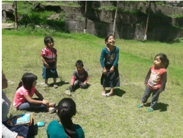
Imagen No. 9 narración de chistes