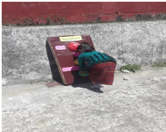
Imagen No. 5 colocando las luces en donde corresponde