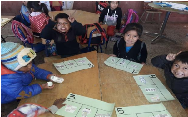
Imagen No. 2 relacionar números con la cantidad correspondiente.

Se procedió a utilizar semillas colocando donde se encuentra el número y el numeral se rotaron las láminas así que todos tuvieron la oportunidad de reconocer los números y numerales como símbolos y esquemas.