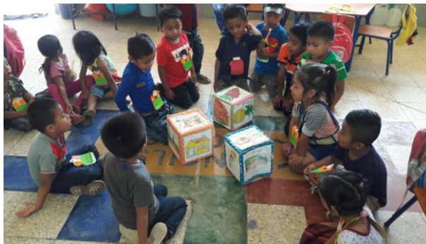
Imagen No. 1 nombrando imágenes que contiene los dados