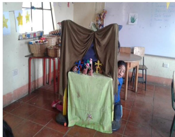
Imagen No. 6 creando su propio cuento