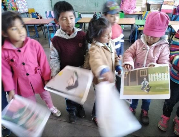
Imagen No. 7 Formando oraciones a través de imágenes