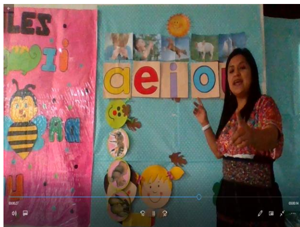
Imagen No. 3 Video sobre el desarrollo de la expresion oral a traves de la cinco vocales

Para el desarrollo de la fase de: Aprendiendo las vocales de manera divertida, describiendo, identificando características de cada estructura de las cinco vocales; para enriquecer la expresión oral. Se envió por medio de un grupo de whatsApp.