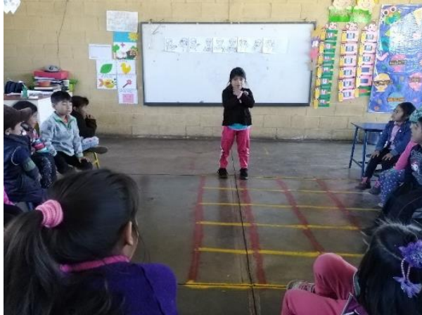
Imagen No. 9 Presentación de mensajes con señas de forma individual

esa forma hasta que se lograr. Los aplausos de los niños motivo la participación de cada uno. Para desarrollar en el niño expresar sus emociones o alguna situación sin realizar sonido. Evaluación a través de la presentación de una pantomima.