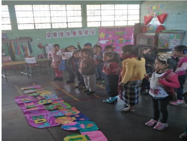
Imagen No. 4 Los niños describiendo el cartel