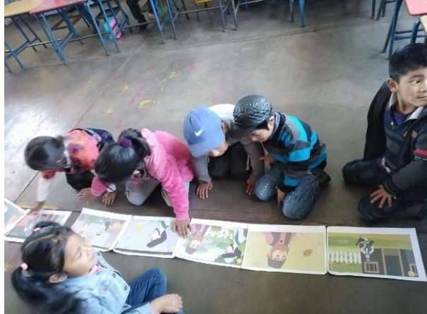
Imagen No. 6 Ordenando las escenas del cuento el pato con huevos de oro

no presente ninguno. Ante esto demostraron entusiasmo en la participación y se logró el objetivo.