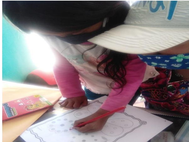
Imagen No. 2 Narración de cuentos infantiles domiciliarias

Narración de cuento infantil: Se les leyó cuentos infantiles, después se les dieron hojas de trabajo para pintar ilustraciones de los cuentos.