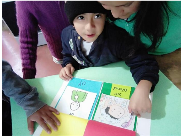
Imagen No. 10 Practicando la lectura emergente a través de imágenes de un cuadernillo

Durante la fase se trabajó la elaboración de un cuadernillo que al final se entregó. Fue evaluada a través de una lista de cotejo. Generó el gusto y el grado por aprender.