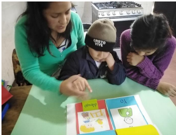
Imagen No. 1 Cuadernillo

Ademas de la divulgacion del PME, para darle seguimiento a las actividades diseñadas por fases, se realizo visitas domiciliarias para portalecer la lectura emergente a traves del uso de cuadernillo, que a traves de la vinvulacion de imagees se formaron oraciones.