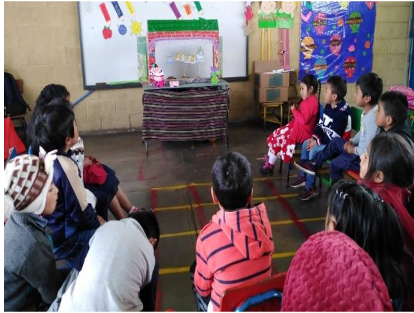
Imagen No. 5 Presentación del cuento del patito feo en teatrín

atención y la comprensión oral, también se logró reforzar el desarrollo de del lenguaje oral y la estimulación de la imaginación, la creatividad durante el desarrollo de la dramatización al actuar de acuerdo a las acciones y la manera de transmitir los mensajes con gestos y las voces.