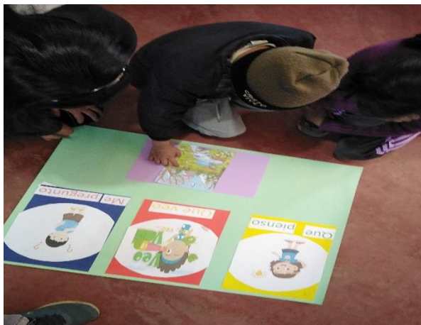
Imagen No. 8 Describiendo la ilustración de acuerdo a preguntas

Otra actividad desarrollada durante el proceso fue la búsqueda de ilustraciones en prensa libre, los niños escogieron la ilustración que les llamo la atención, lo pegaron sobre papel arcoíris, luego ellos mismos pasaron a desarrollar la actividad guiándose de los tres momentos mencionados, se ver la participación fluida de los niños al darle respuesta a las interrogantes. Al culminar esta fase se aplicó la herramienta de evaluación de lista de cotejo.