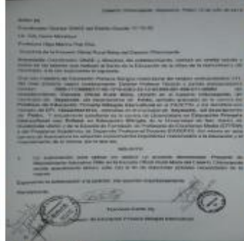
Figura 3 Solicitud o permiso a directo y al SINAIE

En esta fase del Proyecto de Mejoramiento Educativo se llevó a cabo la elaboración de la solicitud de permisos directora de la Escuela Oficial Rural Mixta del Caserío Chicozapote, Sayaxché, Petén; y al SINAIE, firmando las fechas para la solicitó para la ejecución del proyecto de implementación de Rincones de Aprendizajes para Fortalecer la Lectoescritura.