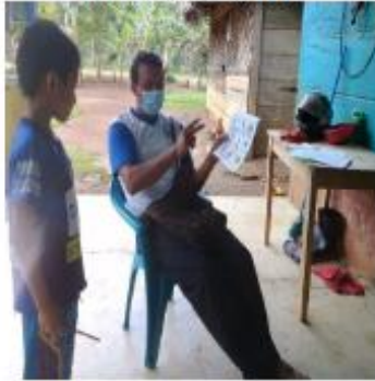
Figura 5 Niño recibiendo atención en casa sobre lectoescritura