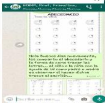
Figura 6 Actividades enviadas vía WhatsApp

La planificación fue cumplirlas a cabalidad, tuvo modificaciones los niños y niñas en acompañamiento pedagógico conforme a los protocolos de salud.