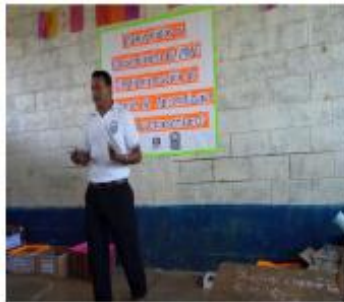
Figura 4 Lanzamiento o socialización del PME

También en esta fase se o presentación sobre la del PME, en dicha estuvieron presentes los indirectos, es decir, los mayoría de docentes del