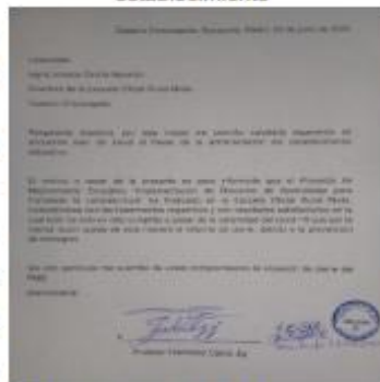
Figura 15 Informe de cierre a la directora del establecimiento

informe en la que la establecimiento enterada de su Proyecto.