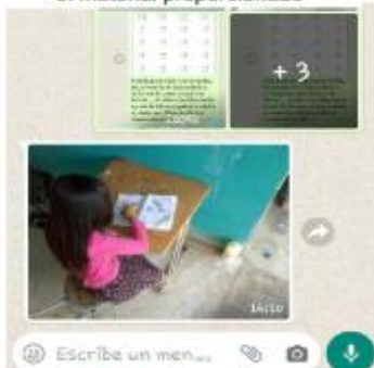
Figura 11 Niña realizando las actividades con el material proporcionado

En esta fase también través de la avances del proyecto significativo en la de rincones de grado que la mayoría logrado concretar en aprendizaje en lo que lectoescritura, ya que han aprendido ya no que en sus casas con