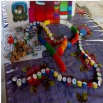
Figura 7 Materiales didácticos del rincón

La ejecución del proyecto ha sido un reto, un desafío que ha dejado grandes experiencias positivas donde se realizaron las actividades y se modificaron, como las dos fases actividades fueron estrategias diferentes debido que surgió la