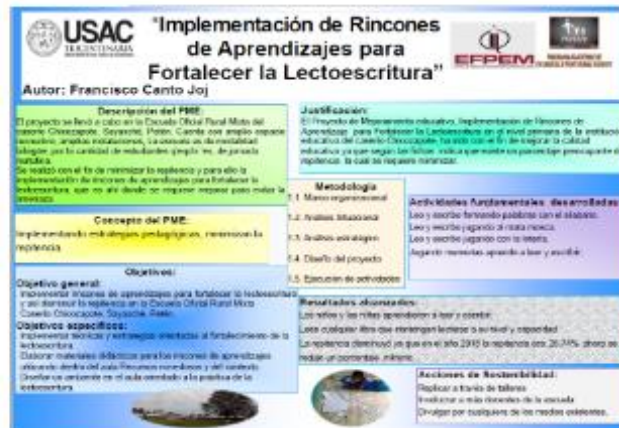
CASERÍO CHICOZAPOTE, SAYAXCHÉ, PETÉN