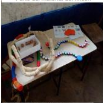
Figura 12 Parte del material del rincón

Asimismo, en el menciona: generar aprendizajes para lectoescritura y así escolar la Escuela