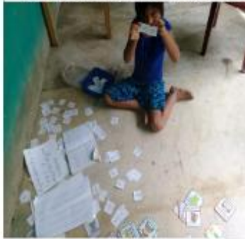
Figura 9 Niña aprendiendo a leer y escribir con el uso del silabario en tarjetas, en casa

En dicha fase hubo padres de familia que el proceso fue aceptado de interactuar vía aunque en esto es todos tienen acceso se visitó a los llevándoles del rincón, como escritura, es decir detuvo el avance de enseñanza aprendizaje de la lectoescritura.