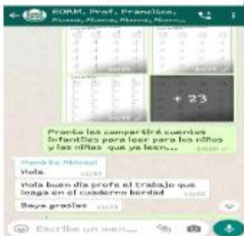
Figura 10 Mensajes por WhatsApp de una madre

En esta fase se llevó a decir supervisar el desde su inicio hasta el lográndose comprobar sufrieron algunos vez el PME siguió su dichos cambios concretar los objetivos la enseñanza con aprendizajes para lectoescritura que repitencia en la escuela de la comunidad.