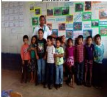
Figura 8 Iniciando ejecución antes de la pandemia

Entre los materiales utilizados en la ejecución del PME fueron los silabarios, loterías con las sílabas, rompecabezas con las sílabas y palabras,