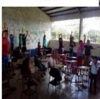
Figura 13 Niños motivados a leer materiales del rincón.

La motivación de los estudiantes en los rincones de aprendizajes se ha logrado. De tal modo que en este monitoreo que se realizó fue con resultados esperados y momentos también se corrigieron.