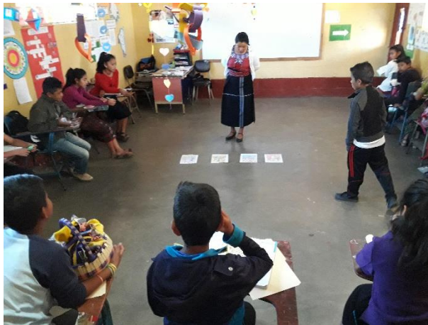
Imagen 10. Actividades de comprensión lectora

En las actividades de aprendizaje que se iban realizando los estudiantes demuestran interés.