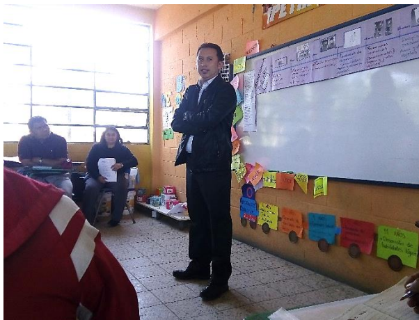
Imagen 14. Acompañamiento del coordinador departamental

El acompañamiento sin duda siempre fue efectivo, porque se resolvían dudas e incluso se agendaban visitas directas en los centros educativos, donde se estaba ejecutando el proyecto.