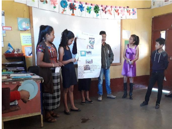
Imagen 16. Presentación de actividades utilizando estrategias de comprensión

Al momento de desarrollar las evaluaciones con los estudiantes, siempre se buscó la forma de hacer de las actividades algo creativo, sin que ellos sintieran esa presión, al contrario, se motivaba a la participación activa, voluntaria, responsable, donde podían demostrar liderazgo y disciplina.