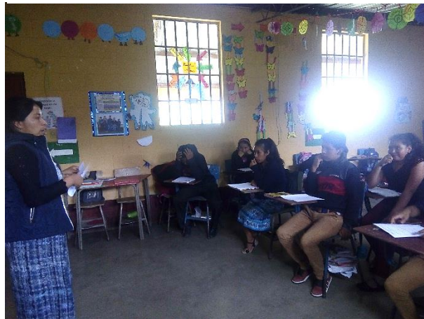
Imagen 2. Análisis de necesidades

Todos los estudiantes encajaron en trabajar necesidades educativas, esto implica que el Proyecto de Mejoramiento Educativo, debe ser estrategias pedagógicas que se estarán implementando en el aula con los estudiantes, esto para que las habilidades y destrezas mejoren día a día.