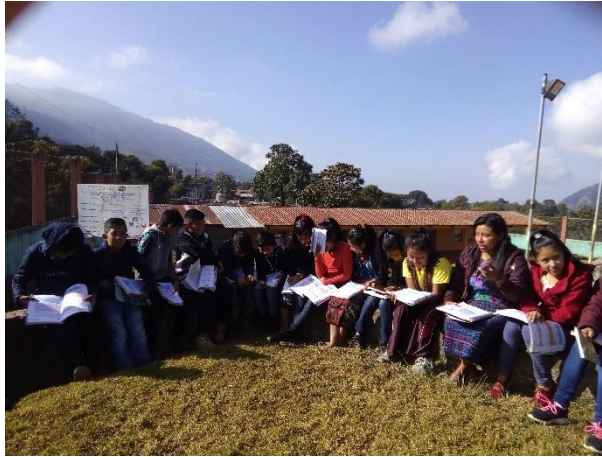
Imagen 12. Tiempo de lectura