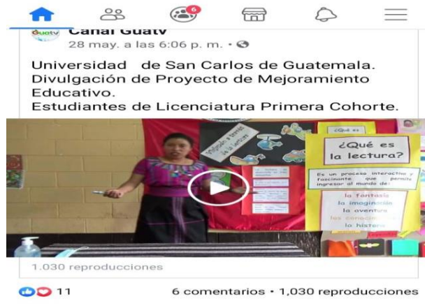
Imagen 18. Divulgación del proyecto