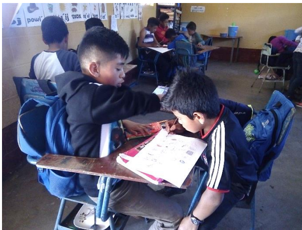
Imagen 11. Trabajo en equipo

Se trabajó la lectura correspondiente y luego se pidió a los estudiantes que colorearan hojas de con ilustraciones, posteriormente se recortó para que todos tengan un juego de tarjetas con imágenes, para jugar se formaron parejas y luego se empezó el juego, al encontrar cada par de tarjetas, si correspondía al tema que se leyó lo colocaban a un lado y si no pertenecía a la lectura lo colocaban al otro extremo, al terminar se hizo un conteo por todas las parejas formadas, esto para ir reforzando el tema de comprensión con los estudiantes, una vez hayan comprendido el tema es más fácil ir recordar si las imágenes fueron mencionadas en la lectura.