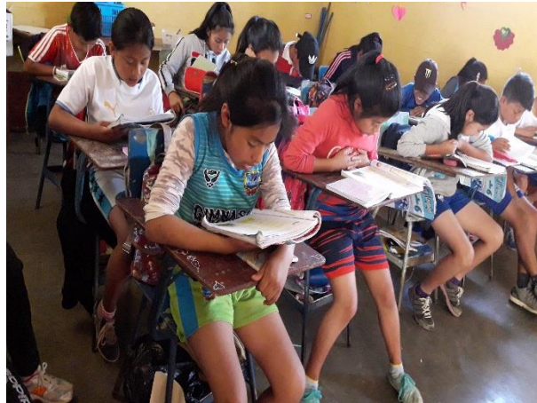
Imagen 8. Estudiantes durante el tiempo de lectura

Como seguimiento al Proyecto de Mejoramiento Educativo, se inició con los diferentes tipos de lectura, en algunas fueron dirigidas, otras se fueron realizando por turnos o compartidas con los estudiantes.