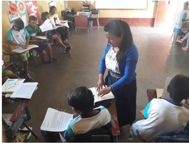
Imagen 7. Actividades con niños