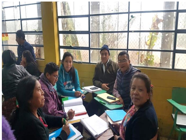
Imagen 1. Asesoría de inicio

El asesor del Proyecto de Mejoramiento Educativo, dio a conocer las fechas calendarizadas de las actividades que serán parte de la ejecución del proyecto. Se programaron reuniones extraordinarias para recibir la asesoría necesaria, los días domingos los estudiantes teníamos reuniones de socialización en la que cada uno analizaba el área donde se realizaría el proyecto, con el grupo de estudiantes y grado a trabajar.