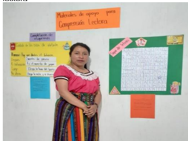
Imagen 9. Aplicando estrategias de comprensión lectora

Otra de las actividades que se realizó con el grupo de estudiantes de sexto primaria, es la lectura combinada, en este tipo de lectura los estudiantes demostraron ese interés de ya querer participar, sin embargo; la regla es respetar el tiempo que les corresponda, los estudiantes fueron desarrollando la habilidad de escuchar activamente. Al momento de desarrollar actividades como esta con los estudiantes, hace que el ambiente sea activo y participativo, además crea en el estudiante otro concepto de lectura, porque generalmente ven la lectura como algo tedioso. También se desarrolló la lectura coral, en esta actividad se resaltó la importancia de mantener el mismo ritmo y darle la entonación necesaria al contenido de la lectura.