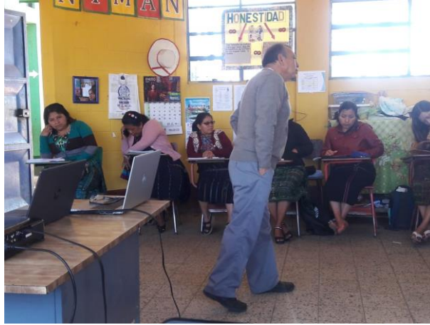
Imagen 13. Acompañamiento del asesor

Este tipo de actividades permitía a los estudiantes cumplir con el cronograma y estar anuentes al trabajo.