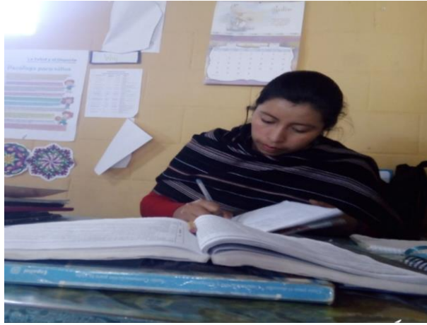
Imagen 4. Selección de lecturas

Esta fotografía evidencia el momento en que se estuvieron seleccionando los textos a utilizar para la ejecución del proyecto.