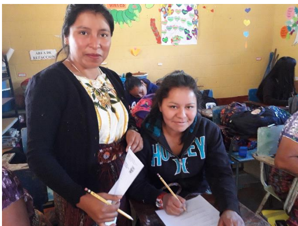
Imagen 17. Socialización de avances con padres