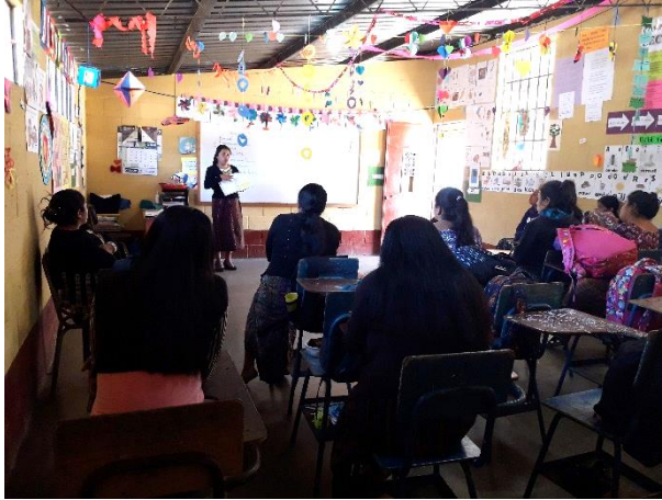
Imagen 6. Reunión con padres de familia