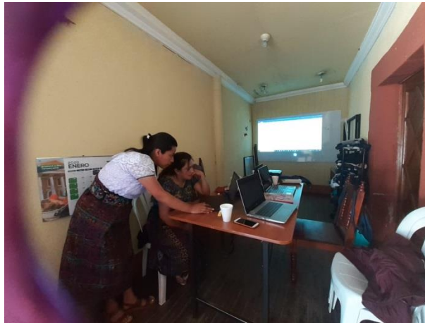
Imagen 3. Planificación de actividades

Luego del análisis realizado respecto a las necesidades que se presentan con los estudiantes, el enfoque será la comprensión lectora y se realizará a través de diferentes tipos de lectura.