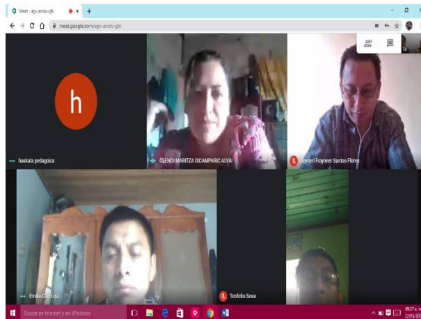
Imagen 15. Clases virtuales

Se utilizaron diferentes plataformas digitales para tener comunicación entre estudiantes, asesor, coordinador de sede y coordinador departamental del programa, es de reconocer que durante las primeras sesiones de trabajo no se logró la totalidad de participación de los estudiantes, debido a problemas en la red, por ello se programaron reuniones por municipio, estas resultaron bastante efectivas, los grupos eran de menor cantidad de participantes y todos opinaban, también daban a conocer sus inquietudes en lo que se realizaba.