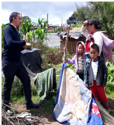
Figura 6 Narración testimonial de habitantes.

Para recabar información verídica del Proyecto de Mejoramiento Educativo se tuvo que llevar a cabo diferentes acciones, para lograr un diagnóstico sustentable de la institución seleccionada, tomando en cuenta los hechos históricos, psicológico, sociológico, cultural, indicadores educativos, políticas a Nivel Institucional. En relación a la historia se valoró la narración testimonial de personas conocedoras y datos recabados en alcaldía comunal.