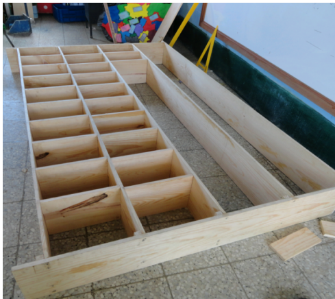
Figura 8 Armazón de casillero.

Para la armada del casillero, estantería y el pintado de espacio físico se contó con la ayuda de los alumnos.