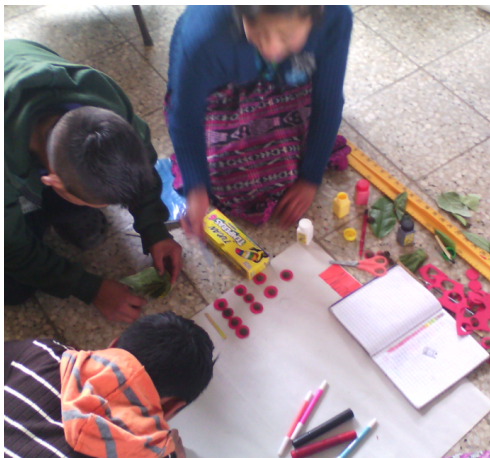
Figura 13 Materiales elaborados para el rincón de aprendizaje.