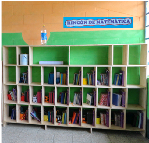
Figura 10 Rotulación de Rincón de matemática.

Algo muy importante en un rincón de aprendizaje es la rotulación, para identificar el área en que desean trabajar los alumnos, después de haber pintado y culminado la realización del casillero y estantería, se procede a rotular los espacios asignados, elaboraron letras grandes para que sea visible para todos los niños.