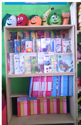
Figura 11 Rotulación de Rincón de lectura.