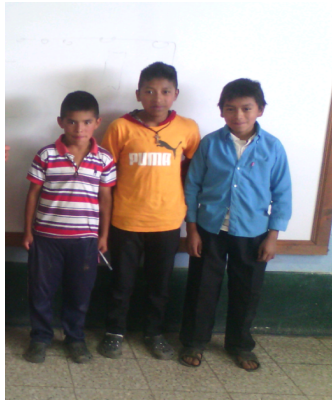
Figura 7 Comisión de rincón de aprendizaje.

Para mantener una buena organización dentro del aula se forman comisiones que velan por la disciplina y el mantenimiento del rincón de aprendizaje, con el propósito de darle un buen uso a los materiales y objetos que les servirá para sus aprendizajes al mismo tiempo hacer que asuman responsabilidades.