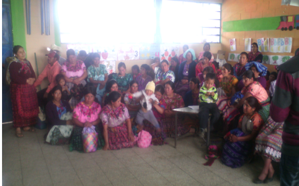
Figura 4 Socialización con la comunidad educativa del PME.

Después de ser autorizado por el señor director, se convocan a los padres de familias y personal docente para socializar de qué se trata el Proyecto de Mejoramiento Educativo, detallando para su comprensión.