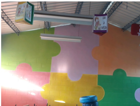
Figura 9 Diseño de pintada.