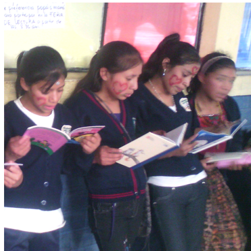
Figura 15 Momentos de lecturas.