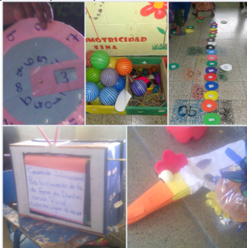
Figura 12 Materiales elaborados con objetos reciclables.

Otros materiales reciclables que forman parte del rincón de matemáticas y que fueron recolectados por los alumnos son: Pajillas, piedras, hojas, semillas, tapitas y palitos. Materiales adquiridos con fondos propios: plastilina, paletas, tangram, hojas de lecturas, tarjetas con adivinanzas, rompecabezas, dado de esponja, teatrín, títeres e imágenes impresas para cuentos.