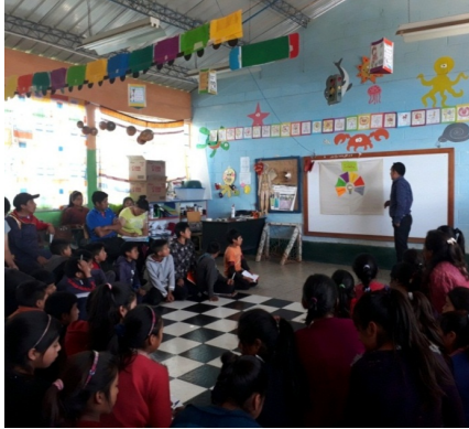
Figura 5 Capacitación a docentes y alumnos.