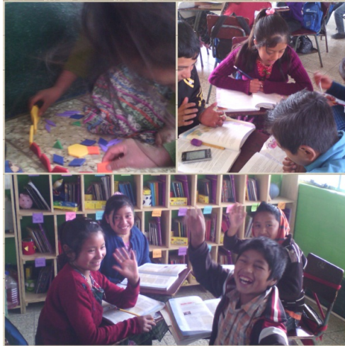
Figura 14 desarrollo de actividades grupales.