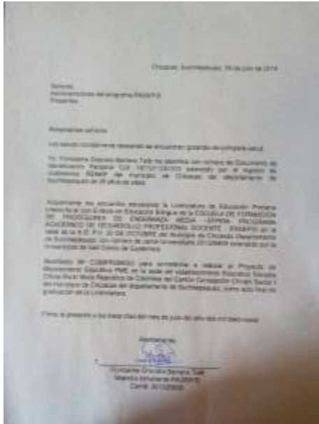
Fotografía 02: Carta de compromiso