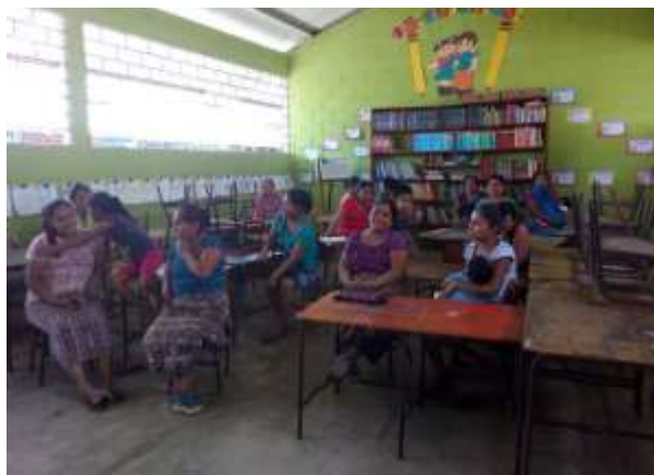
Fotografía: 28 Inauguración del proyecto

El 15 de enero se invitó a los padres de familia para la inauguración del proyecto, para que sepan los objetivos que se pretenden alcanzar con sus hijos, aunque como todas las reuniones, no hubo mucha participación, pero para los que llegaron se les brindó la información y hasta se pusieron de acuerdo para ayudar con la