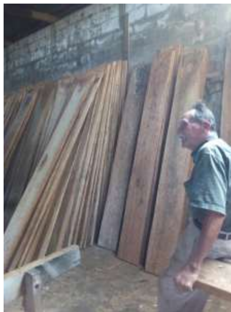
Fotografía 18: Cotización de la madera

Al ver que físicamente se tiene suficiente material para trabajar se procede a la instalación del rincón de lectura en el aula de segundo grado sección B, para eso se inicia con el proceso de cotización de madera para la construcción de una estantería donde se colocarán los libros el 20 y 21 de diciembre de 2019. El 22 de diciembre se procede a la compra de la madera que fue valorada en 700 quetzales la docena, se compró docena y media de madera, dando un total de Q. 1,050.00.