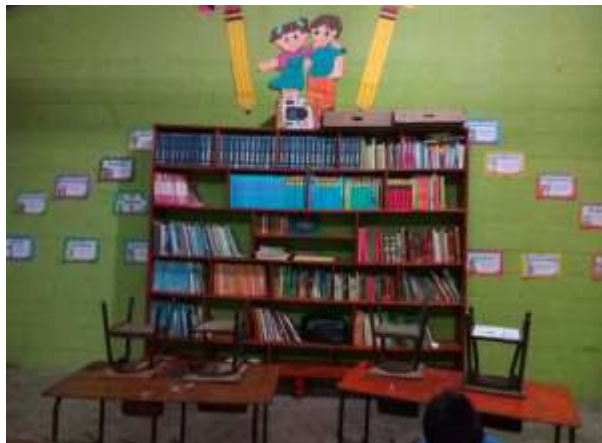
Fotografía 27: Instalación del rincón de lectura en el aula de segundo B.

El 14 de enero se instaló el rincón de lectura en el aula de segundo grado sección B, se colocaron los libros y se decoró el espacio. No estaría de más decir que los niños demostraron mucha emoción al observar los libros y querían leer todo a la vez, sin embargo, se les dio a conocer el horario de uso para el cuidado que deberían tener al utilizarlos.