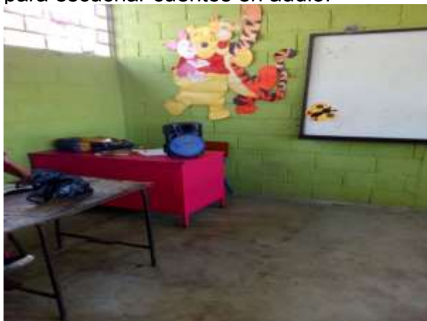
Fotografía: 30: Reproductor de música para escuchar cuentos en audio.