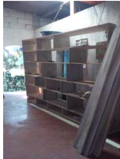
Fotografía 25: Estantería