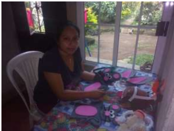
Fotografía 37: Elaboración de títeres.

relatan, también resulta aprendizaje significativo para los niños que observan la presentación de la obra, ya que no es algo que se ve todos los días,