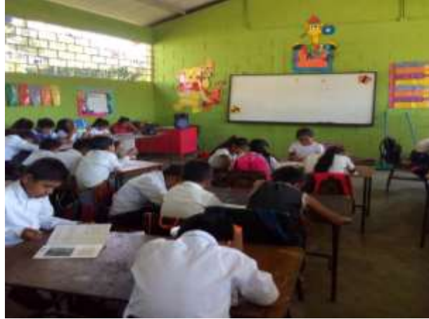
Fotografía 33: Estudiantes en el horario de lectura, practicando la lectura coral.

En la fecha 9 al 11 de marzo se trabajó lectura coral con los niños para emparejar su ritmo en el momento de leer, en esta etapa los niños ya saben leer con más fluidez, sin embargo, necesitan agregarle ritmo a su lectura para lograr una mejor comprensión sobre los valores que se están trabajando.