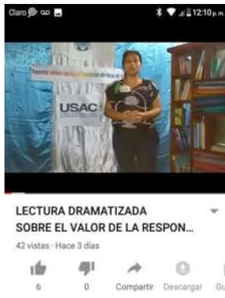
Fotografía 35: Tomada de YouTube

Si hablamos de economía, la actividad que se puede ver en el link, llevó una pequeña inversión de aproximadamente Q. 50.00, sin embargo, con los estudiantes se pueden trabajar con materiales más sencillos que ellos puedan encontrar en sus hogares fácilmente.