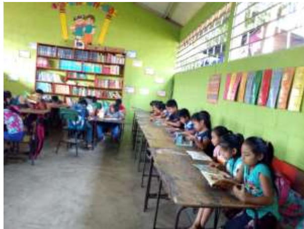
Fotografía 29: Alumnos de segundo B, en el horario de lectura.

Del 16 al 31 de enero se trabajó lectura superficial, entendiendo que los niños son lentos aun en lectura, porque están iniciando segundo grado, los libros que se les concedió contenían pocas letras y grandes, eso los motivaba a seguir leyendo ya que los más rápidos leían tres libros en la hora, lo que más les encantaba es que podían elegir los libros que querían leer.