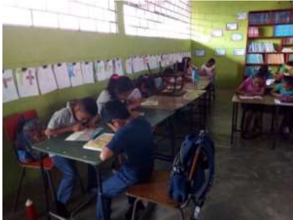
Fotografía: 34. Estudiantes de segundo grado. practicando la lectura silenciosa.