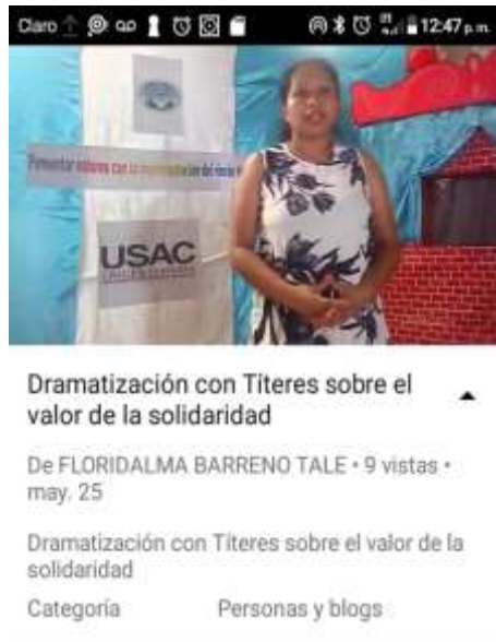
Fotografía 36: