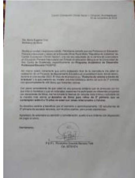
Fotografía 07: Solicitud enviada a Biblioteca María