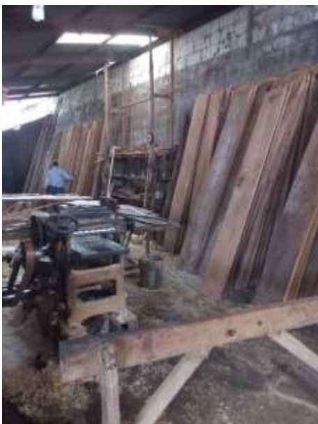
Fotografía 19: Compra de la madera.