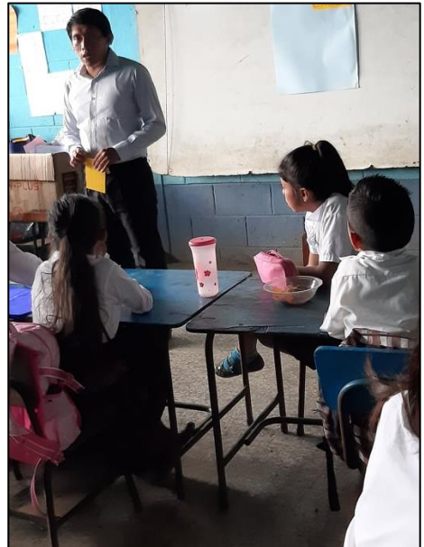
Fotografía No. 6 Charla con estudiantes

La siguiente actividad fue el taller con los estudiantes de tercer grado de primaria el cual se tituló La Magia de la lectura, la actividad se llevó a cabo como parte del Proyecto de Mejoramiento Educativo, en el cual se pudo evidenciar que al utilizar diferentes estrategias para la lectura se logra captar la atención de los estudiantes, esto favorece el proceso de comprensión lectora, porque se ha evidenciado que a muchos niños este proceso se le dificulta y sin duda una de las razones es la falta de atención, se pretende crear el hábito de la lectura en los estudiantes.