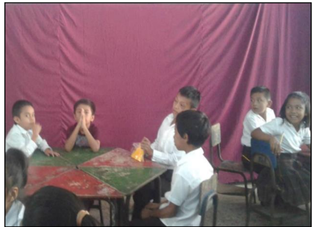
Fotografía No. 10 Concurso de trabalenguas

En la siguiente actividad se realizó un concurso de trabalenguas con la intención de que los chicos se interesen en la lectura, los trabalenguas son un recurso ideal por el cual los niños y niñas adquieren rapidez y precisión en el habla. Ellos se divierten, sin saber que están aprendiendo a estimular su vocabulario y su dicción, también ayuda a aumentan su atención y su memoria. Este pasatiempo influye favorablemente en la comprensión lectora. Dicha actividad fue de mucho provecho, porque se logró la participación del 100% de los estudiantes.