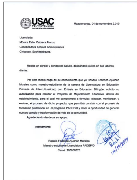
Fotografía No. 1 Carta de autorización Fuente: Colección privada 2019