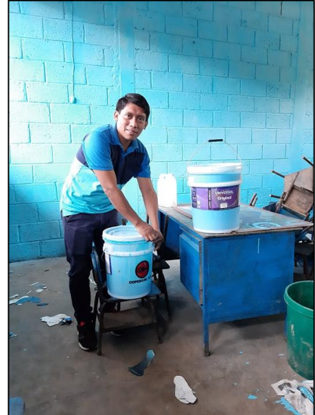
Fotografía No. 3 Pintando el aula

La actividad se llevó a cabo para brindarle a los estudiantes un ambiente de trabajo agradable, colorido y sobre todo limpio, porque sin lugar a duda esto los motiva a participar y hacer mejor las cosas.