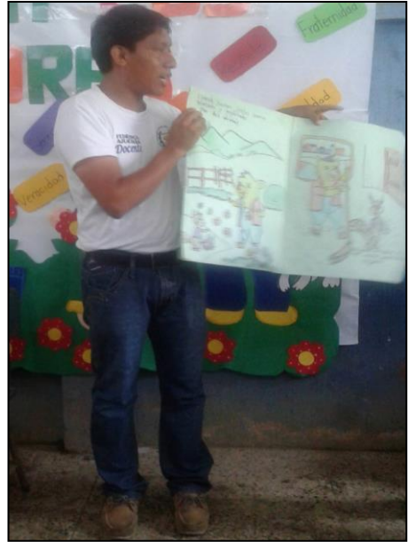
Fotografía No. 13 Libros gigantes

En la siguiente actividad se elaboraron libros gigantes con los estudiantes de tercer grado de primaria, los estudiantes durante la actividad se mostraron entusiasmados, participaron cooperativamente debido a que se trabajó un libro gigante por cada grupo de cinco integrantes, entre los materiales que se utilizaron se encuentran: cartulinas, hojas de papel bond de colores, resistol, tijeras, crayones, entre otros. El contar cuentos a los niños proporciona grandes beneficios y que mejor que ellos redacten sus propios cuentos, sin lugar a duda el leer cuentos con los estudiantes permite que desarrollen diferentes habilidades y destrezas, al mismo tiempo que adquieren conocimientos proporcionados por las historias narradas.