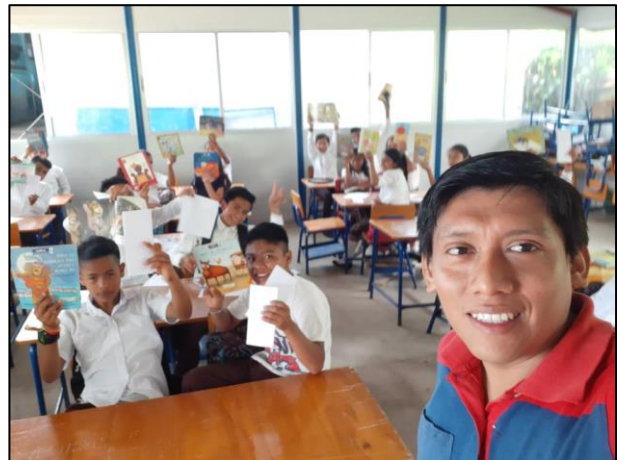
Fotografía No. 16 Elaboración de trifoliales

Siguiente actividad elaboración de trifoliales, para esta actividad se necesitaron los siguientes materiales: hojas de papel bond, marcadores, crayones, lápiz y mucha imaginación. La actividad inicio con la lectura por parte del docente a cargo del proyecto, luego los estudiantes elaboraron un trifoliar acerca de la lectura y tomando como base dibujos que representaran el inicio, el desarrollo y el desenlace del cuento. Los estudiantes se mostraron muy entusiasmados durante el proceso, la actividad fue un éxito porque todos los estudiantes elaboraron su trifoliar de manera creativa.