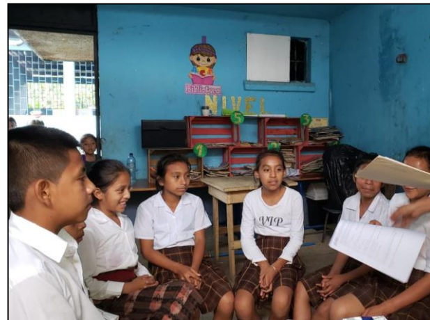
Fotografía No. 8 Sopa de letras.

En la siguiente actividad se realizó una sopa de letras la cual consistió en descubrir un número determinado de palabras enlazando letras de forma horizontal, vertical o diagonal y en cualquier sentido, tanto de derecha a izquierda como de izquierda a derecha, lo que implicó la posibilidad de que algunas palabras las encontraran al revés, y tanto de arriba abajo, como de abajo arriba. Dicha actividad estaba provista de un listado de palabras las cuales tenían que encontrar. Lo interesante de la sopa de letras es que entre más lees más palabras encontramos, la actividad fue de mucho provecho, porque se logró que los estudiantes se concentraran en la lectura para encontrar el conjunto de palabras de un tema en específico.