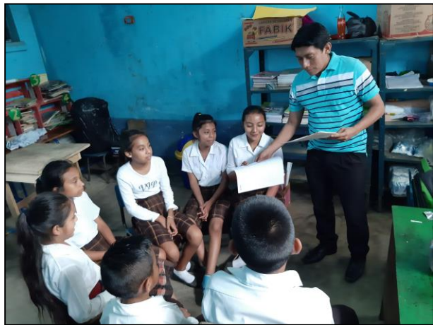
Fotografía No. 12 Lectura en voz alta

En la siguiente actividad se titula lectura en voz alta, esta técnica es muy provechosa, porque aumenta el nivel de comprensión lectora en los estudiantes, también favorece el aumento de la motivación por la lectura y la adquisición de nuevo vocabulario, esto se debe a que los estudiantes se acostumbran a oír nuevas palabras en diferentes contextos y de diferentes compañeros. Además, cuando el estudiante lee en voz alta aumenta su atención y recuerda mejor las palabras. Una buena herramienta para utilizar en clase, son libros que tengan ilustraciones, el leer en voz alta puede parecer muy normal, pero para algunos estudiantes puede ser dificultoso. Dicha actividad resulto de mucho provecho debido a que se evidencio quienes leen fluido y quienes necesitan apoyo por parte del docente.