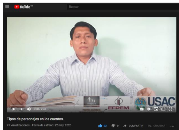
Fotografía No. 18 Tipos de personajes

El segundo video con la temática de Tipos de personajes en los cuentos, la actividad consistió en elaborar un video en la plataforma de YouTube, en dicho video se puede observar algunas técnicas para identificar a los personajes primarios, a los secundarios e incidentales o esporádicos en un