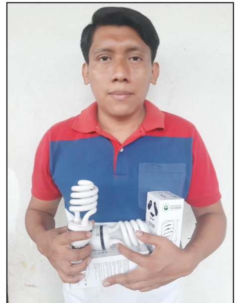
Fotografía No. 4 Obtención de bombillos para iluminar el aula. Fuente: Colección privada 2019

La siguiente actividad consistió en agenciarse de bombillos eléctricos para iluminar el aula ya que se cuenta con electricidad dentro del centro educativo, pero no se contaba con bombillos eléctricos que favorecieran la iluminación dentro del salón de clases lo cual es seguro que favorecerá. Para que se lleve a cabo la lectura de libros, historietas, el periódico, revistas entre otros por tal motivo se tomó la decisión de agenciarse de ellos.