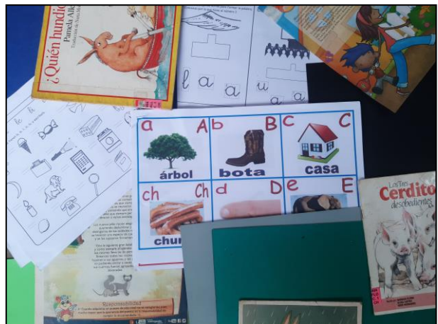
Fotografía No. 2 Material uso en las actividades

En la fase de planificación pude prever los materiales y herramientas a utilizar en el Proyecto De Mejoramiento Educativo en base al tema elegido que es la implementación de rincones de aprendizaje para fomentar la lectura en estudiantes de tercer grado de primaria previendo que los materiales los tuvieran al alcance, utilizando material del contexto, incluso que algunos fueran de reuso para poder llevar a cabo las actividades planificadas.