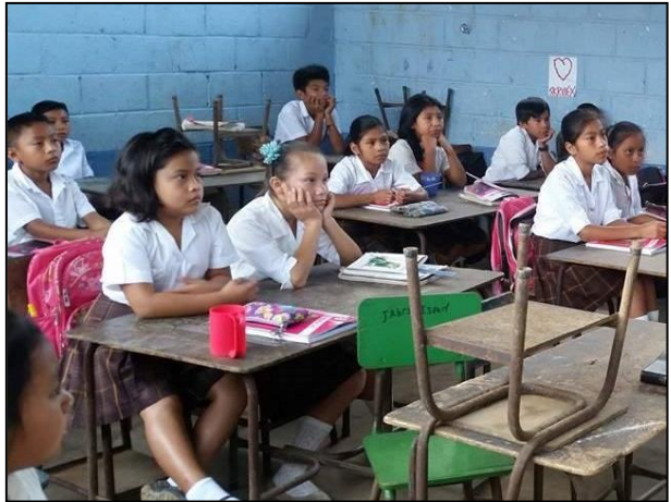
Fotografía No. 9 Adivinanzas Fuente: Colección privada 2020

En la siguiente actividad los estudiantes de tercer grado de primaria solucionaron unas divertidas adivinanzas, los niños se mostraron muy entusiasmados, considero que es muy importante introducir este tipo del juego lúdico, porque ayuda a los estudiantes a centrar su atención. Cuando iniciamos esta actividad los estudiantes prestaron toda su atención en escuchar las adivinanzas y así poder asimilar para poder comprenderlo y adivinar la respuesta cuanto antes. Por lo tanto, se convierte en una herramienta ideal para ayudar a los niños a concentrarse. Por otro lado, las adivinanzas ayudan a su desarrollo intelectual y crítico de los estudiantes ya que deben de escuchar con atención la adivinanza y tienen que comprender y asociar las ideas para poder conocer la respuesta.