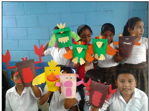
Fotografía No. 14 Fabricación de títeres Fuente: Colección privada 2020

Como siguiente actividad se realizaron títeres con bolsas de papel, para ello cada estudiante se agencio de material apropiado para realizarlos entre ellos: bolsas de papel, papel bond de colores, marcadores, pegamento y tijeras. Los títeres son un medio didáctico muy valiosos porque educan y entretienen. Son ideales para captar la atención de los estudiantes, además través de ellos se pueden expresar ideas, sentimientos, así como representar hechos de la vida diaria. La actividad resulto como se tenía previsto los niños se motivan con este tipo de actividades lo cual favorece el desarrollo de las mismas.