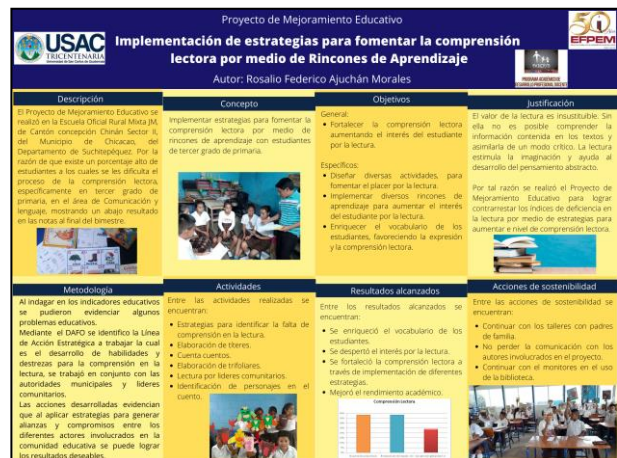
Fotografía No. 19 Póster Académico

En la parte superior del póster académico se encuentra detallando con claridad en que consiste el proyecto y cuál es su nombre, también el póster contiene en el primer recuadro la descripción del Proyecto de Mejoramiento Educativo y las características del establecimiento, en el segundo recuadro se puede observar el concepto del Proyecto de Mejoramiento Educativo, también en el póster académico presentado aparece un tercer cuadro en el cual se encuentran los objetivos generales y objetivos secundarios detallados claramente, en el cuarto recuadro se encuentra la justificación identificando la razón del proyecto, en el quinto recuadro se encuentra la metodología utilizada en el proyecto, en el sexto cuadro se encuentran las actividades desarrolladas durante el tiempo en que se desarrolló todo el proceso del proyecto, en el séptimo cuadro se pueden observar con claridad todos los resultados alcanzados al finalizar el proyecto y por último en el octavo cuadro se pueden ver las acciones a realizar para brindarle sostenibilidad al proyecto de Mejoramiento Educativo.