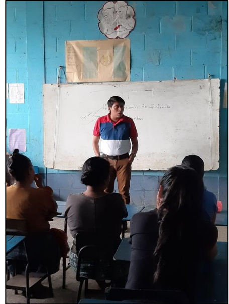
Fotografía No. 5 Talleres de lectura

En esta actividad se realizó un taller con padres de familia de estudiantes de tercer grado de primaria para desarrollado el tema titulado, La importancia de la lectura, los resultados fueron satisfactorios, porque los padres de familia acudieron al taller, prestaron atención y estuvieron de acuerdo a asumir la responsabilidad de apoyar a los niños en cuanto ellos lo requirieran, únicamente se lamentó que cinco madres de familia no pudieran asistir a dicho taller por motivos laborales, pero se les trasladara la información por medio de las vecinas que sí acudieron al taller.