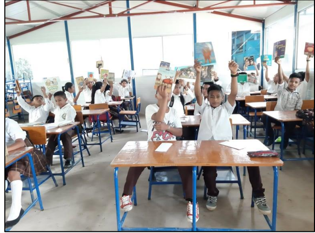
Fotografía No. 7 Lectura de textos.

En la siguiente actividad se realizó un horario de lectura con los estudiantes de tercer grado de primaria, la cual consistió en que todas las mañanas de lunes a viernes de 9:00 a 10:00 debían de leer, para ello se usaron diversas técnicas de lectura como, por ejemplo, la lectura