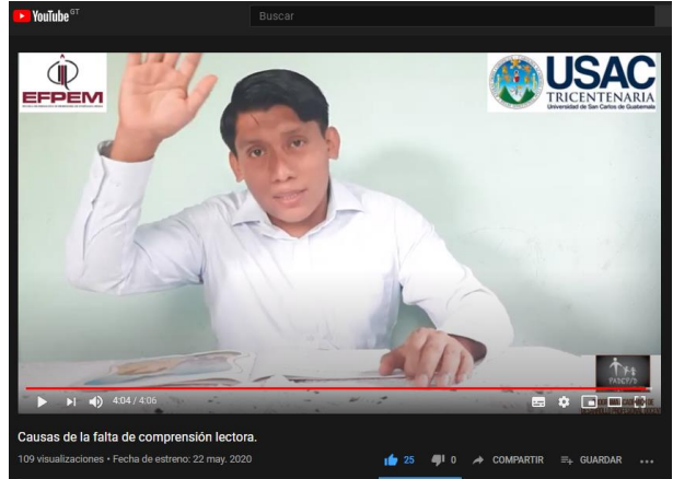
Fotografía No. 17 Comprensión Lectora

El primer video con la temática de Cómo identificar la falta de comprensión lectora, la actividad consistió en elaborar un video en la plataforma de YouTube. Para que los padres de familia sepan como identificar la falta de comprensión lectora en los estudiantes de tercer grado de