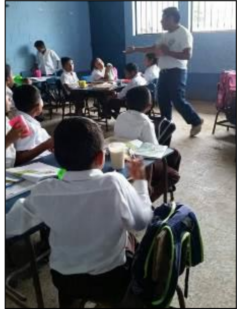
Fotografía No. 11 Lectura de oraciones.

En la siguiente actividad se realizó la lectura de oraciones con los estudiantes de tercer grado de primaria los cuales participaron activamente ya que se les compartió una lectura, luego debían de llevar la lectura con la vista, porque en cualquier momento que el docente los señalara o mencionara el nombre, el estudiante debía de leer hasta encontrarse con un punto, es importante realizar este tipo de actividades, porque la lectura nos proporciona grandes beneficios, potencia la atención, la concentración, desarrolla habilidades lingüísticas.