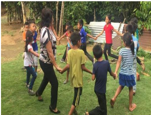
Figura No. 10 Rondas tradicionales realizadas en el centro educativo, PME/2019