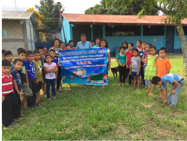
Figura No. 7 Inauguración del Proyecto de Mejoramiento Educativo

Se realizaron actividades lúdicas donde se observó el interés y la alegría de los estudiantes, estos juegos son recreativos, pero a la vez dejan una enseñanza de aprendizaje que con facilidad los estudiantes descubren aplicando estrategias y métodos que sean motivadores e innovadores entre ellas se mencionan atrapar globos, carrera de encostalados, la lotería en Mam, estos juegos son herramientas para enseñar las diferentes asignaturas que comprenden el CNB.