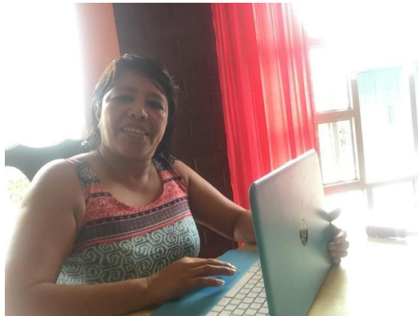
Figura No. 6 Fuente: Imagen Propia PME/2019 Fase de Planificación

En esta fase se elaboraron las planificaciones para el Proyecto de Mejoramiento Educativo, lo cual permitió desarrollar las actividades en un orden sistemático contando con las siguientes actividades, plan de actividades que se llevaran a cabo, monitoreo donde se hará la observación del avance del proyecto con los estudiantes, evaluación, presupuesto del proyecto y sostenibilidad para alcanzar los objetivos propuestos y logrando con éxito todo lo planificado.