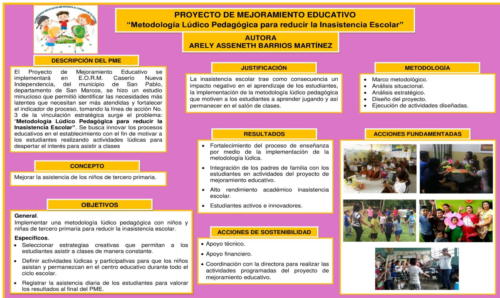
Figura No. 15