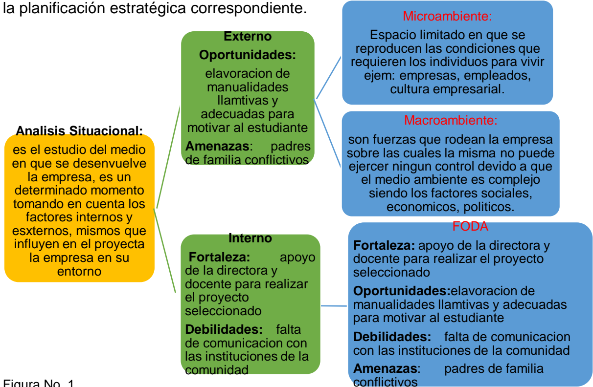
Figura No. 1

El Análisis Situacional es un método que permite analizar dificultades, fallas, oportunidades y riesgos, para definirlos, clasificarlos, desglosarlos, Jerarquizarlos y ponderarlos, permitiendo así actuar eficientemente con base en criterios y/o planes establecidos, sobre todo, para realizar este análisis es necesario contar con datos pasados, presentes y futuros, estos datos son muy importantes, puesto que pueden servir de base para poder seguir con el desarrollo del proceso de la planificación estratégica correspondiente.