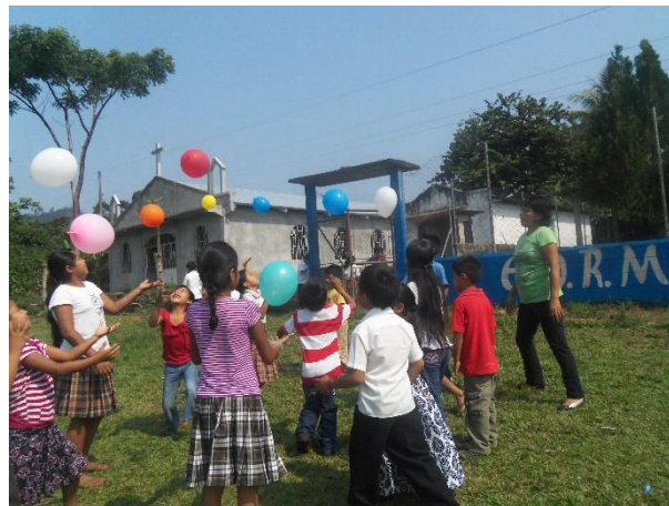
Figura No. 8 Juegos y dinámicas con los estudiantes

Se realizaron actividades lúdicas donde se observó el interés y la alegría de los estudiantes, estos juegos son recreativos, pero a la vez dejan una enseñanza de aprendizaje que con facilidad los estudiantes descubren aplicando estrategias y métodos que sean motivadores e innovadores entre ellas se mencionan atrapar globos, carrera de encostalados, la lotería en Mam, estos juegos son herramientas para enseñar las diferentes asignaturas que comprenden el CNB.