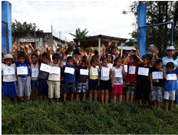
Figura No. 9 Maratón con estudiantes

De igual manera se realizó la aplicación de estrategias y actividades lúdicas para motivar a los niños y niñas para que permanezcan en clases activos, se impartió un taller de elaboración de manualidades con recursos del contexto dando a conocer que dicha actividad ayuda al estudiante a comunicarse, comprender e interpretar el mundo que le rodea, se organizó y realizo una maratón con padres de familia y estudiantes denominada “asisto convivo y aprendo en la escuela con apoyo de mis papas” sabiendo que la convivencia es muy importante para la vida porque favorece la integración y participación, además se presentó un festival de talentos logrando en el estudiante sacar a relucir todas sus actividades y obtiene una bonita experiencia, se realizaron rondas tradicionales con los estudiantes.