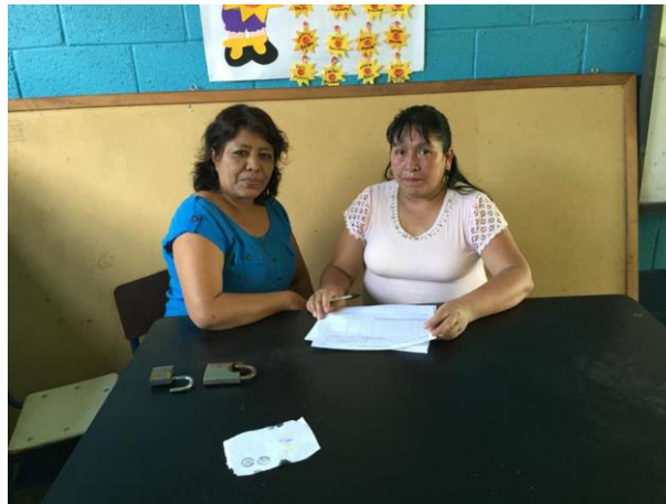
Figura No. 4

En esta fase se elaboró la solicitud dirigida a la directora para dar a conocer la realización del Proyecto de Mejoramiento Educativo denominado “Metodología Lúdico Pedagógica para reducir la inasistencia escolar”, la cual amablemente fue aceptada se llevó a cabo la socialización con padres de familia a quienes se les concientizo sobre la importancia de la asistencia escolar.