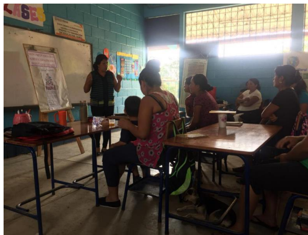
Figura No. 5

Fuente: Imagen Propia PME/2019 Solicitud de autorización