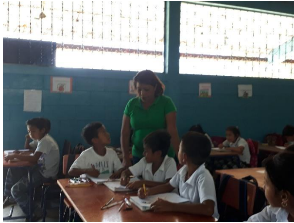
Figura No. 13

En esta fase se realizó una verificación del avance de proyecto se lleva un control de todas las actividades con el fin de cumplir y lograr el objetivo, diariamente durante las actividades se tomó asistencia de los estudiantes para motivarlos para que permanecieran en las diferentes actividades lúdicas realizadas en el proyecto de mejoramiento educativo tanto en el establecimiento como en los hogares con el apoyo de padres de familia.