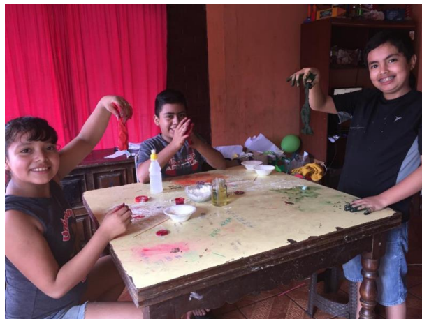
Figura No. 12