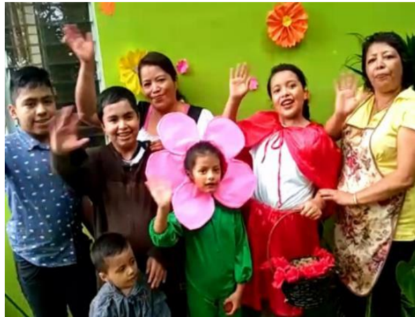
Figura No. 11

Se hizo en un taller motivacional dirigido a padres de familia y estudiantes sobre la importancia de la asistencia escolar para mejorar el rendimiento académico. Es interesante para el estudiante para compartir sus experiencias y juntos dialogar en busca de cambios familiares y educativos, por motivo de la pandemia Covid-19 se hizo uso de la tecnología readequando tres actividades que no fueron posibles desarrollarlas en el centro educativo entre ellas, la dramatización de un cuento, donde los niños aprenden la práctica de valores, de responsabilidad y disciplina, demostrando sus destrezas y habilidades, también se realizó la elaboración de manualidades con recursos del contexto con los estudiantes y apoyo de padres de familia también un festival de talento desde casa por vía WhatsApp.