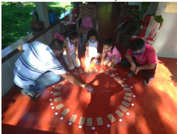
“El abecedario Chispudo”.

El profesor Edi da instrucciones como jugar con El Abecedario Chispudo, los niños participantes Atentos para poder participar.