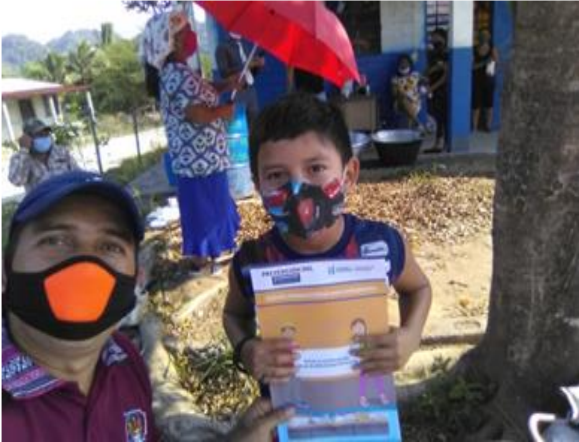
Haciendo entrega de guías de trabajo durante la pandemia para mejorar la lectoescritura.