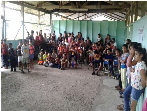
Verificando la capacidad del aula de quinto y sexto para dar charlas y talleres Como seguimiento al pme.