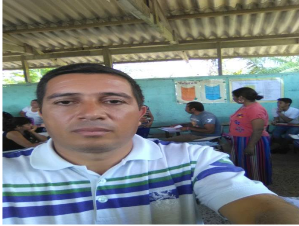
Reunión de docentes y padres de familia.

Elección de los miembros para comité de Apoyo, en forma Democrática, al fondo se observa la directora, docentes y padres de familia