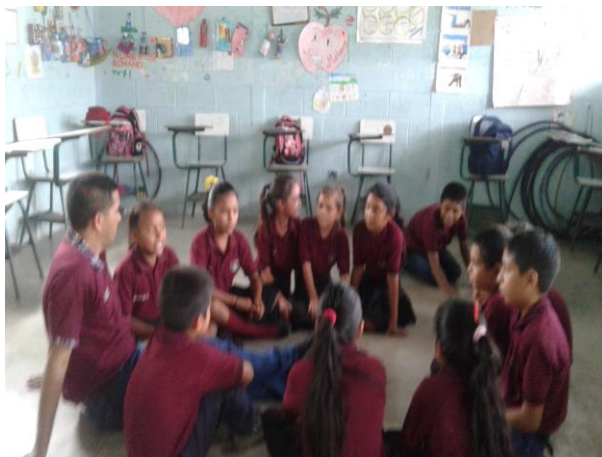
Lectura en voz alta

Realizando una puesta en común después De la lectura en voz alta con alumnos de Tercero primaria. E.O.R.M Rubelsanto.