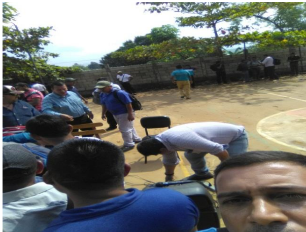
Finalizando actividad de planificación

Finalizando la planificación de actividades estratégicas Para mejorar la comprensión lectora.