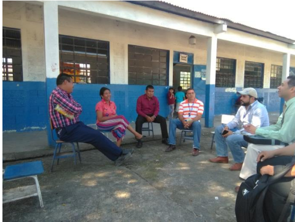
Reunión de docentes.

Fuente: fotografía tomada por el profesor: Wilmer Aminohan Ta Pop. Docentes Consensuando la planificación de Charlas y talleres, como Seguimiento al proceso del PME, junto con el SINAE.