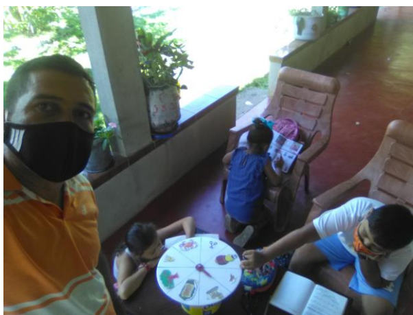
La ruleta Cuentera

Realizando pequeños cuentos con la técnica La Ruleta Cuentera, con el grupo de niños Participantes en el hogar de la familia Muñoz Estévez