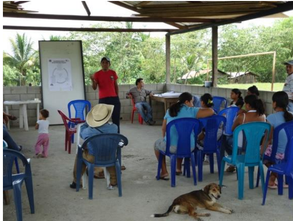
Fuente: fotografía tomada por el Profesor: Edi Oliverio Muñoz Mijangos. Padres de familia en una reunión general en el salón comunal.