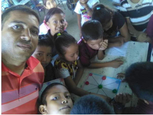
Niños de tercero primaria.

Fuente: fotografía tomada por el profesor: Edi Oliverio Muñoz Mijangos. Realizando algunas técnicas de lectoescritura para su exposición Con los padres de familia en cartulinas.