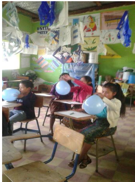
Imagen 4. Técnica "globo de la autoestima"