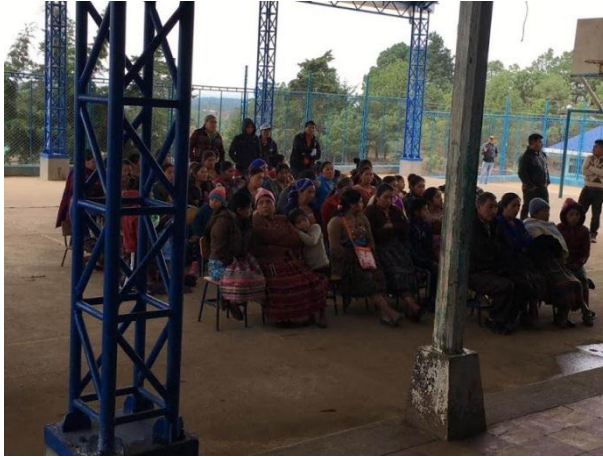
Imagen 3. Lanzamiento