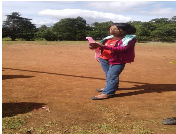
Imagen 7. Taller de globoflexia