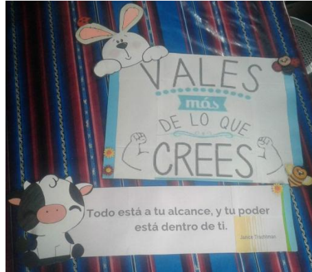
Imagen 5. Carteles positivos