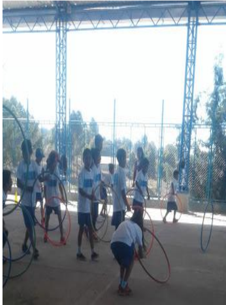
Imagen 6. Rally por equipos