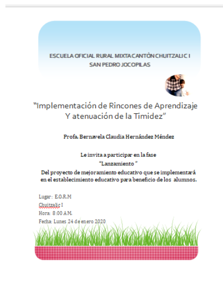
Imagen 2. Invitación