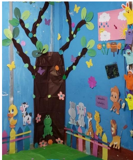
Imagen 8. Modelo de rincón de aprendizaje