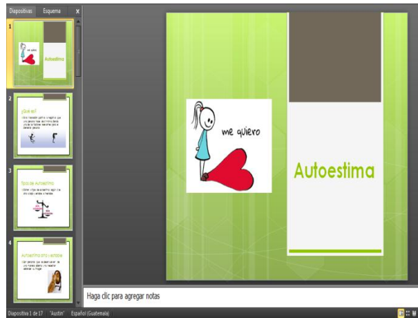
Imagen 10. Diapositivas de autoestima