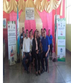
Fase de Planificación