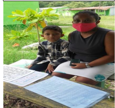
Fase de Evaluación