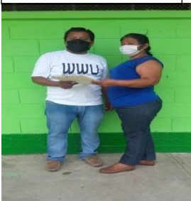
Fotografía No. 6

Esta fase consiste en la entrega del informe final de la culminación de las diferentes fases y actividades establecidas en el PME.