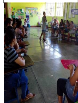
Fase de Monitoreo