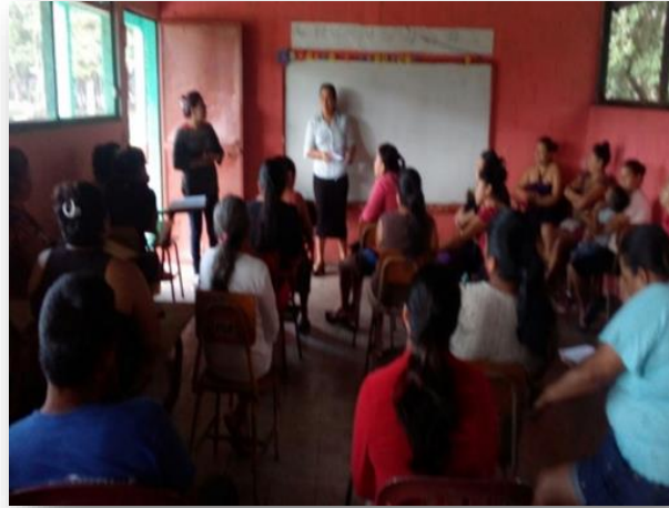
Fotografía 1: Reunión de padres de familia

Organizar de manera oportuna las diferentes actividades para la ejecución del proyecto de mejoramiento educativo en la Escuela Oficial Urbana Mixta 3 de abril, jornada matutina.