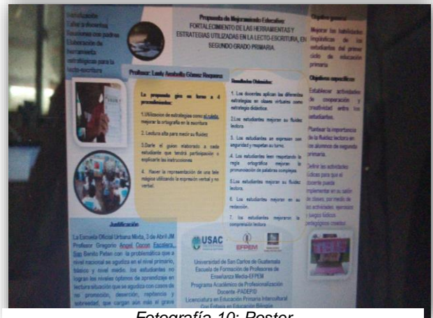
Fotografía 10: Poster

Se dio a conocer a las autoridades y comunidad educativa, las ventajas del Plan de Mejoramiento Educativo comparando el desarrollo de las estrategias de lectoescritura y comunicativas antes, durante y después de la aplicación del PME. Trifoliar y un Poster. Para dar finalidad al proyecto de mejora educativa, que se realizó en la Escuela Oficial Urbana Mixta, “3 de abril Profesor Gregorio Ángel Cocón Escalera” en su Jornada Matutina con gran éxito.