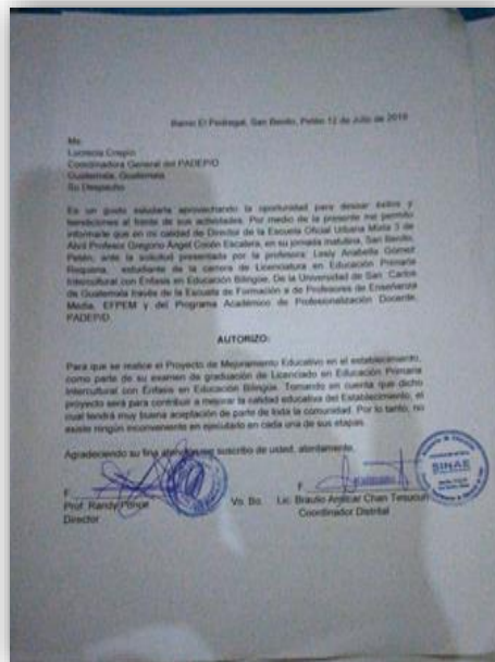
Documento1: Solicitud al coordinador distrital

En la fase de inicio se logró informar y obtener el permiso correspondiente del coordinador distrital para la realización del PME en la Escuela Oficial Urbana Mixta “3 de abril, Profesor Gregorio Ángel Cocón Escalera”, jornada matutina, de igual forma la directora del establecimiento autorizó la ejecución del mismo.