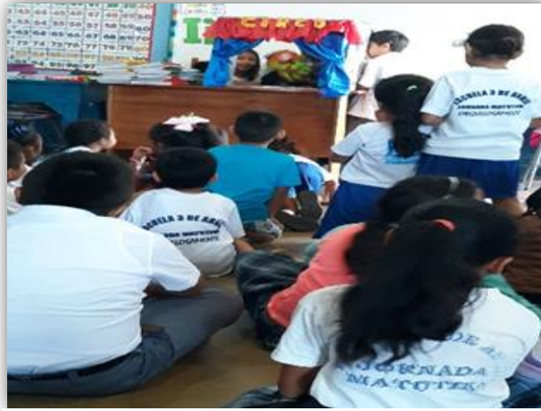
Fotografía4: Presentación de teatrín

Los estudiantes mejoraron su comportamiento individual y grupal al participar en las actividades lúdicas