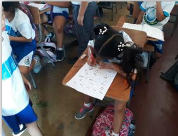
Fotografía 5: Sopa de letras

Los estudiantes mejoraron su expresión oral y escrita, comprendiendo el mensaje de los temas impartidos en clase.