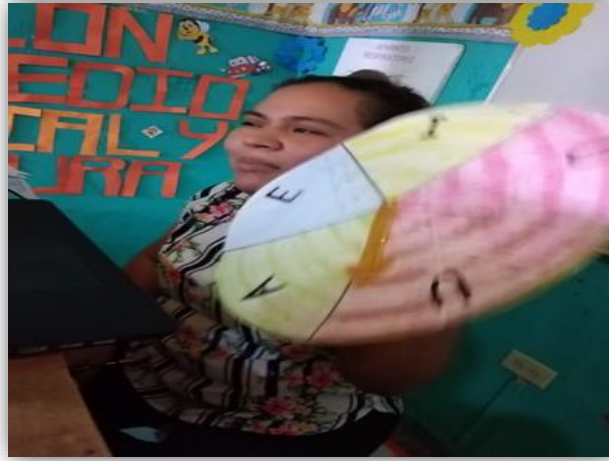
Fotografía 3: La ruleta

Con la finalidad de mejorar la lectura y escritura en los niños y niñas ya que , es muy importante , que el estudiante lea y entienda lo que esta esta escribiendo Tomando en cuenta de los que se esta viviendo , es una parte muy fundamental del apoyo de los padres de familia ya que estan en casa recibiendo las clases eso es un punto a favor, para facilitar el aprendizaje l estudiante. Como lo muestran las fotos son los materiales que se presentaron a los padres y alumnos.