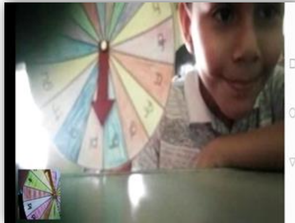
Fotografía 10: La Ruleta

Relación como herramienta de apoyo, en la actividad de la ruleta, para observación de la expresión oral para mejorar la fluidez lectora, del estudiante al pronunciar las palabras como lo demuestra la foto logrando así el objetivo.