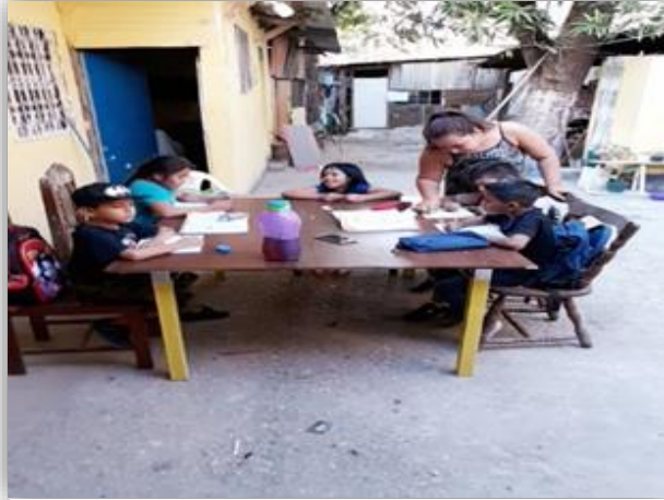
Fotografía 7: Visita y revisión de tareas

Para poder dar un resultado fiable, con los estudiantes de segundo grado primaria de la escuelita 3 de abril jorna matutina obtener un registro confiable de los avances obtenidos por el docente al estudiante: