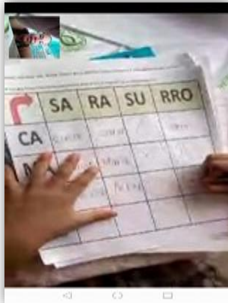
Fotografía 2: Siguiendo la ruta

Como parte del proceso de planificación se lograron ubicar en tiempo y espacio las actividades y recursos que se utilizarían en el PME durante la fase de ejecución, a los padres de familia, la presentación de las herramientas a utilizar en el área de comunicación y lenguaje.