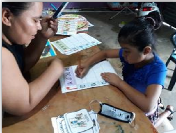
Fotografía 6: Revisión de tareas

Elaborar instrumentos que permitan obtener información de los resultados obtenidos en la aplicación del proyecto de mejoramiento educativo.