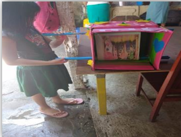
Fotografía 5: Tele mágica

Donde mandaban las diferentes actividades de sus hijos, tomando fotos, videos, grabación de voz sobre, para escuchar la fluidez lectora. Gracias a ellos se logró evidenciar, si las estudiantes estaban cumpliendo, con lo establecido, como se demuestran en las siguientes fotos que se adjuntan al documento, como tema fortalecimiento de las estrategias utilizadas en segundo grado primaria.