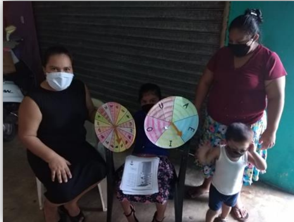
Fotografía 8: Visitas a hogares

Se monitorio personal mente a los niños que no contaban con redes sociales, se visitó en sus hogares con las medidas necesarias, ya que estamos viviendo la problemática del virus que afecta a la humanidad, y también clase virtual personal por cada estudiante.