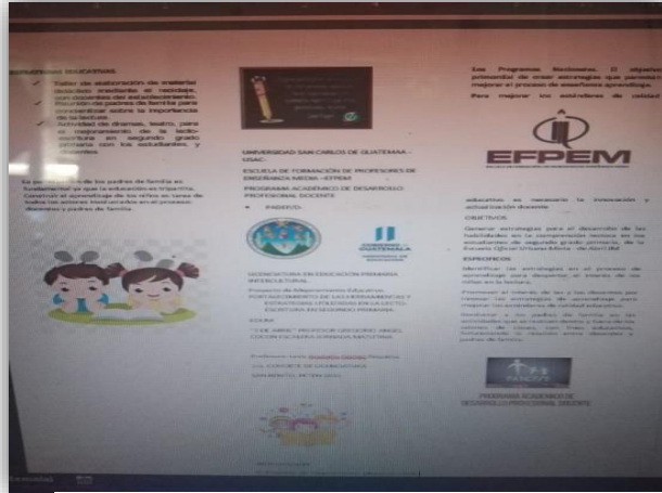
Fotografía 9: Trifoliar informativo

Presentar a la comunidad y autoridades educativas en general, los alcances que tiene el Proyecto de Mejoramiento Educativo aplicado en la Escuela Oficial Urbana Mixta “3 de abril, Profesor Gregorio Ángel Cocón Escalera”, jornada matutina.