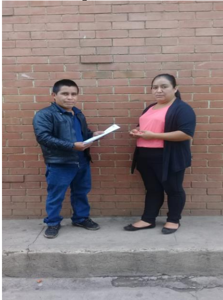
Entrega de solicitudes