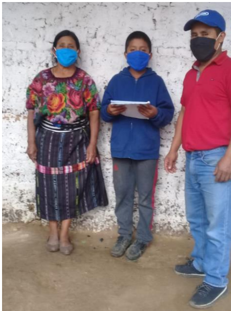
Imagen 4 Visitas domiciliarias