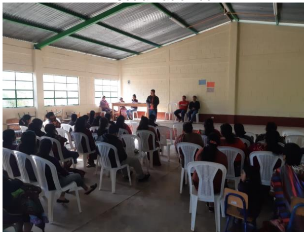
Socialización del PME