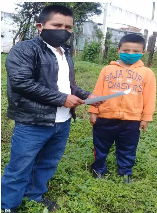
Imagen 5 Entrega de cuadernillos