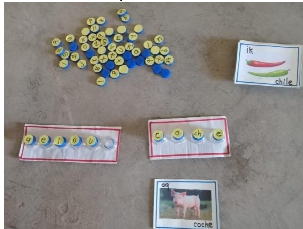
Materiales para la lectoescritura