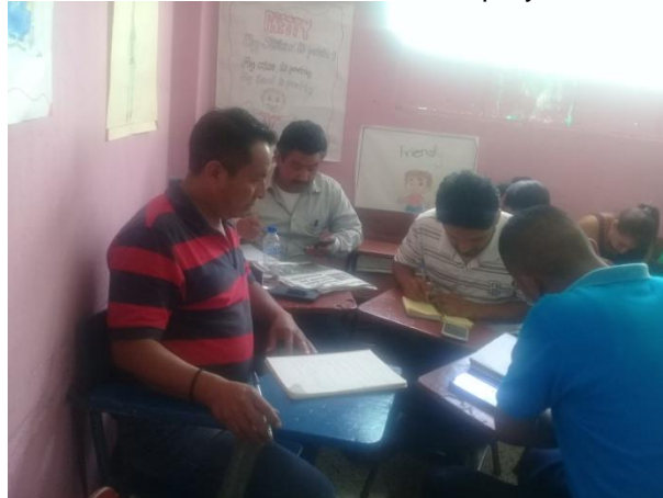
Docentes observando los resultados del proyecto.