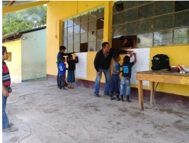
Concurso de lectura y escritura entre los estudiantes.