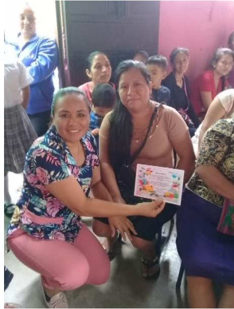
Fotografía No. 4 Entrega de invitación a padres

de mejoramiento educativo, dándoles a conocer de la importancia que es enviar a sus hijos a la escuela diariamente, presentándoles las estrategias que se desarrollaran en el transcurso de la ejecución las cuales motivaran a los estudiantes, docentes y padres de familia.