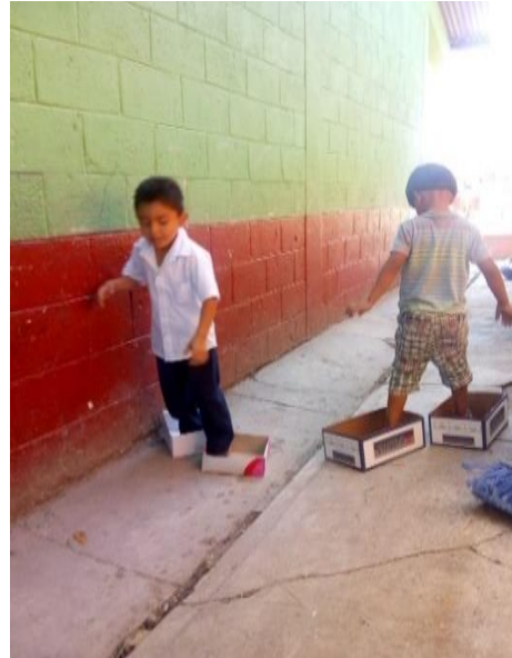
Fotografía No. 8 Niños realizando la actividad

Las visitas domiciliarias se llevaron a cabo en los hogares de los estudiantes que están faltando a diario a la escuela, se platicó con los padres de familia, respondiendo que a veces no les queda tiempo de llevarlos por motivo de trabajo ya sea en el hogar o porque laboran en casas ajenas haciendo oficios domésticos.