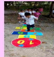
Juegos libres desarrollados