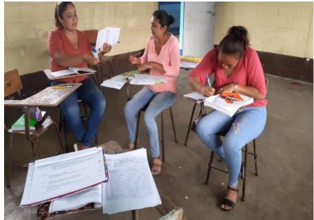
Fotografía No.15 Participación de docentes

Se les dio a conocer las diferentes estrategias las cuales pueden realizar con sus estudiantes para que se motiven desde pequeños y asistan a diario a la escuela y su aprendizaje sea divertido mediante el juego, es una herramienta esencial en el nivel pre primario, se debe de ejercer con objetivos de enseñanza a través de estrategias innovadoras.