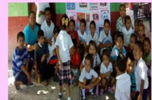
Exposición de la galería alusiva al tema