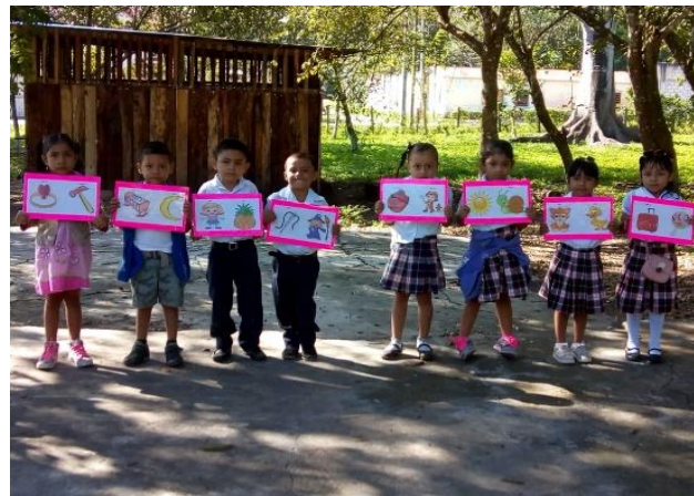
Fotografía No.12 Estudiantes en actividad

Se desarrolló la actividad denominada una mañana de convivencia con estudiantes del nivel pre primario y docentes, quienes fueron las encargadas de dirigir la actividad, con el propósito que los estudiantes socialicen y compartan con sus compañeros