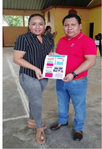
Fotografía No. 18 Entrega de resultados al asesor del curso

Se dieron a conocer los resultados por medio del cumplimiento de las estrategias establecidas durante la ejecución del proyecto, es importante mencionar que el indicador, se ha logrado subir de nivel lo que permitirá tener información cuantitativa del avance de las estrategias. Además, los resultados son favorables en la etapa de cinco años, obteniendo un porcentaje del 80 por ciento de asistencia diaria a la escuela. Es importante reconocer que la comunidad educativa es la esencia porque trabaja colaborativamente en función de una meta en común, deben para ello reconocerse mutuamente cada uno de sus actores como elementos fundamentales en el que hacer educativo.