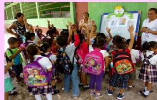
Presentación de galerías de imágenes alusivas al tema