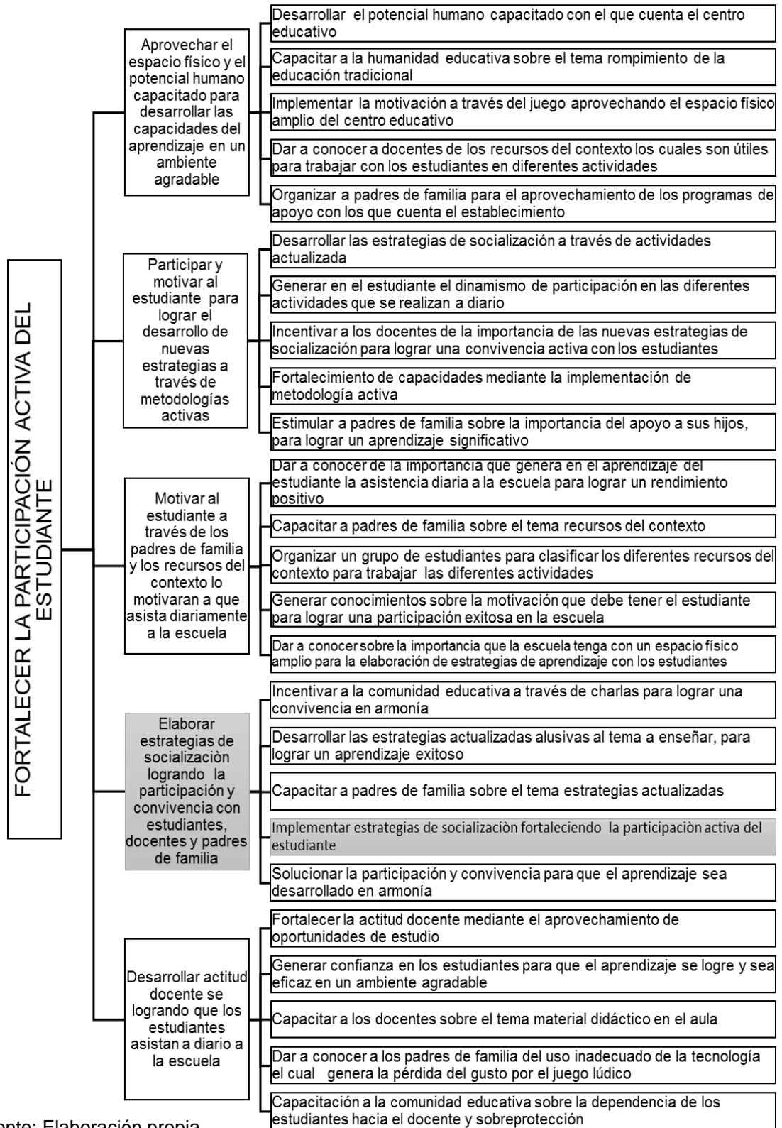
Tabla No. 5 Mapa de soluciones