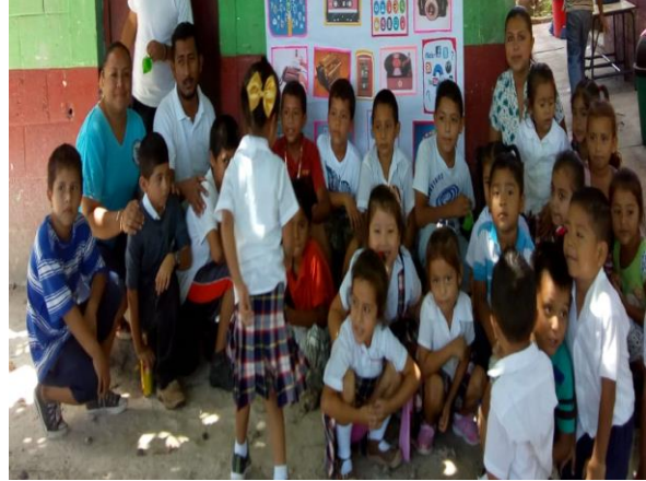
Fotografía No.11 Docentes y estudiantes

Por medio de la presentación de la galería de imágenes los estudiantes observaron las actividades próximamente a ejecutar con el acompañamiento de docentes. A través del juego los niños aprenden a llevarse bien con los demás y a afrontar algunos retos sociales. Cada oportunidad para jugar con otros