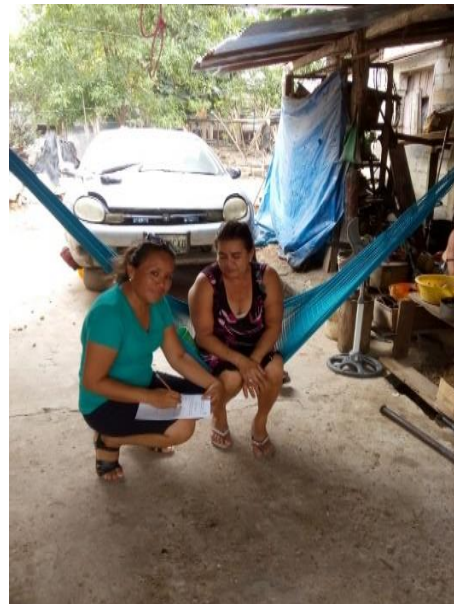
Fotografía No. 9 Docente y madre de familia