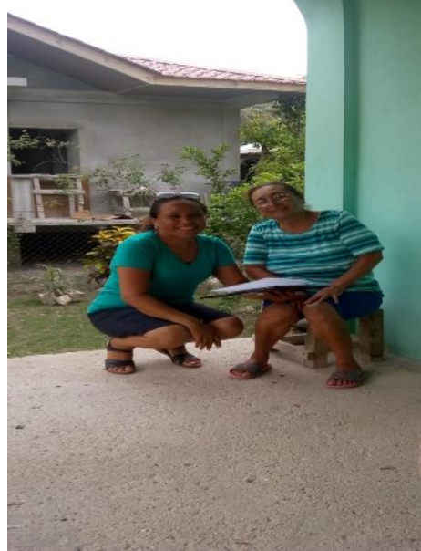
Fotografía No.14 Entrevista a padres de familia

Se invitó a docentes a participar en una pequeña charla, con el objetivo de implementar estrategias de socialización fortaleciendo la participación activa del estudiante, las cuales apoyaran al indicador que esta afectando a las diferentes etapas del nivel pre primario, es importante compartir las experiencias con docentes para que la educación en nuestra municipio sea impartida de una forma diferente en el que el estudiante aprenda de una manera dinámica.