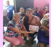
Docente y padres de familia demostrando su apoyo