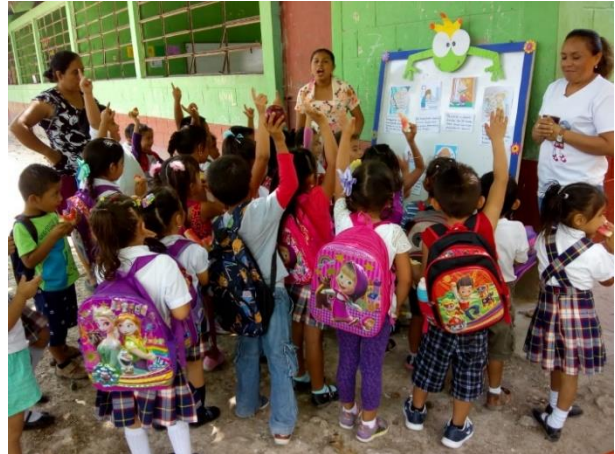
Fotografía No.10 Exposición de galería

Como docente siempre se está poniendo en práctica metodologías y estrategias que den resultados favorables y significativos, el principal objetivo es la innovación. Por medio de la exposición de la galería de imágenes con el tema implementar estrategias de socialización fortaleciendo la participación activa del estudiante,