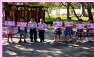
Una mañana de convivencia con estudiantes del nivel pre primario