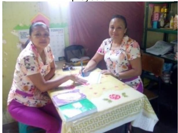
Fotografía No.16 Monitoreando el proyecto

Se llevó a cabo el monitoreo de las diferentes actividades, con el acompañamiento de la docente del nivel pre primario, para ver los logros que se han tenido durante la ejecución del Proyecto de mejoramiento educativo, en los estudiantes de la etapa de cinco años, quienes en el inicio presentaban un bajo nivel de asistencia, logrando a cabalidad los resultados obtenidos que es la asistencia diaria a la escuela.