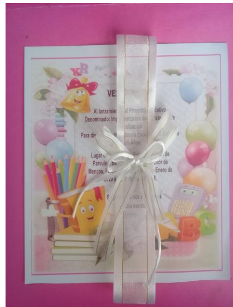
Fotografía No. 3 Invitación del lanzamiento del proyecto

Se decidió juntamente con la comisión de padres de familia y docente de que se imprimieran para luego recortarlas y colocarles un listón para una mejor presentación y quedando de acuerdo para el día viernes entregarlas a todos los padres de familia, para que asistan a la reunión de lanzamiento del PME. Los padres de familia se mostraron muy contentos con esta actividad realizada ya que se convivió con armonía y responsabilidad sobre lo realizado.