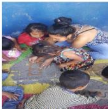
Foto 6 trazo de grafismo con arena

Experiencia para seguir incentivando y que los niños desarrollen a manera de comprensión, en el proyecto se organizan actividades como materiales para poder asignar los recursos adecuados a cada tarea que se trabajara con los estudiantes de igual manera debe estar refregado en el plan de actividades de las actividades llevándolas a cabalidad. Buscando estrategias en cada una que se realicen, al igual involucrar a los padres de familias para que tengan mayor conocimiento de todo lo trabajado en el aula ellos serán un mayor apoyo tanto con el docente como para sus hijos.