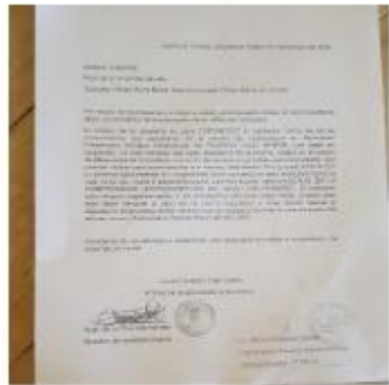
Foto 1 solicitud director y Coordinador

Se realizó el lanzamiento del proyecto de mejoramiento Educativo en el salón de clase con los padres de familia ya que ellos forman una parte muy importante en la educación, autoridades del barrio y docentes dándole a conocer cuál es el nombre de mi proyecto que actividades realizaría en el transcurso de los meses Enero y Mayo del año 2,020 ya que para realizar las actividades se tenía que elaborar una planificación, con sus objetivos para poder lograr todas esas competencia que se quieren obtener con los niños y las niñas al igual verificando que problemas de aprendizaje presentan los niños para buscar estrategias y que puedan ayudar en su aprendizaje.