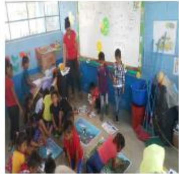
Foto 7 verificando el trabajo de los niños

vocales y en otras actividades e incorporando ejercicios de grafismo que le ayuda a los niños en su motricidad fina y gruesa y en sus aprendizaje significativo logrando también incorporar el plan de actividades donde se alcanzaran los resultados factibles a lo largos de un 85% de metas logradas. Monitoreando como realizaba sus actividades los niños, o si lo realizaban mal se les apoyaría para que fuera correctamente verificando que si el niño se le dificulta para poderlos apoyar.