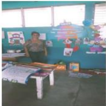
Foto 2 lanzamiento del Proyecto de Mejoramiento Educativo