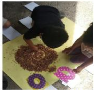
Foto 5 trazo de vocal O con aserrín

En la escuela Oficial de párvulos del barrio el triunfo realizare actividades con los niños y niñas con trazo de la vocal "o" con arena o aserrín ya que con las siguientes actividades se requiere un logro con los niños al igual se motivan jugando y a la vez aprendiendo, sabiendo que es de mucha importancia implementar nuevos dinamismos ya que con cada estrategia que el docente emplea a sus estudiantes va adquirir una evolucionando ya que con los materiales del contexto u otros materiales que tengas al alcance y se nos haga de podemos realizar como rellenar vocales y algunas consonantes con pintura al contorno se lograra en el niño su creatividad y socialización con sus compañeros de una forma amena ya que un clima de clase factible motiva a los niños a participar en todas las actividades por eso se deben implementar otras estrategias como: Ensambalar lana en pedacitos de pajilla eso hace mayor en el aprendizaje y pensamiento lógico y en su motricidad favoreciendo a los estudiantes en todo lo que realizan en el salón de clase