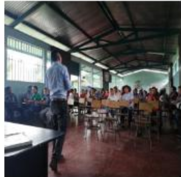
Foto No. 12 Reuniones de padres de familia

Uno de las actividades planificadas fue el informe a la comunidad educativa sobre la finalización del proyecto algo muy similar al lanzamiento mediante una reunión donde tiene ya los resultados están muy concretos de los logros obtenidos para poder deducir el índice escolar sobre la repitencia, pero los padres de familia han respondido con el apoyo de sus hijos se ha logrado el indicador.