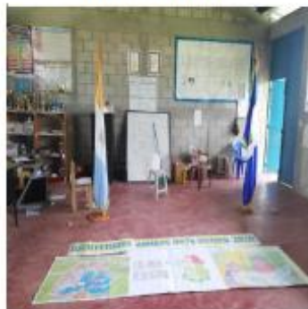
Foto No. 7: Elaboración del material didáctico

Antes de empezar la actividad de la lectoescritura se dio una nota de invitación al director, docentes y alumnos luego se explica la estrategias de los tres momentos de la lectura antes durante y después de parte de los docentes que dirige la actividad de la lectoescritura donde los estudiantes presentan deficiencia en leer y escribir se explica el significado del antes de la