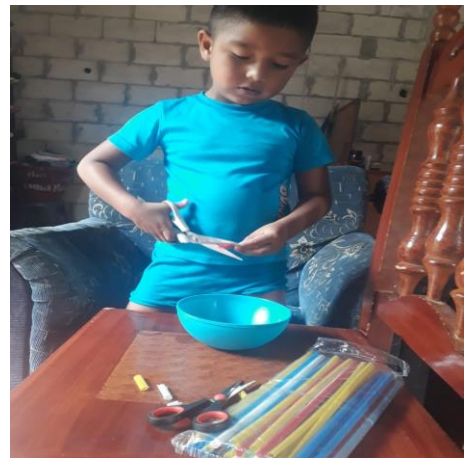
FOTOGRAFIA No. 7 Corte con tijeras y elaboración de pulsera y collar