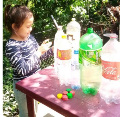
FOTOGRAFIA No. 6 Actividad de la vida cotidiana (María Montessori) enroscar y desenroscar tapitas plásticas

En este caso el corte de tijeras es para hacer segmentos pequeños de pajillas para elaborar collares y pulseras, hilvanar pajillas con lana, esta acción de agarrar los objetos precisa uso de dedos en que se inserta la lana con pajilla, estimula la coordinación ojo mano, apoya en el uso refinado de controlar las manos, dedos y el pulgar preparándolos para la grafomotricidad escritura y dibujo.