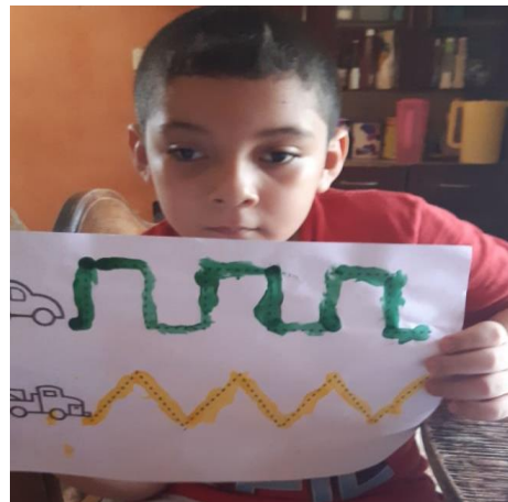
FOTOGRAFIA No. 5 Aprestamiento de forma dactilar con tempera de colores