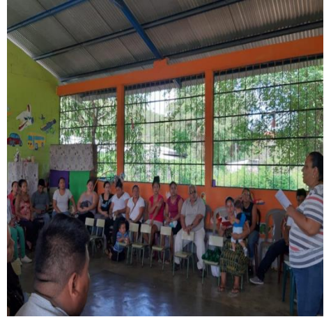
FOTOGRAFIA No. 4 Taller a padres de familia de las secciones de 6

De esta forma se cambió por algunas acciones de aprestamiento para preparar al estudiante a la escritura, esta actividad es para toda la vida puesto que promueve el desarrollo de habilidades, destrezas y adquisición de hábitos, dicha actividad se realizó de forma dactilar con el uso de temperas del color deseado.