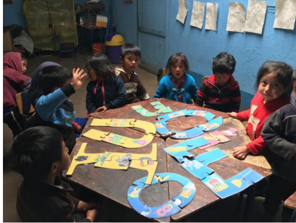
Imagen No. 3 niños jugando rompecabezas