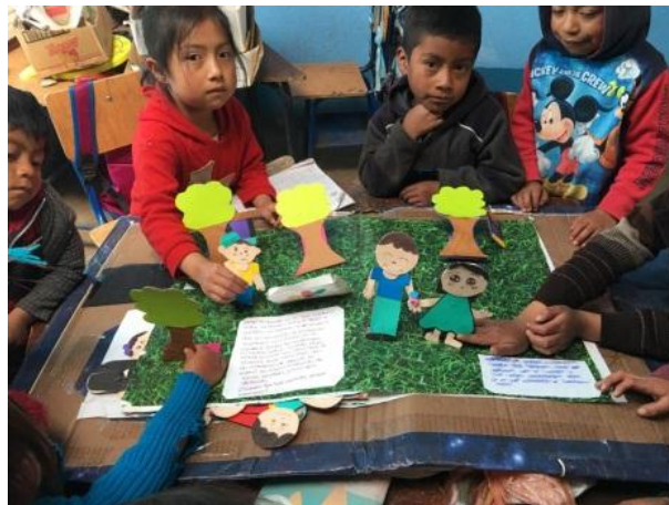
Imagen No. 11 niños contando cuentos