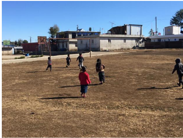
Imagen No. 5 niños buscando lugar donde dramatizarán el mercado

El mercado: después de haber elaborado las frutas y verduras, se les preguntó a los niños y niñas quienes habían ido al mercado a comprar con sus madres, cada niño levantaba la mano antes de opinar, después de las respuestas los estudiantes salieron a observar en su alrededor para buscar un lugar agradable para poder dramatizar el mercado ,al fin se consiguió el lugar, cada niño y niña buscaron sillas, mesas, petates, se dirigieron a sus lugares indicados, se empezó con la dramatización con la participación de dos niños quienes fueron de compras, lo que consumían todos los días, luego entraron otros dos así pasaron todos al final dieron a conocer lo que tenían en sus canastas, cuanto les constó, se les pregunto si se divirtieron , luego se les pregunto qué fue lo que más les gusto hacer, lo que aprendieron al ir en el mercado solos sin sus mamas, empezaron a participar diciendo que estuvo muy al alegre y que seguirían hiendo con sus madres en los mercados así aprender o conocer otras cosas que se venden en los mercados.