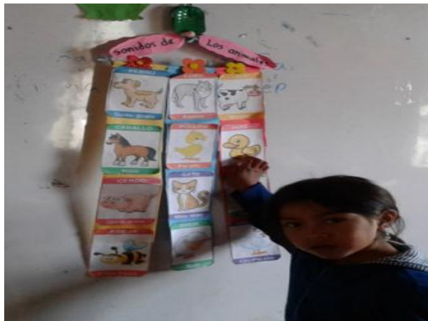
Imagen No.6 niños imitando sonido del animal

Fueron mostrando y se fue formulando cuento con las imágenes que tenían en sus manos. Se les entregó hojas con dibujos y papel china donde empezaron a rellenarlo de bolitas. Al final se le pregunto a cada uno lo que habían aprendido del tema, todos lograron responder adecuada mente a las preguntas realizadas.