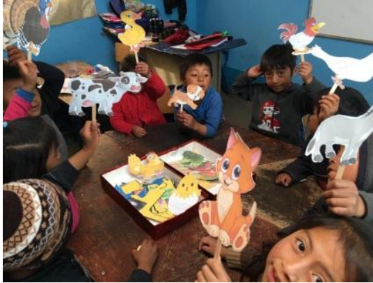
Imagen No. 2 Niños mostrando los animales domésticos.