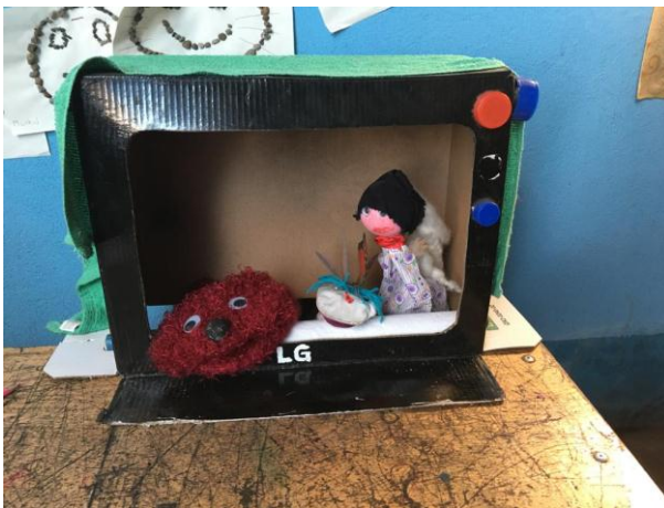
Imagen No. 7 niños dramatizando personajes de un cuento

Teatrín: se elaboró una muñeca de trapo un perro, oveja y con todos los dibujos que habían dibujado se organizó un teatrín con los estudiantes con todos los personajes que tenían en sus manos, todos los niños tuvieron que aprender palabras claves antes de participar en el teatrín, después de algunos días de ensayo al fin aprendieron las palabras, invitaron a los estudiantes de primer grado para que estuvieran presente en la presentación del teatrín tema: Ana y toby el perrito jugueterón, después de haber presentado el teatrín se les preguntó a los estudiantes lo que sintieron al participar, que fue lo que aprendió, que mensajes escucharon.