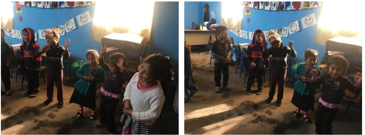
Imagen No. 12 niños bailando y cantando

Después de haber visto todas las imágenes de frutas, verduras, medios de transporte, plantas, animales entre otros, los niños y niñas inventaron cantos donde bailaron, gritaron, aplaudieron, brincaron todos, ellos estaban felices, se había buscado bocinas, música de fondo, con todo eso se logró la participación de los estudiantes, donde perdieron el miedo.