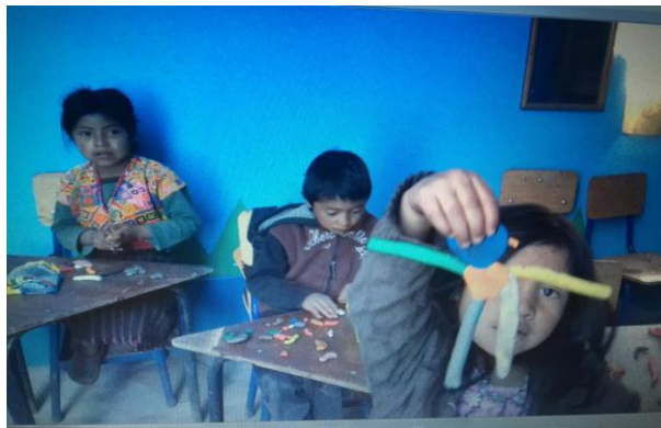
Imagen No. 4 niños elaborando frutas con fomy moldeable

Los niños y niñas felices por aprender nuevas cosas, visto todo lo que le rodea al estudiante se proceden a la elaboración de frutas y verduras que con fomy moldeable, primero clasificaron los fomy por colores en canastas pequeñas luego se empezó a elaborar frutas que crecen en su contexto, terminada con la primera actividad se empezó a elaborar verduras que conocen, terminando con cada actividad se les pregunto a los niños si todos consumían se les explico las vitaminas que les dan cuando consumen frutas y verduras con las medidas higiénicas necesarias.