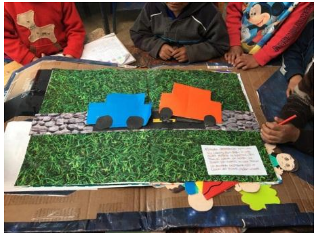
Imagen No.10 niños inventando cuentos