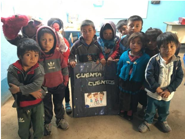
Imagen No. 9 niños con el libro “cuenta cuentos”

Al finalizar se les preguntó qué es lo que vieron al principio del libro y todos respondieron con las respuestas esperadas.