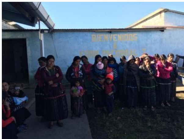
Imagen No. 1 Reunión con padres de familia

El día lunes seis de enero del presente año, se realizó una reunión con padres de familia de los dieciséis niños, se hizo la presentación del proyecto de mejoramiento educativo que es Elaborar imágenes contextualizadas conocidas en la comunidad, con una duración de ciento veinte horas , que está dividida en nueve fases, donde también; se les pidió el apoyo hacia sus hijos de las diferentes actividades a realizar durante la ejecución del proyecto, madres de familia intervinieron, externaron que si están de acuerdo en el proyecto ya que ayudara a sus hijos a desenvolverse, como perder el miedo, la timidez, ayudándolos a que conozcan más sobre lo que está en su contexto, a tener buena memoria. Durante las intervenciones, también ofrecieron su apoyo en el desarrollo de las actividades a realizarse posteriormente.