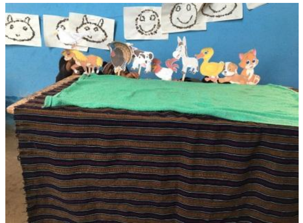
Imagen No.8 niños imitando sonido de animales domésticos