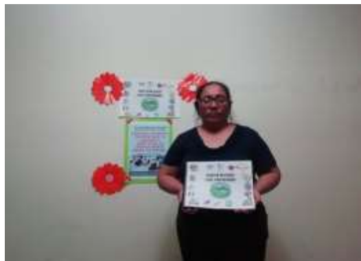
Fotografía 11 Presentación del folleto a la comunidad educativa