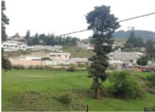
Fotografía N° 4 Comunidad la Colina.