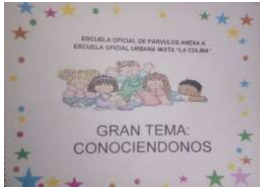
Fotografía N° 10 Organización del folleto por bloques