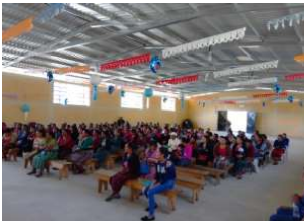
Imagen No. 6