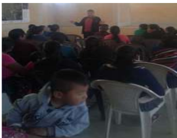
Imagen No. 4

Organización de comité de padres de familias Sobre el PME