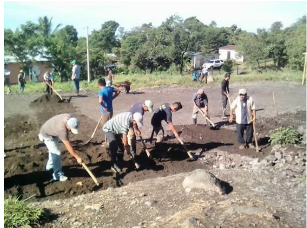
Ilustración 13 mantenimiento de la tierra para la construcción. Fecha: Octubre 2020

La experiencia consiste en que nuestra población escolar incrementó y las instalaciones no eran aptas para atender a todos los alumnos por esta razón se pensó en gestionar un aula para poder darles atención a todos los alumnos, de esta manera citamos a los miembros del consejo de padres y a los del COCODE para planificar de qué manera podemos gestionar, redactamos solicitudes a diferentes instituciones y gracias a Dios