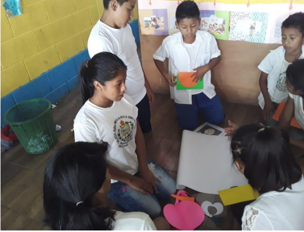
Ilustración 14 actitud docente. Fecha: Octubre 2020