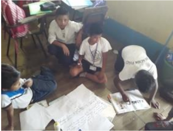
Ilustración 17 recursos. Fecha: Octubre 2020