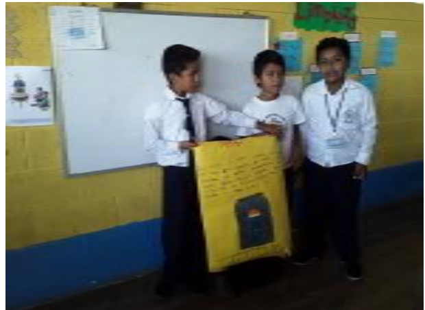
Ilustración 18 relación con la comunidad. Fuente: Sarceño, E. Fecha: Octubre 2020