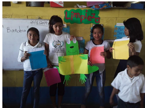
Ilustración 4 actividad de valores técnica la ranita. Fecha: Octubre 2020

Los juegos tienen como finalidad de divertirse, sin embargo, se puede generar aprendizaje por medio del juego. Esta experiencia se desarrolla con integración de área de Formación Ciudadana con la competencia “Que promueve acciones para fortalecer la existencia de actitudes y prácticas de cultura de paz en diferentes espacios y