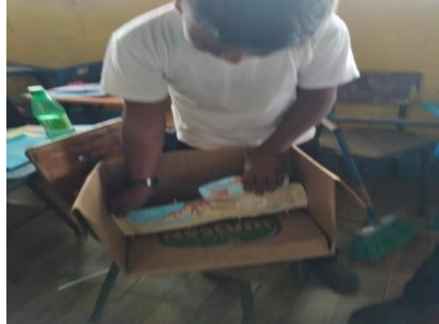
Ilustración 11 representación de flora y fauna. Fecha: Octubre 2020

Así fue que se les hizo saber que “Biomás y Ambiente” se trata de un ecosistema donde se pueden encontrar animales, bosques, ríos además de eso pertenecen a una geografía o lugar donde viven o se encuentran de igual manera el ambiente que es muy especial para ellos por la forma de vivir en un ecosistema. Así mismo se les dio un ejemplo para que los alumnos comprendieran mejor el tema.