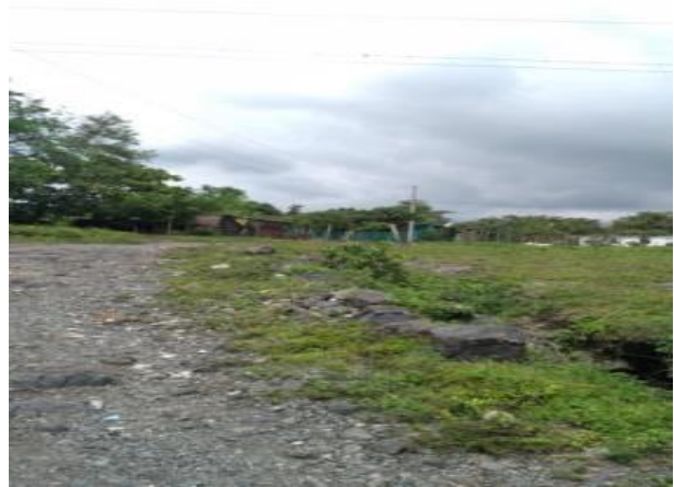
Ilustración 12 cuidado del medio ambiente. Fecha: Octubre 2020

La experiencia consiste en, inculcarles a los alumnos acerca de cómo mantener nuestro ambiente libre de contaminación no tirando basura en las calles y ver de qué manera podemos aprovechar la basura clasificándolo para darle un segundo uso.