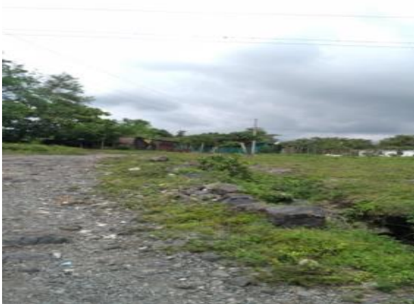
Ilustración 19 articulación escuela y desarrollo comunitario. Fecha: Octubre 2020