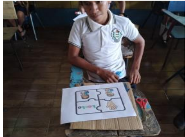
Ilustración 8 actividad de rompecabezas sobre los órganos del cuerpo Fecha: Octubre 2020

La experiencia fue exitosa en que los alumnos participaron en la dinámica el repollo preguntón, al alumno que le quedaba el repollo menciona el nombre de un sentido, el siguiente niño que queda con el repollo, menciona el órgano principal del sentido antes mencionado y así sucesivamente se logra la participación de los algunos, al terminar la dinámica se forman equipos de trabajo tomando en cuenta la