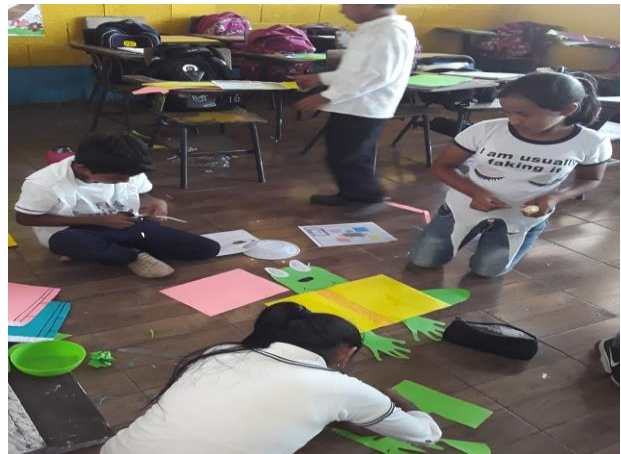
Ilustración 5 actividad sobre los valores. Fecha: Octubre 2020

Seguidamente cada grupo pasó a exponer el tema que trabajó y luego cada grupo pegó su cartel en el lugar que le corresponde.