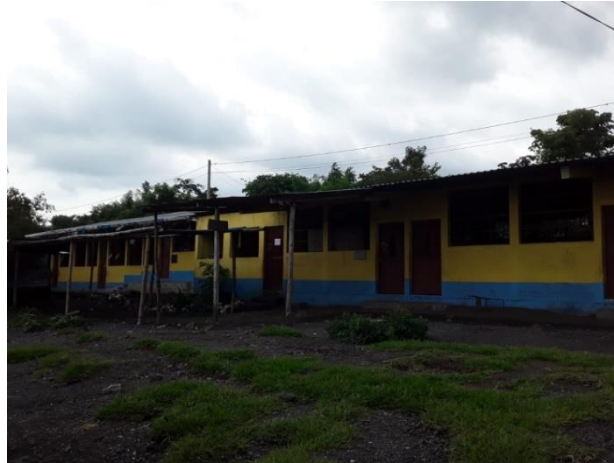
Ilustración 3 EORM La Zona y Miramar. Fecha: Octubre 2020

La Escuela Oficial Rural Mixta Aldea la Zona y Miramar del municipio de Santa Bárbara Suchitepéquez inicio en Enero del 2007 dando inicio como escuela municipal donde era el beneficio en el antiguo beneficio, luego se trasladó a la Casa Patrona y luego al Centro de la Aldea en una galera donde los niños