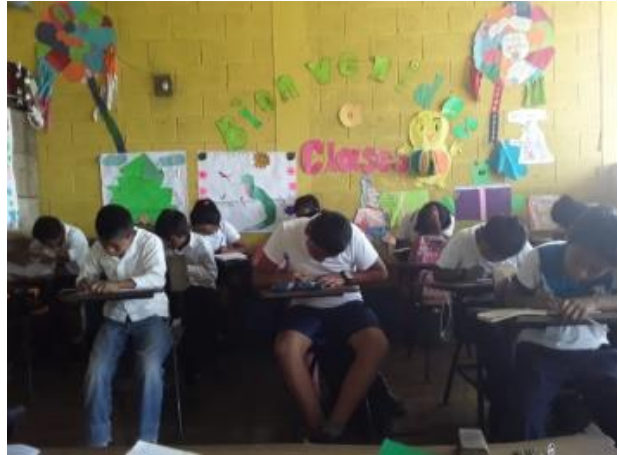
Ilustración 2 aula de cuarto grado. Fecha: Octubre 2020

El aula donde ejerce sus conocimientos es de block, lamina techada, es de piso cerámico, mide 4 x 4 de longitud, con espacio amplio cuenta con ventilación de aire y espacios necesarios para trabajar y ejercer la docencia, cuenta con 16 escritorios, 1 pizarrón, que fue construida por el señor Otto Baldomero Nájera Porón, en el año 2009.