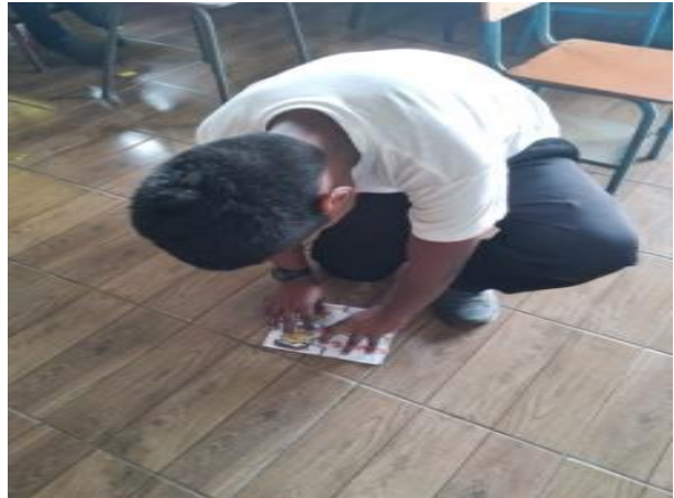
Ilustración 9 identificando las partes del cuerpo Fecha: Octubre 2020

Los alumnos no querían participar porque cada uno de ellos tenía el autoestima baja no se valoraban así mismo pero motivándoles aprendieron a valorar a los demás seres de su contexto permitiéndoles la armonía y convivencia social entre todos resaltando valores de paz y respeto.