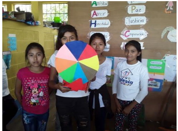
Ilustración 16 metodología. Fecha: Octubre 2020