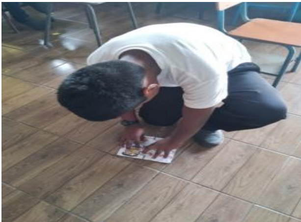
Ilustración 15 Clima de clase. Fecha: Octubre 2020