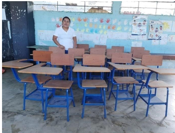
Ilustración 16 Fuente: Balán, M. Presentación del logro de proyecto de la compra de escritorios en beneficio de los estudiantes de Tercero Primaria, fecha: octubre 2020