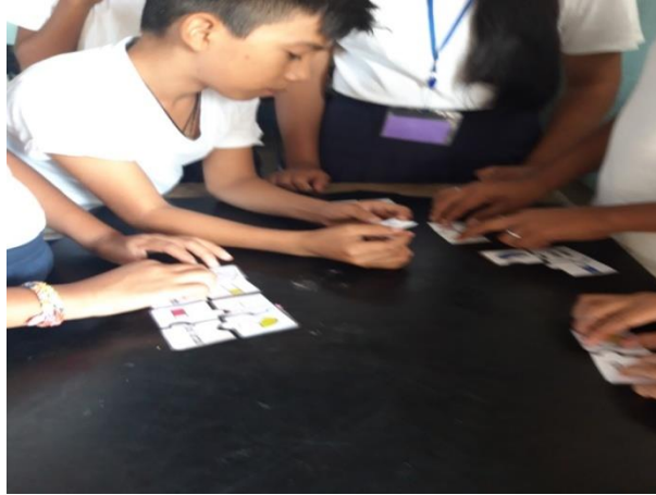
Ilustración 7 Estudiantes de Sexto Primaria practicando fracciones a través de un rompecabezas, fecha: octubre 2020