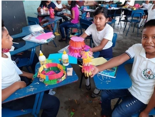
Ilustración 11