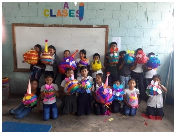
Ilustración 10 Fuente: Balán, M. presentación de las piñatas de los alumnos de tercero primaria, fecha: octubre 2020