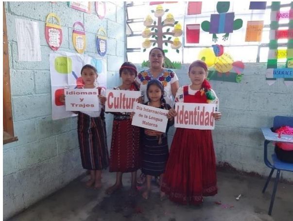
Ilustración 13 Desfile día de la lengua materna luciendo diferentes trajes típicos, fecha: octubre 2020