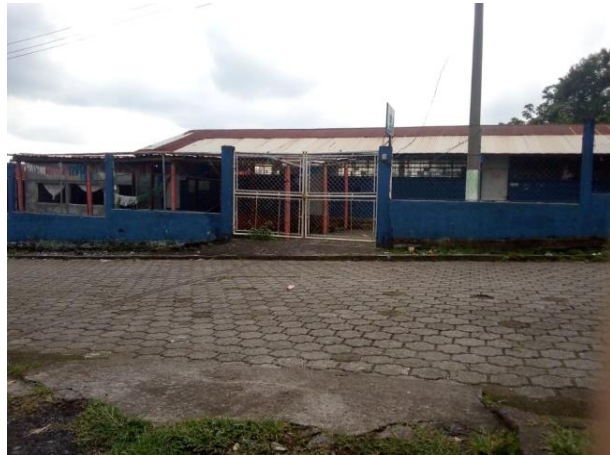
Ilustración 4 Fuente: Balán, M. EORM Aldea Santa Adelaida, fecha: octubre 2020

El edificio cuenta con 5 aulas puras con buena iluminación y ventilación y dos aulas provisionales cuenta con una dirección y tres baños lavables con paredes y puertas de metal distribuidos de la siguiente manera una para niños, uno para niñas y uno para maestros, cuenta con una cocina de block para cocinar la alimentación escolar de los estudiantes, existe un pequeño patio que los niños utilizan para recrearse.