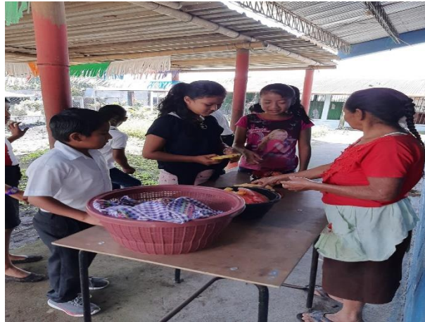
Ilustración 15 Fuente: Balán, M. Ventas en recaudación de fondos para la compra de escritorios por parte de los padres de familia, fecha: octubre 2020