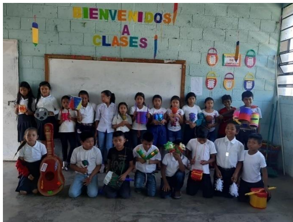
Ilustración 12 Estudiantes de Tercero Primaria presentando alegremente la finalización de su instrumento musical, fecha: octubre 2020