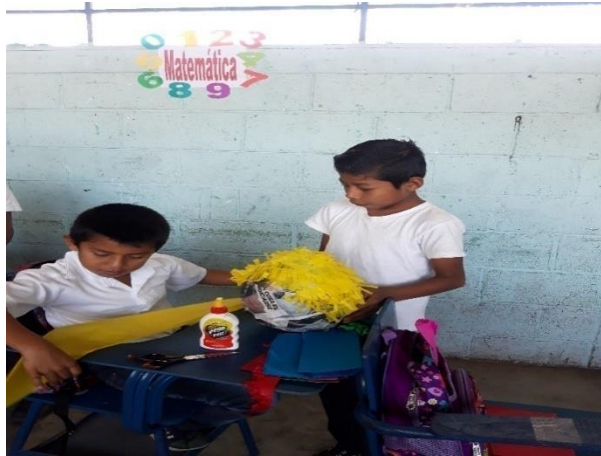
Ilustración 9 Estudiantes elaborando piñatas utilizando diferentes materiales, fecha: Octubre 2020