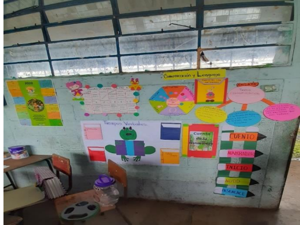
Ilustración 3 Fuente: Balán, M. Rincón de aprendizaje de Comunicación y Lenguaje L1, fecha: octubre 2020