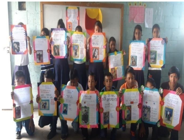
Ilustración 6 Fuente: Balán, M. Presentación del trabajo elaborado a través de la técnica es genial ser diferente, en el grado de Sexto Primaria, fecha: octubre 2020