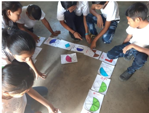
Ilustración 8 Fuente: Balán, M. Formando dominó con fracciones, fecha: octubre 2020