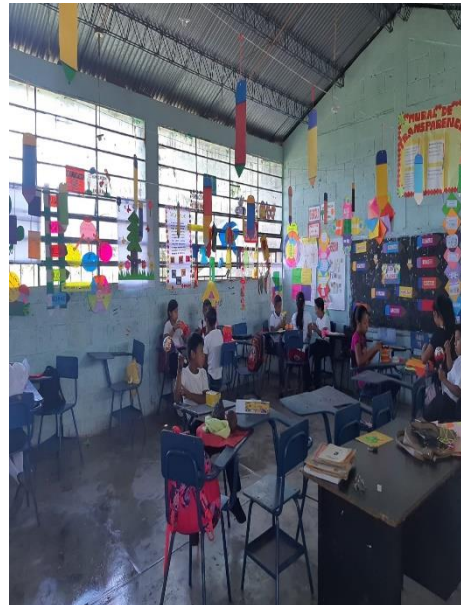
Ilustración 2 Fuente: Balán M. aula de Tercero Primaria, fecha: octubre 2020

El espacio dentro del aula es de 15 m. y 50 cm. Que se utiliza para las actividades educativas. Se cuenta con 1 catedra, 1 pizarrón, 1 estantería y 25 escritorios de paletas de color azul para cada alumno. Así mismo se cuenta con rincones de aprendizaje de cada área realizados por los estudiantes.