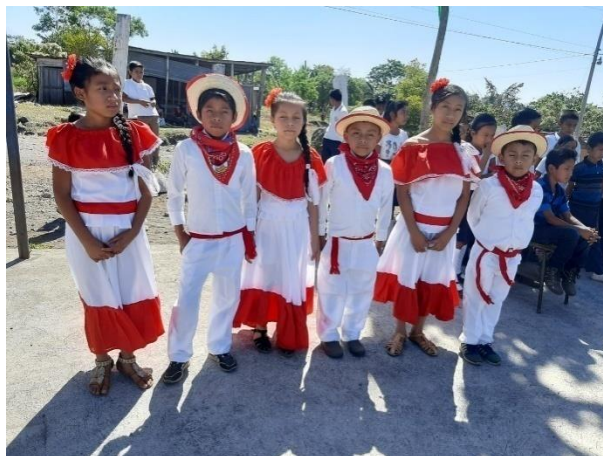
Ilustración 14 Fuente: Balán, M. Culminando el desfile del día de la lengua materna, fecha: octubre 2020