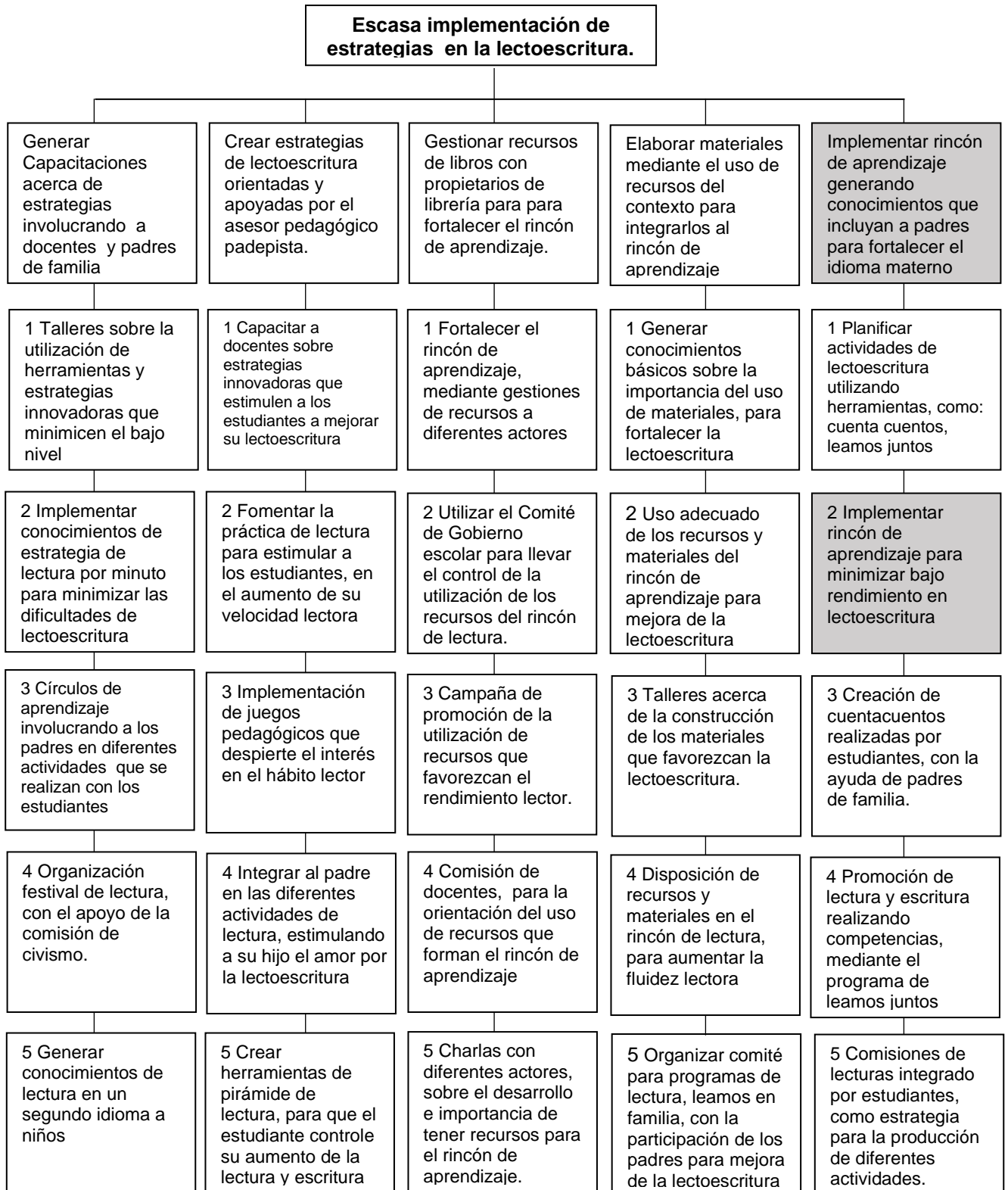
Tabla 5, Mapa de soluciones