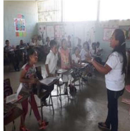
Explicación del PME a estudiantes