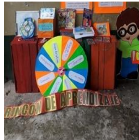
Rincón de aprendizaje con diversos