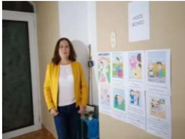
Figura 1612 Collages temáticos