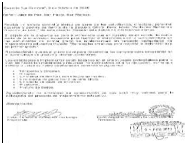
Figura 73 Solicitud de apoyo a Juez de Paz, Juzgado de San Pablo