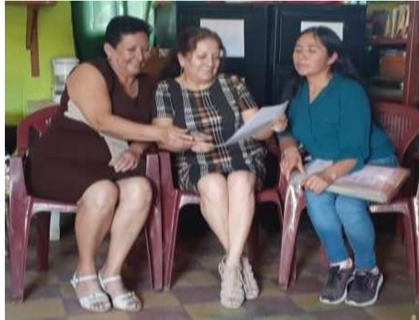
Figura 51 Socialización del proyecto a personal docente

En esta primera fase se realizó la solicitud a la directora del establecimiento para lograr la autorización y ejecución del Proyecto de Mejoramiento Educativo. Seguidamente se llevó a cabo la socialización del proyecto con la directora, personal docente para darles a conocer el objetivo del mismo, de igual manera se convocó a los padres de familia para darles a conocer la importancia del proyecto.