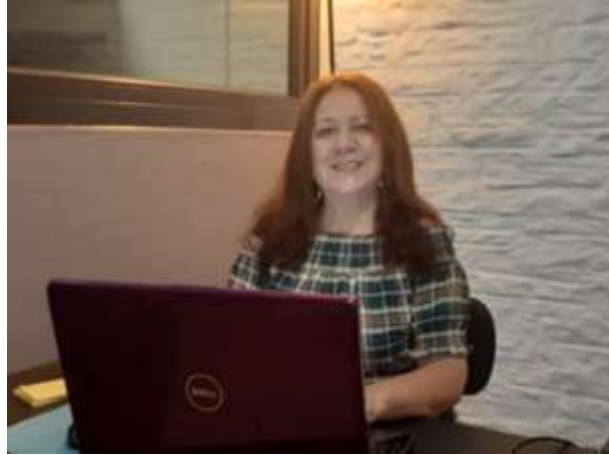
Realizando la evaluación del proyecto Mayo 2020