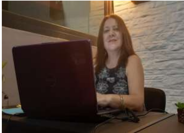
Figura 1814 Monitoreo de actividades del proyecto

Realizando el monitoreo del proyecto Mayo 2020