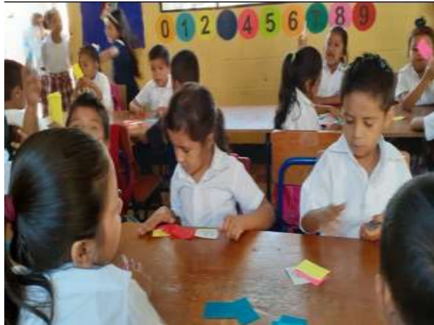
Figura 117 Escogiendo una letra y a jugar