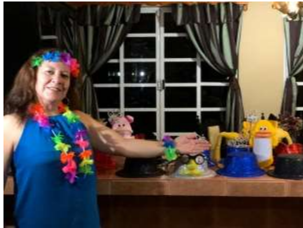
Figura 1511 Video sobre exposición de materiales para dramatizaciones y representaciones teatrales.