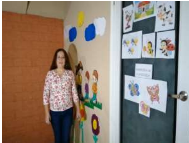
Figura 1713 Video sobre cuentos en familia

A través de esta actividad se logró motivar a los padres de familia sobre la importancia de los cuentos en familia, para desarrollar la comprensión lectora en los niños, reconociendo que el entorno familiar es el lugar idóneo para motivar la lectura, pues padres de familia y docentes la vemos como una prioridad, ya que de su aprendizaje dependen los logros o fracasos que los niños puedan alcanzar en el futuro.