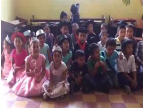
Figura 2116 Video de cierre de actividades del proyecto.

Fuente: Imagen propia. Video de cierre del PME. Mayo 2020 URL: https://youtu.be/Zz16kviftO0