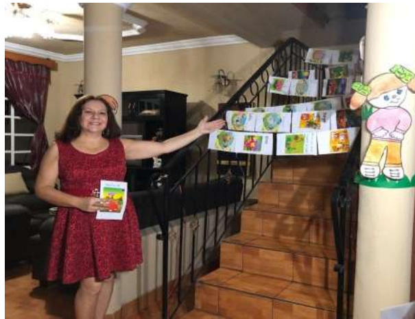
Figura 139 Video sobre tendedero de pequeños libros de cuentos

Para despertar la creatividad y mejorar la fluidez lectora se motivó a los niños a diseñar su propio libro de cuentos. Pero debido a la contingencia que se vive actualmente en el país no fue posible continuar con la aplicación presencial, buscando otras alternativas para seguir con las actividades del proyecto, readecuando la actividad correspondiente al tendedero de libros creados por los estudiantes y presentárselos a ellos de forma virtual desde mi casa.