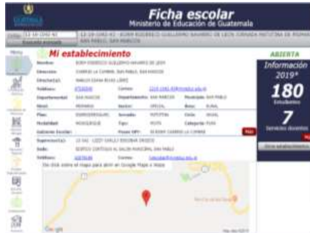
Figura 1.1 Datos del establecimiento educativo

Se puede notar en el cuadro anterior que los estudiantes comprendidos de 7 a 8 años son mayoría. Se considera que este dato se presenta porque estudiantes de estas edades se encuentran inscritos (en su mayoría) en primero y segundo grado de primaria, donde frecuentemente se observa que estudiantes reprueban los grados, posiblemente debido a malas técnicas de enseñanza de la lectoescritura, falta de apoyo de padres de familia y problemas de aprendizaje y psicológicos en el estudiante. Por lo que se analiza la necesidad de reforzar conocimientos, la selección de los docentes que impartan estos grados y el buscar técnicas de enseñanza para lograr el éxito y ver el cambio en la estadística de edades.