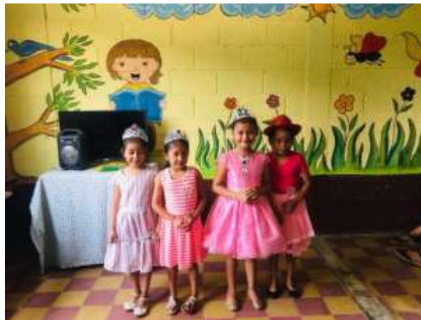
Figura 95 Decoración del aula de primer grado

Esta fue una de las fases más interesantes del proyecto, dando inicio a las actividades programadas con la ambientación del aula, limpiando, decorando y letrando para recibir a los estudiantes en un ambiente agradable y positivo en el cual los niños puedan sentirse felices, acompañados y queridos. Un espacio donde se respire la tranquilidad pero que en él exista el desarrollo, aspectos muy importantes que influyen en el aprendizaje puesto que en los ambientes agradables se re desarrolla mejor la convivencia pacífica a través de la práctica de valores alcanzando una cultura de paz.