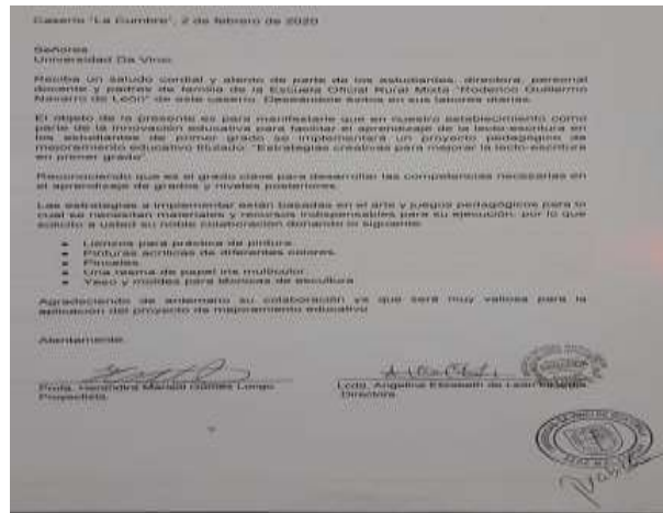
Figura 62 solicitudes de apoyo económico a Universidad da Vinci