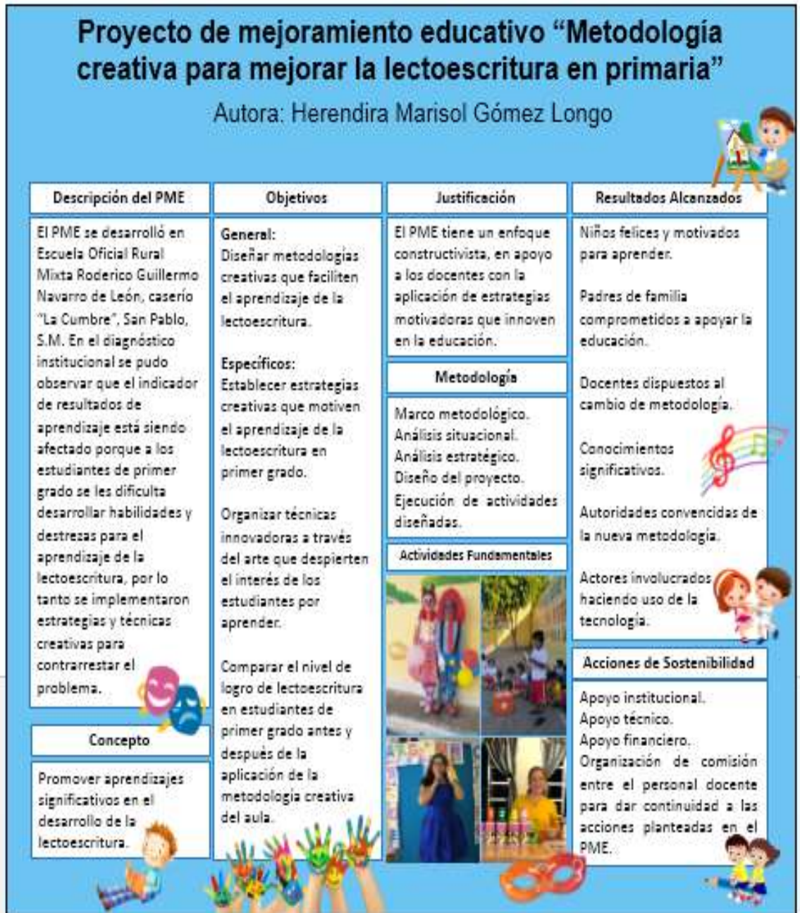
Figura 2217 Elaboración del poster del proyecto