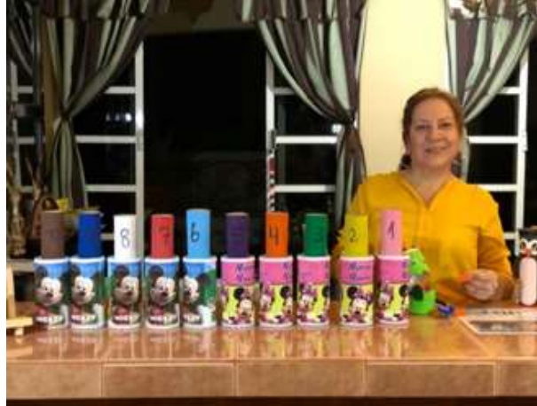
Figura 1410 Elaboración de manualidades, juguetes, y adornos con materiales de reciclaje.