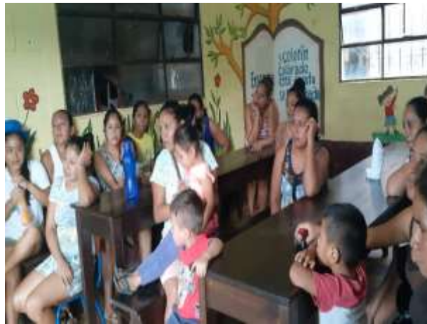
Figura 106 Lanzamiento del proyecto a padres de familia

Como siguiente actividad se convocó a los padres de familia de estudiantes de primer grado para darles a conocer las diferentes actividades a realizar en el proyecto solicitándoles el debido apoyo en el aprendizaje de sus hijos. El lanzamiento del proyecto se llevó a cabo con la participación de la directora, personal docente, estudiantes de primer grado, estudiantes de preprimaria y padres de familia de ambos grados.