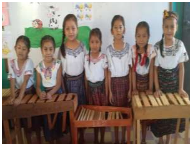
Figura 128 Festival de la canción

Las estrategias creativas fueron implementadas para desarrollar la conciencia fonológica y poder iniciar a los niños en la enseñanza aprendizaje del sonido de las letras a través de juego de rimas, trabalenguas y festival de la canción, logrando a través del canto que los niños se expresen, se comuniquen, aumentando su capacidad de concentración para aprender y enriquecer su vocabulario.