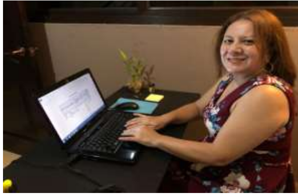
Figura 84 Elaboración de planificación de actividades del proyecto