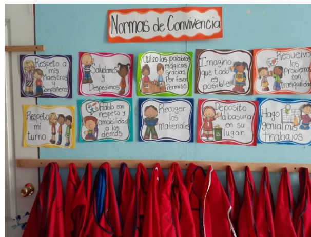
Figura 15. Normas de Convivencia

También se implementó El Cartel de Normas de Convivencia: Se seleccionaba cada día a un niño para que con apoyo de la maestra recordara las normas que se debían de practicar en clase. Fomentando el respeto y la convivencia pacífica y buena comunicación en clase. Árbol de los valores: Se asignaba un valor por mes y se colocaba en el árbol explicándole a los niños lo que representaba y las acciones que se debían de realizar para darle cumplimiento a ese valor. Se le pedía cada a los couches que recordaran el valor al momento de Realizar una ronda u juego o en las actividades que se trabajaban.