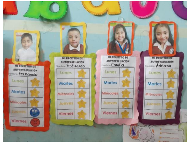
Figura 14. Registro de autoevaluación

Registro de Tareas: Para darle seguimiento al mural de Desempeño se trabajó el Registro de Tareas, los padres de familia llevaban un control de las actividades que se realizaban durante la semana en casa. El cuál sería para que el propio niño fomentara su propia disciplina en casa. Emociometro: Este era una actividad que se utilizaba para registrar el estado de ánimo de los estudiantes, permitía comprender las emociones que los niños presentaban durante el día.