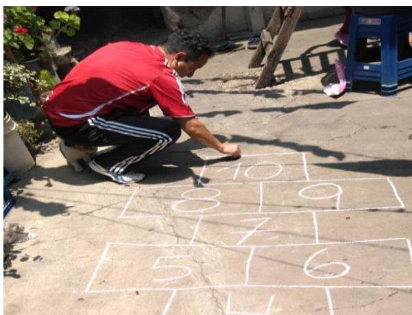
Figura 11. Apoyo de Padre de familia

A través de las actividades se podía observar el involucramiento de los padres de familia y el interés que se manifestaba por cada una de las actividades en las que participaba. Así mismo se realizó con los niños talleres de Desarrollo emocional y musicoterapia, siendo una actividad muy significativa para los estudiantes. Ya que era un momento en donde se podía observar la libertad y expresión de los niños y niñas, manifestadas a través de los movimientos con su cuerpo, aumentando la confianza en sí mismo y el interés por aprender algo nuevo cada día.