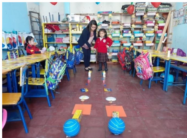
Figura 19. Dando instrucciones

Siempre había palabras que motivaban al estudiante para que realizara de la mejor manera sus actividades respetando el ritmo de aprendizaje, se les hacía ver en que estaban fallando, en que debían de mejorar pero sobre todo se felicitaba siempre por el trabajo que habían realizado y el desempeño que demostraban en cada actividad.