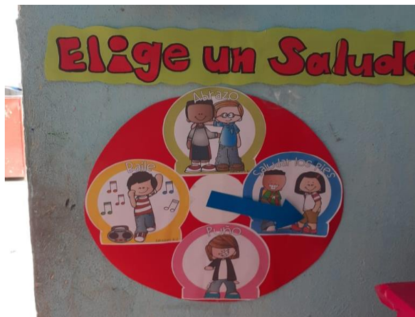
Figura 17. Registro de autoevaluación

Aplicación de ruleta del saludo: Al entrar al salón los niños escogían un saludo a través de la ruleta, la maestra y el niño se saludaban con un abrazo, bailando, saludo con los pies, si venían tristes hasta cierto punto cambiaba su estado de ánimo ya que podían sentir la actitud positiva de la docente. Frase motivacional del día: A través de un mural se colocaban frases positivas, para motivar a los estudiantes durante el día y brindando mensajes teniendo como objetivo principal elevar su autoestima. Ya que muchas veces decían que no podían hacer las cosas o se rendían y no terminaban las actividades