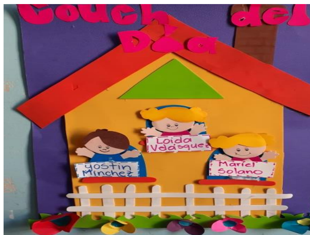
Figura 13. Taller de Desarrollo Emocional

Estas actividades fomentaban el trabajo en equipo ya que para ser trabajadas se elegía a los Couches por un día (niños) que eran seleccionados para apoyar a la maestra en la realización de actividades programadas durante el día, teniendo como base los juegos y rondas se complementan con actividades de liderazgo, que se le asignaban durante el día. Otra actividad muy importante que se puede mencionar es Mural de autoevaluación: este mural consistía en la autoevaluación que los niños se hacían para que evaluaran su comportamiento durante el día y semana. Siendo para los niños una motivación para lograr cumplir con todas sus actividades.