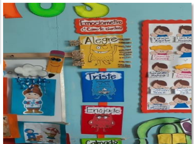
Figura 15. Cartel de emociometro