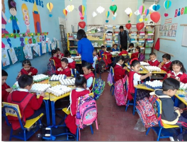
Figura 20. Trabajando actividades en el aula

Los días que transcurrían se podía observar el interés que los estudiantes demostraban en las actividades que la maestra planificada durante el día, evidenciando la asistencia y la participación de cada uno de los niños y niñas.