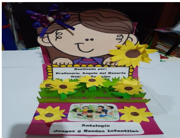
Figura 5. Antología de Juegos y Rondas Infantiles

compartida en físico con la Directora, Personal Docente, Autoridades Educativas, y Padres de familia. Cuyos actores tuvieron la posibilidad de leerlas e interesarse por dicho documento.