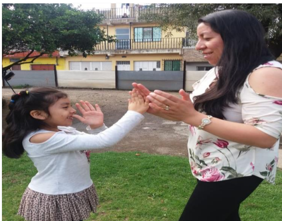
Figura 10. Juegos de manos

Durante la fase ejecución también se trabajó con talleres motivacionales dirigido a Padres de Familia, enfocados a concientizar sobre la importancia que tiene la paternidad afectiva y las beneficios que tiene en los procesos de aprendizaje, así mismo se practicaron juegos y logrando la interacción y buena comunicación entre padres de familia y estudiantes.