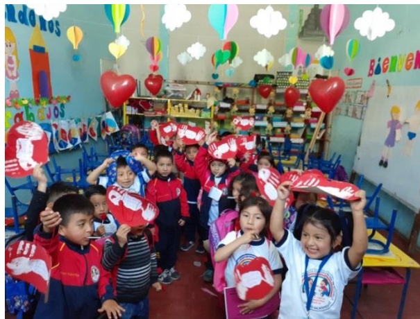
Figura 22. Estudiantes participando en actividades

El compañerismo y el trabajo cooperativo, se convirtió en una estrategia para lograr que los estudiantes trabajaran sin discriminación alguna, tomando en cuenta capacidades y limitaciones que hacían que uno al otro demostrara respeto, tolerancia y empatía dentro y fuera del aula. Y el Indicador de Contexto: Índice de Desarrollo Humano: se notaba el apoyo que los padres le brindaban a sus hijos, ya que siempre estaban pendientes de las actividades y comportamientos que habían tenido durante el día así mismo participaban en las actividades de la escuela. Al monitorear la asistencia de los estudiantes, aunado al acompañamiento efectivo de los estudiantes, se podía observar que los resultados no podían reportar deserción ni fracaso escolar, ya que los actores principales estaban activos durante las semanas de monitoreo