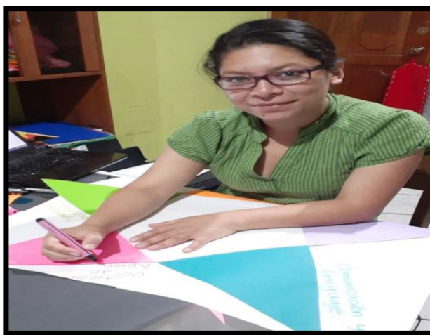
Figura 4. Elaboración de Material Didáctico

Así también se realizó el diseño elaboración de material didáctico, como los cartel de Valores, Mural de Normas de Cortesía, Ruleta del saludo, Cartel de Couch del día, registro de autoevaluación, que serían recursos fundamentales para implementarlos con los estudiantes, haciendo uso de la creatividad e imaginación.