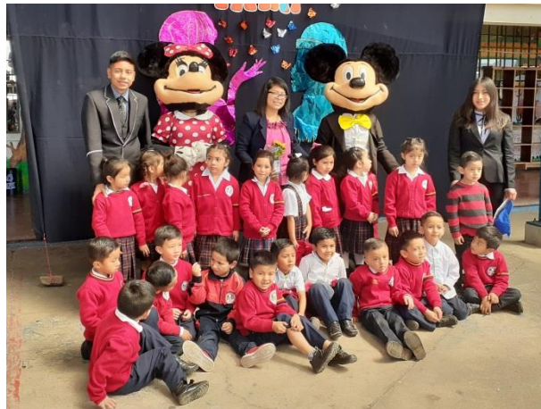
Figura 8. Divulgación de PME

Así mismo se realizó la divulgación del PME a través de una presentación de Rondas Infantiles, en el primer acto cívico, donde los niños, docentes, estudiantes y padres de familia apreciaron una bonita participación de los estudiantes de la párvulos II sección "F". logrando resultados positivos, y generando impacto desde el inicio a la comunidad educativa.