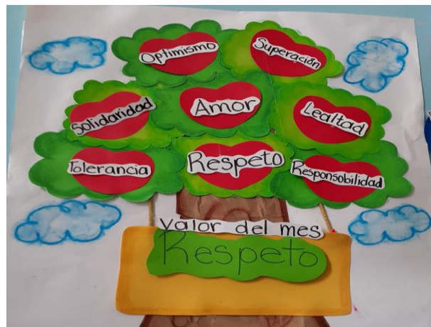
Figura 16. Dando instrucciones