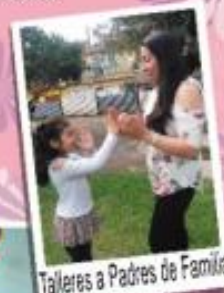
Talleres a Padres de Familia