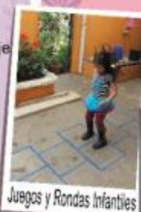
Juegos y Rondas Infantiles