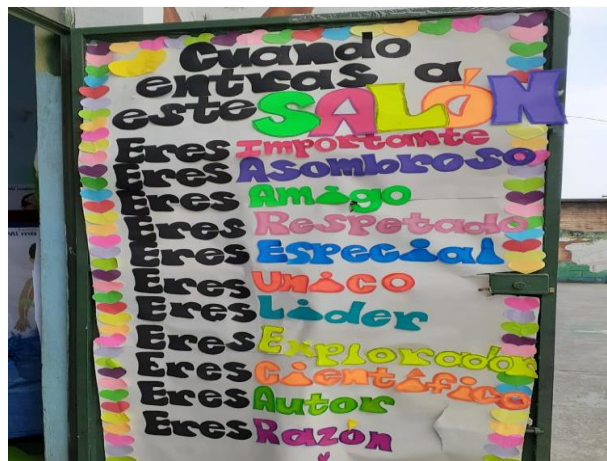
Figura 18. Frase motivacional