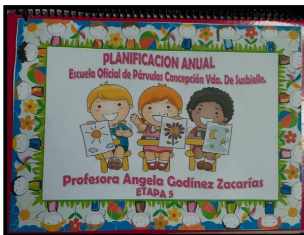
Figura 3. Elaboración de planificación anual

Así también se realizó el diseño elaboración de material didáctico, como los cartel de Valores, Mural de Normas de Cortesía, Ruleta del saludo, Cartel de Couch del día, registro de autoevaluación, que serían recursos fundamentales para implementarlos con los estudiantes, haciendo uso de la creatividad e imaginación.