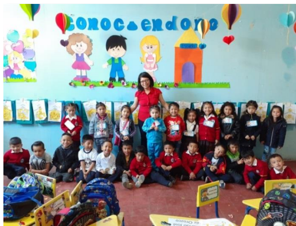
Figura 12. Cartel de Couch del Día.

Estas actividades fomentaban el trabajo en equipo ya que para ser trabajadas se elegía a los Couches por un día (niños) que eran seleccionados para apoyar a la maestra en la realización de actividades programadas durante el día, teniendo como base los juegos y rondas se complementan con actividades de liderazgo, que se le asignaban durante el día. Otra actividad muy importante que se puede mencionar es Mural de autoevaluación: este mural consistía en la autoevaluación que los niños se hacían para que evaluaran su comportamiento durante el día y semana. Siendo para los niños una motivación para lograr cumplir con todas sus actividades.