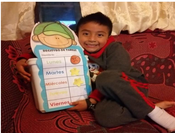
Figura 14. Taller de Desarrollo Emocional

Registro de Tareas: Para darle seguimiento al mural de Desempeño se trabajó el Registro de Tareas, los padres de familia llevaban un control de las actividades que se realizaban durante la semana en casa. El cuál sería para que el propio niño fomentara su propia disciplina en casa. Emociometro: Este era una actividad que se utilizaba para registrar el estado de ánimo de los estudiantes, permitía comprender las emociones que los niños presentaban durante el día.