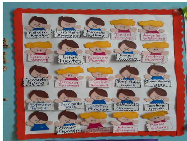
Figura 21. Cartel de asistencia

El indicador de Procesos Educativos: Asistencia de Alumno docentes, se evidenciaba en el cartel de asistencia ya que los niños asistencia cada día y con mucha alegría a recibir clases las actitudes que los estudiantes tenían al momento de jugar una ronda, jugar el avioncito, trabajar en equipo, o cómo sus movimientos iban adquiriendo coordinación en su cuerpo, así como también, se veía el fortalecimiento de su autonomía a través de las actividades que se les asignaba respondiendo día a día con responsabilidad y dedicación.