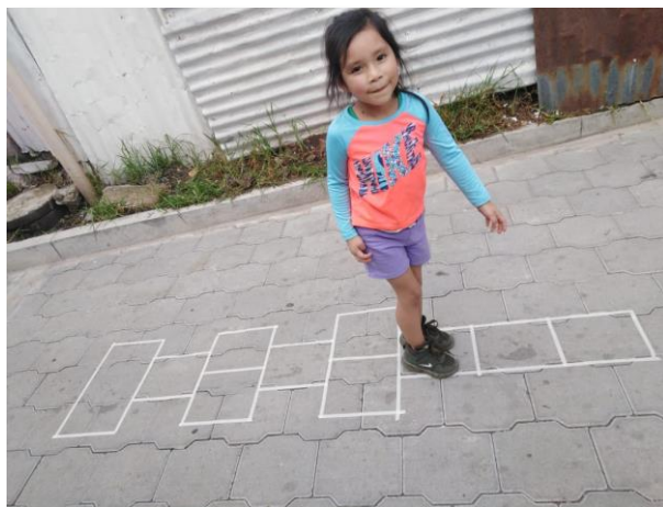
Figura 9. Juego del avioncito

El PME lleva como nombre “Juegos y Rondas potenciando la Escucha activa” cuyo objetivo principal era el desarrollo a través de actividades lúdicas se potencia habilidades y destrezas para el desarrollo integral de estudiante. El día se iniciaba con un juego o una ronda para activar desde muy temprano despertar el interés por aprender. La repetición de ritmos, sonidos y movimientos hacían que cada día el niño los perfeccionara, pero al mismo tiempo era una estrategia que hacía que activara sus conocimientos, para que a través del juego el mismo generara su propio aprendizaje. Se hacían preguntas relacionadas con el contenido mientras el niño o niña tenía actividad lúdica, o en otras ocasiones se hacía durante el desarrollo de la clase.