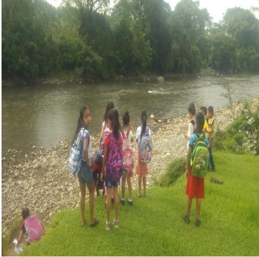
Ilustración 11. Recreación de estudiantes para el fortalecimiento de la convivencia.