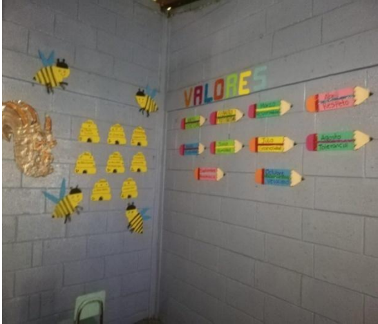
Ilustración 7. Implementación de mural de valores que se reforzarán.