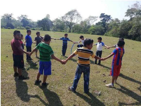
Ilustración 13. Actividades extraescolares.