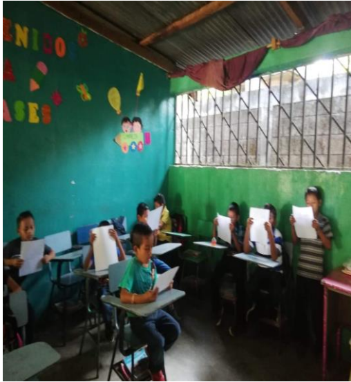
Ilustración 3. Lectura de los valores que se reforzarán.