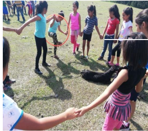
Ilustración 10. Inclusión de niñas en competencias.