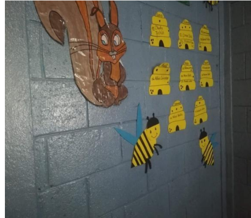
Ilustración 8. Implementación de murales de los valores.