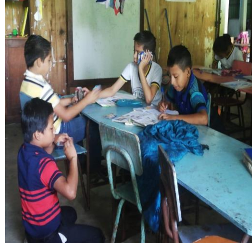
Ilustración 12. Inclusión de niños en el juego.