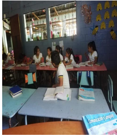
Ilustración 4. Formación de equipos de trabajo.