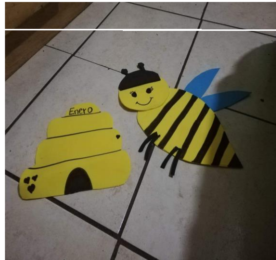
Ilustración 6. Elaboración de materiales para los murales sobre valores.