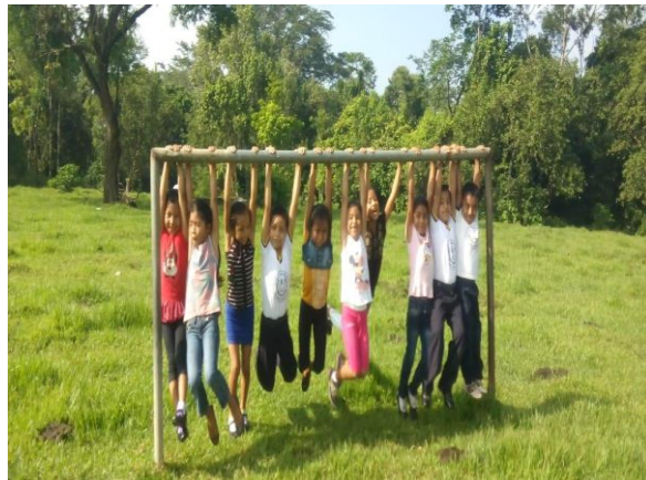
Ilustración 16 fortalecimiento de los valores a través de la convivencia.