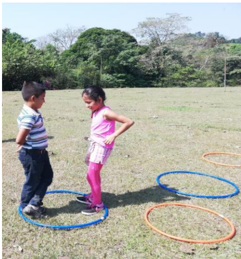
Ilustración 9. Realización de competencias para fortalecer la convivencia.