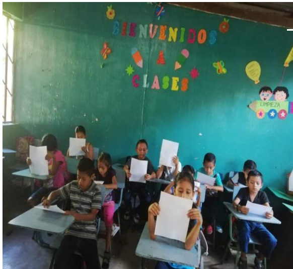
Ilustración 5. Rrepartición de valores que se van a reforzar. FUENTE: Ericka Siomara Cabrera Cardona