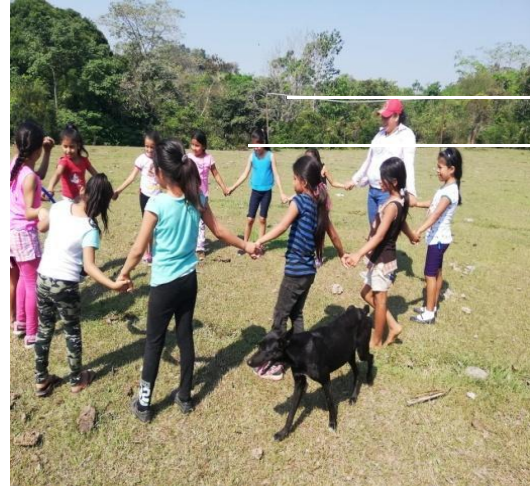
Ilustración 14. Momentos de convivencia.