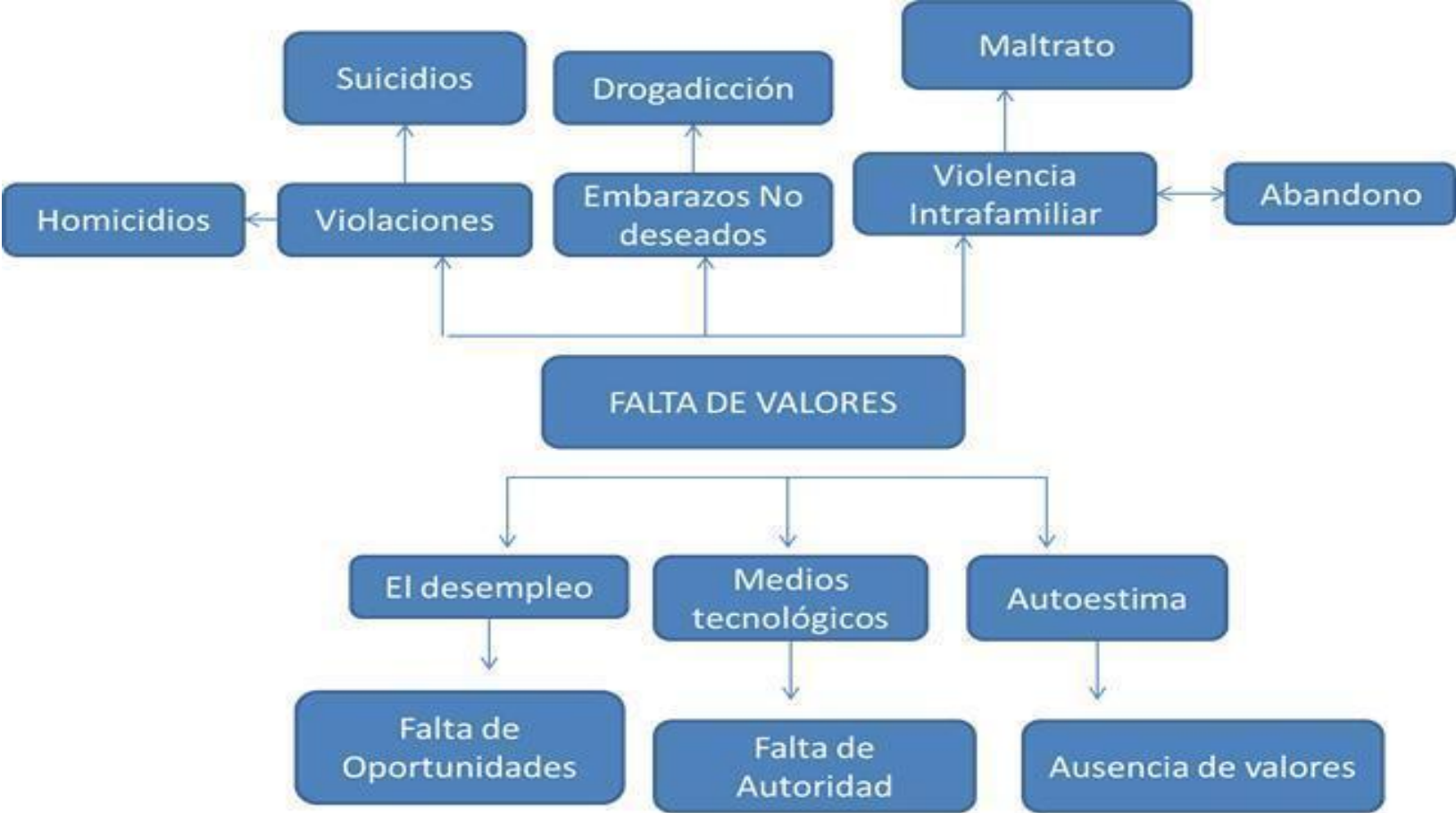
Ilustración 1. Árbol de problemas.