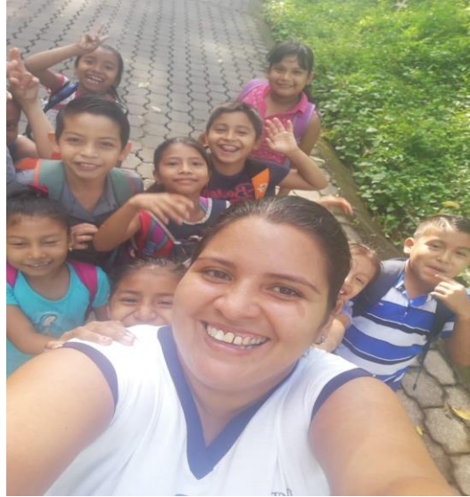
Ilustración 15. Convivencia y armonía para fortalecer los valores.